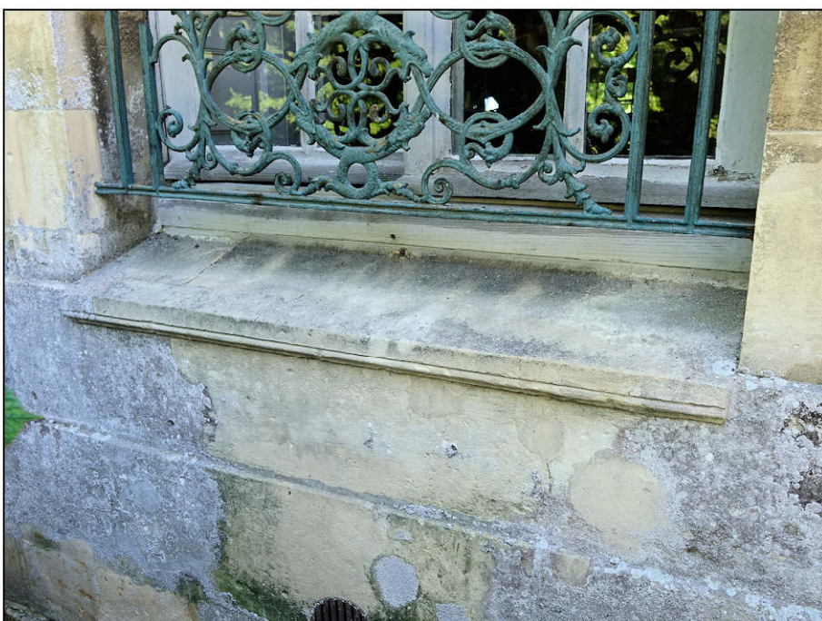
Fig. 3.7. Appui en pierre