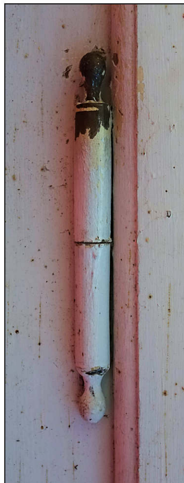
Fig. 3.5. Fiche à gond