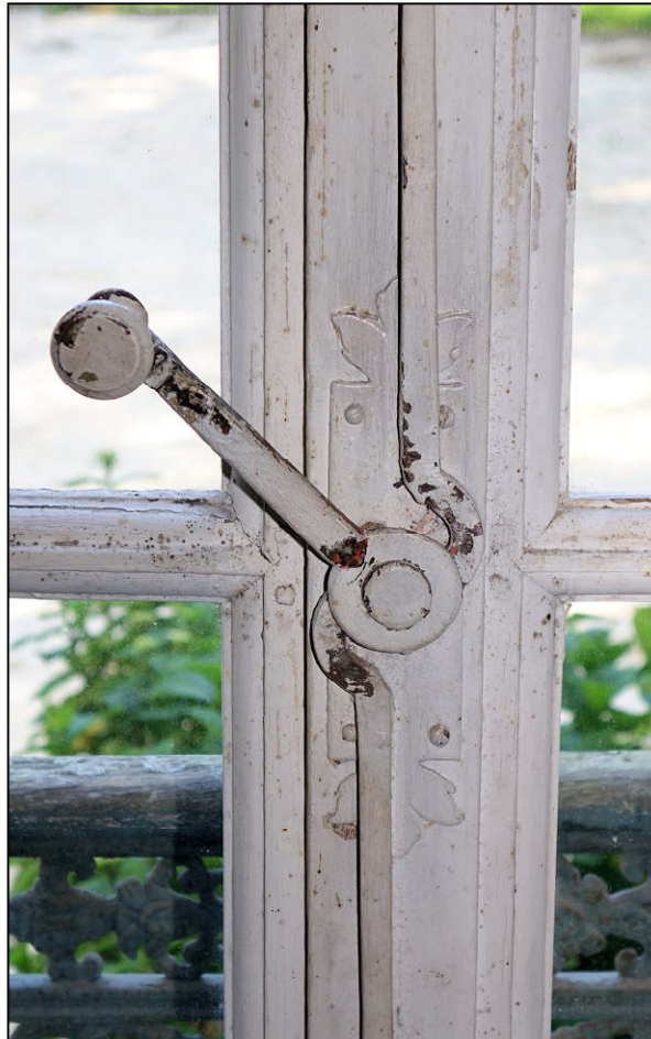
Fig. 3.2. Poignée