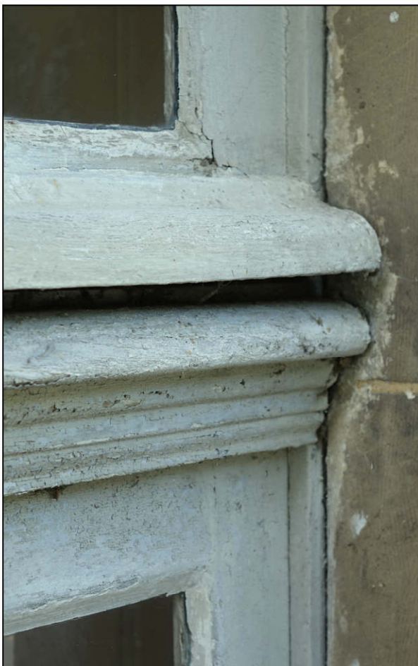
Fig. 3.4. Traverse d'imposte