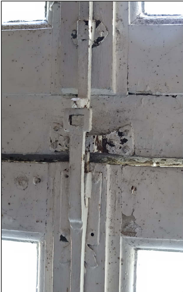
Fig. 3.1. Verrou supérieur