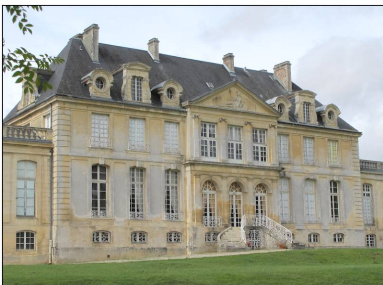
Fig. 1.2. Corps central (façade est)