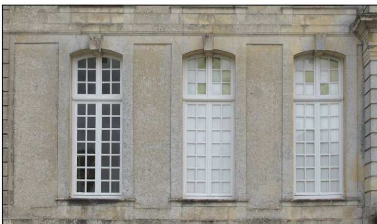
Fig. 1.4. Galerie nord (façade est)