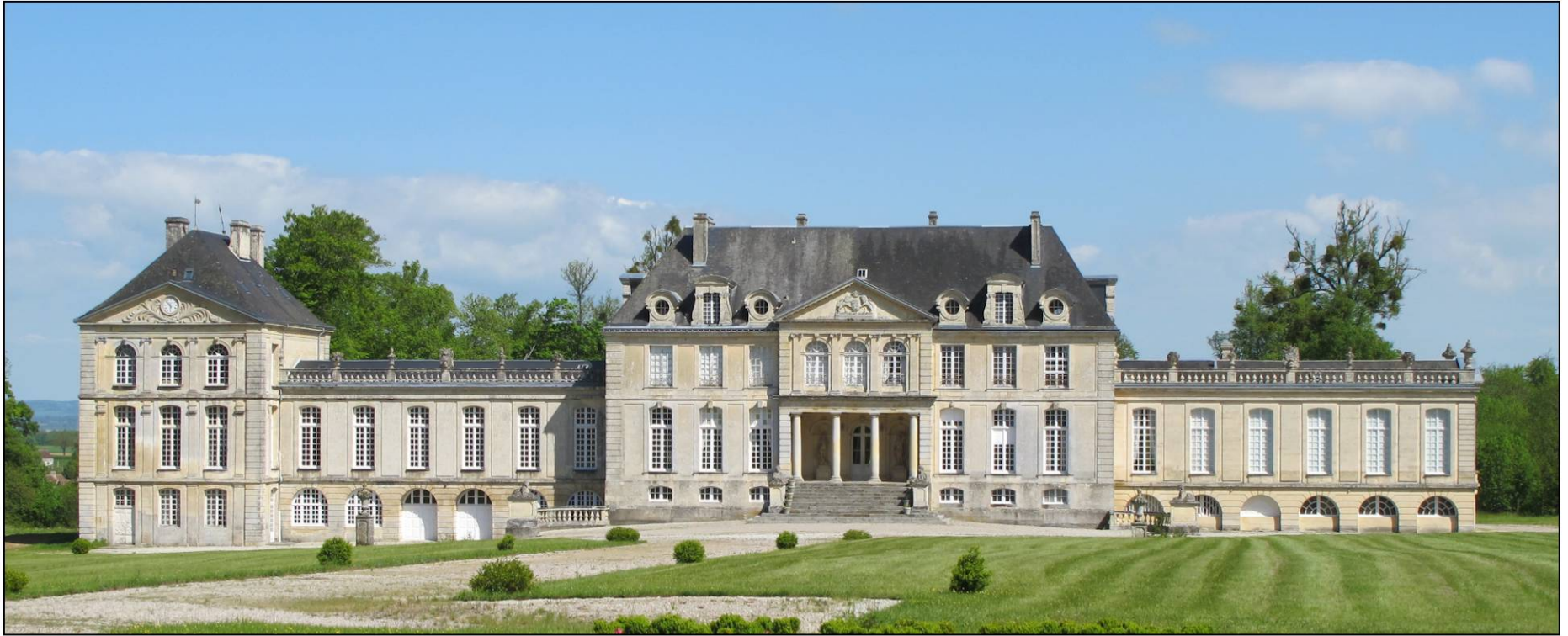
Fig. 1.1. Façade ouest