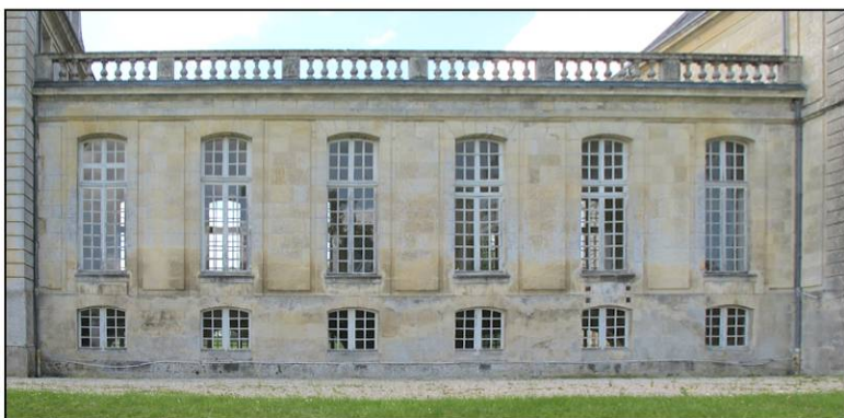
Fig. 1.3. Galerie nord (façade est)