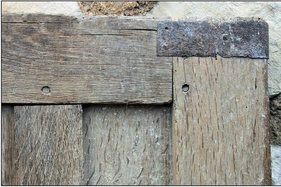
Fig. 2.1. Volet inférieur (intérieur)