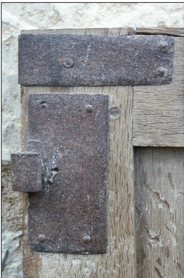
Fig. 2.5. Volet inférieur (intérieur)