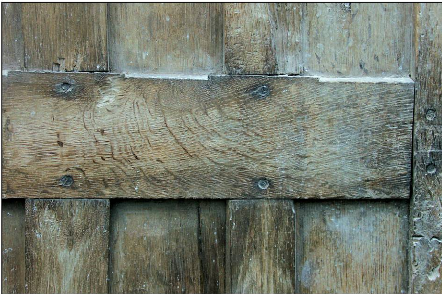
Fig. 2.3. Volet inférieur (intérieur)