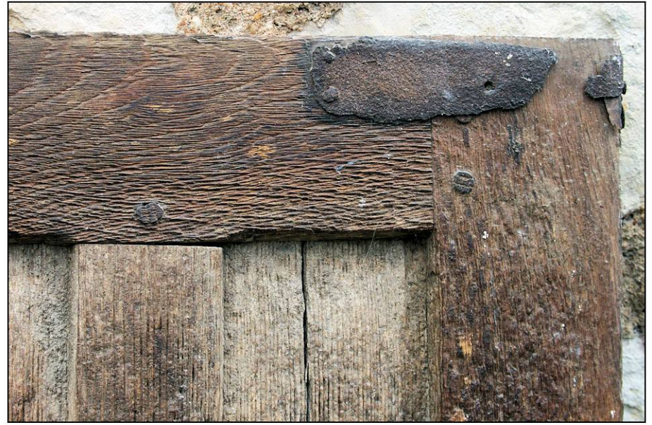
Fig. 2.2. Volet inférieur (extérieur)