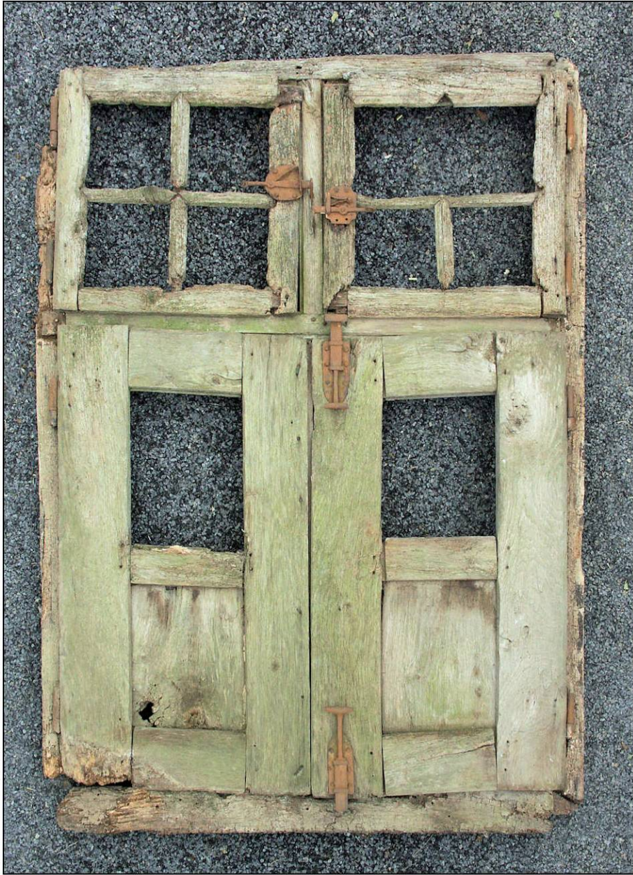
Fig. 1.1. Elévation intérieure