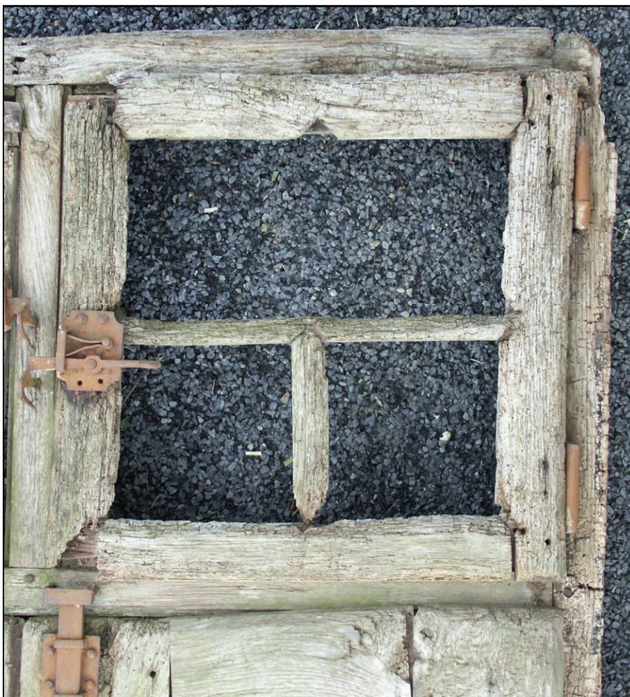
Fig. 1.3. Vantail vitré droit