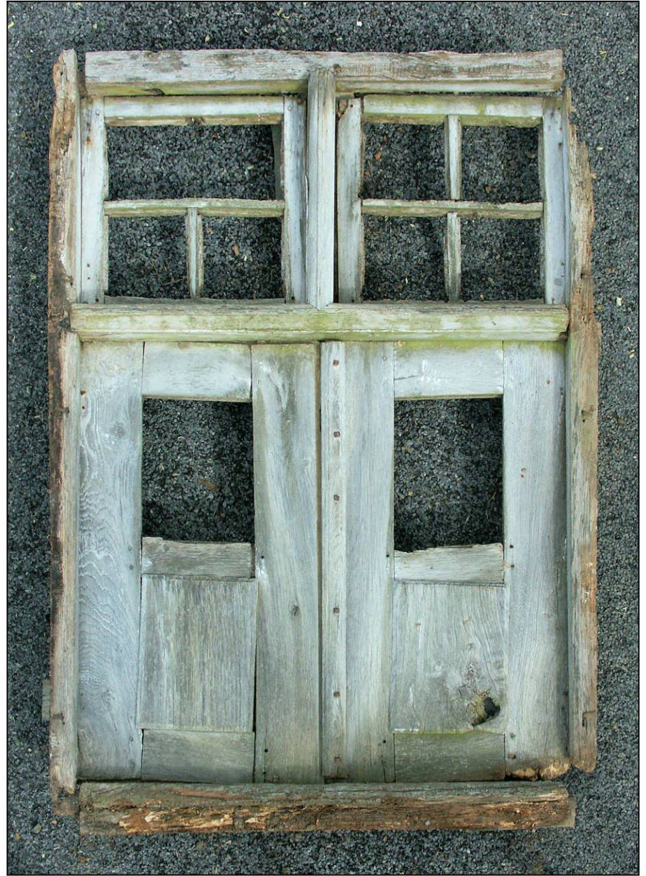
Fig. 1.2. Elévation extérieure