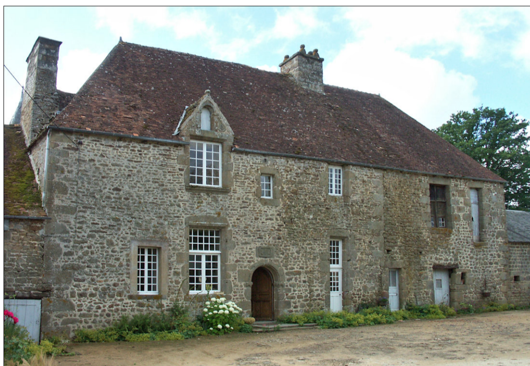
Fig. E.1. La façade antérieure sur cours