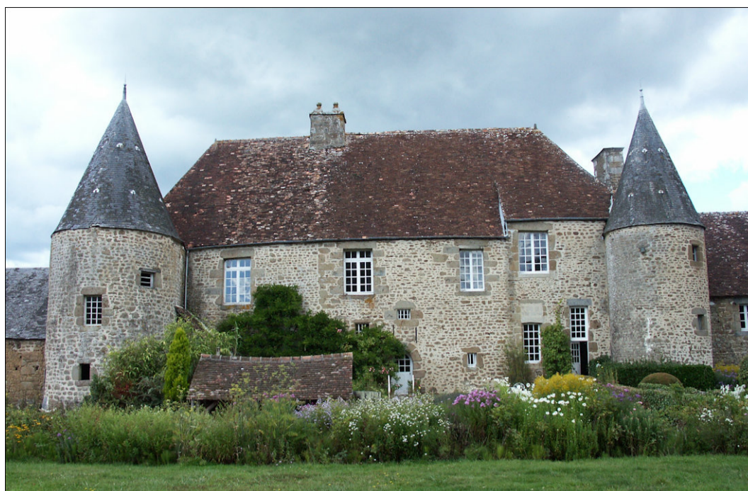
Fig. E.2. La façade postérieure sur les champs

La conception des volets est la même que celle du petit châssis. On notera toutefois que ceux du haut ont une hauteur plus élevée que ceux du bas et que les sections employées sont plus généreuses. Les vitreries mises en plomb étaient donc elles aussi inégales dans les mêmes proportions (plan n°5).