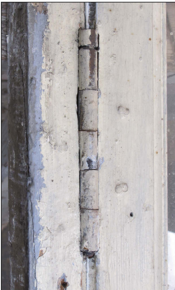
Fig. 6.4. Fiche à broche amovible (D)