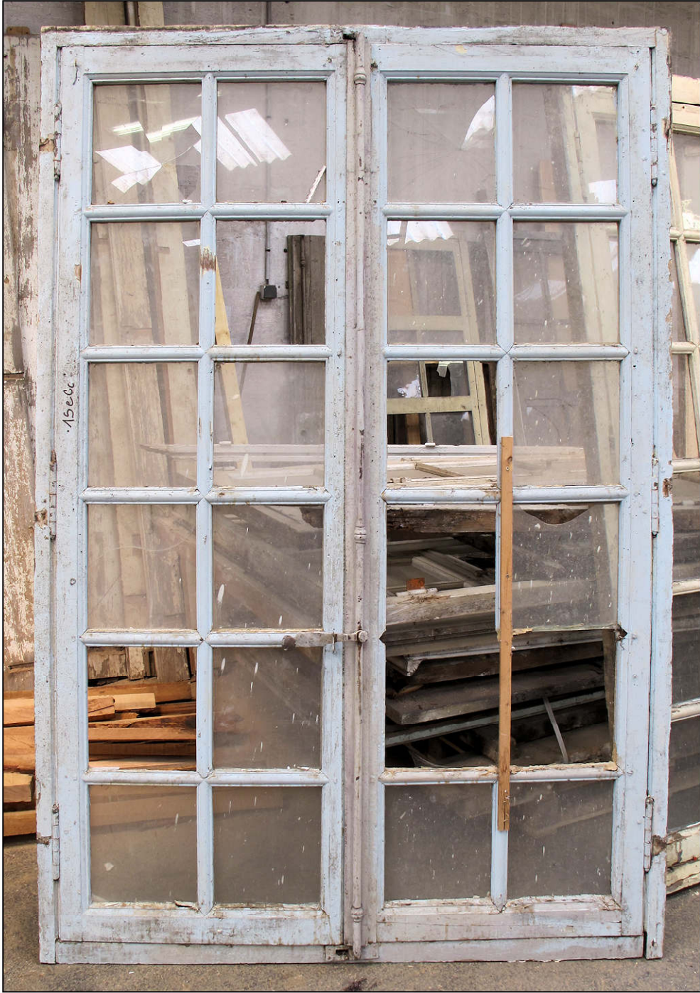
Fig. 6.1. Elévation intérieure (F)