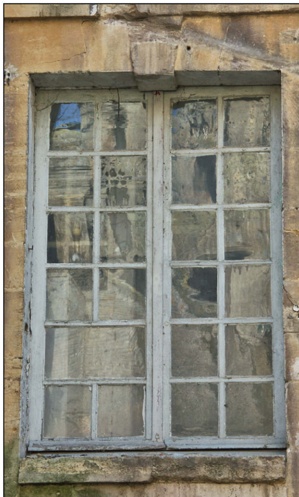
Fig. 6.5. Elévation extérieure (F)