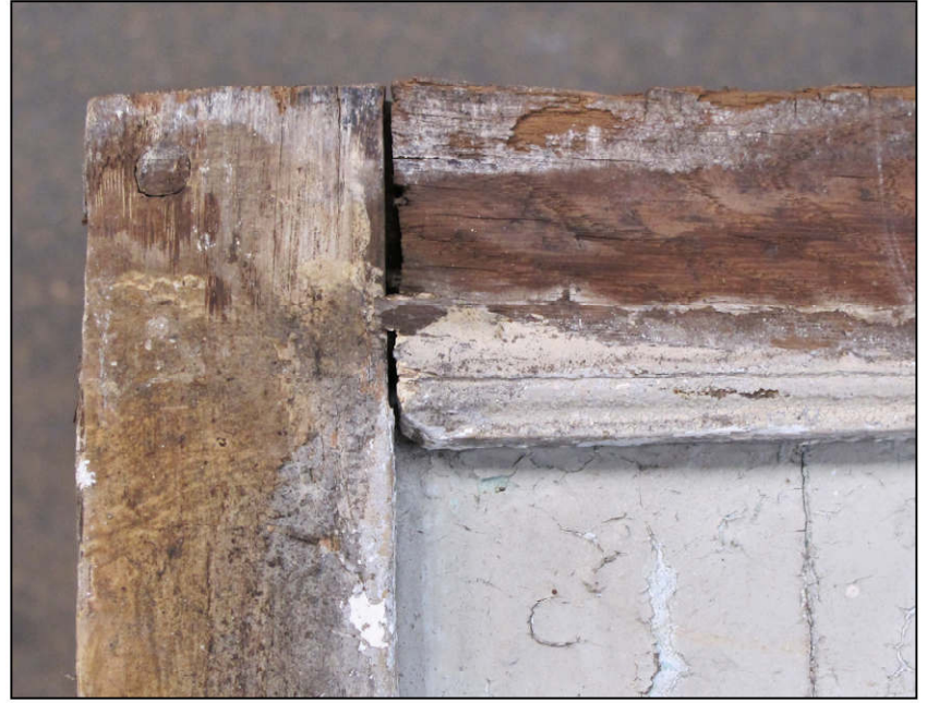
Fig. 6.2. Traverse d'imposte (F)