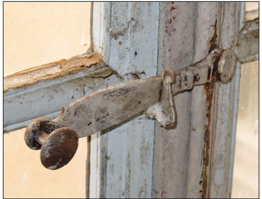
Fig. 6.3. Poignée d'espagnolette (F)