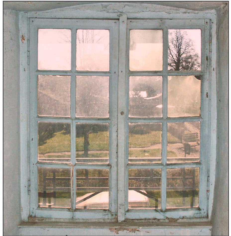
Fig. 4.4. Elévation intérieure (imposte C)