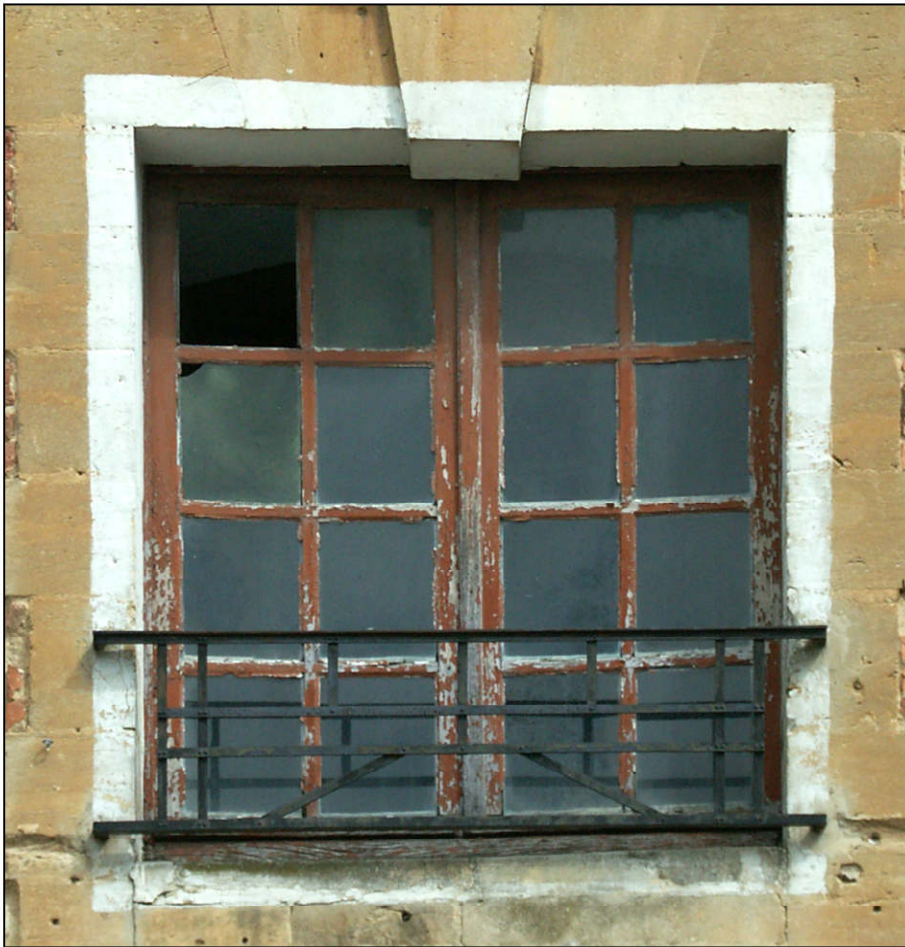
Fig. 4.3. Elévation extérieure (imposte C)