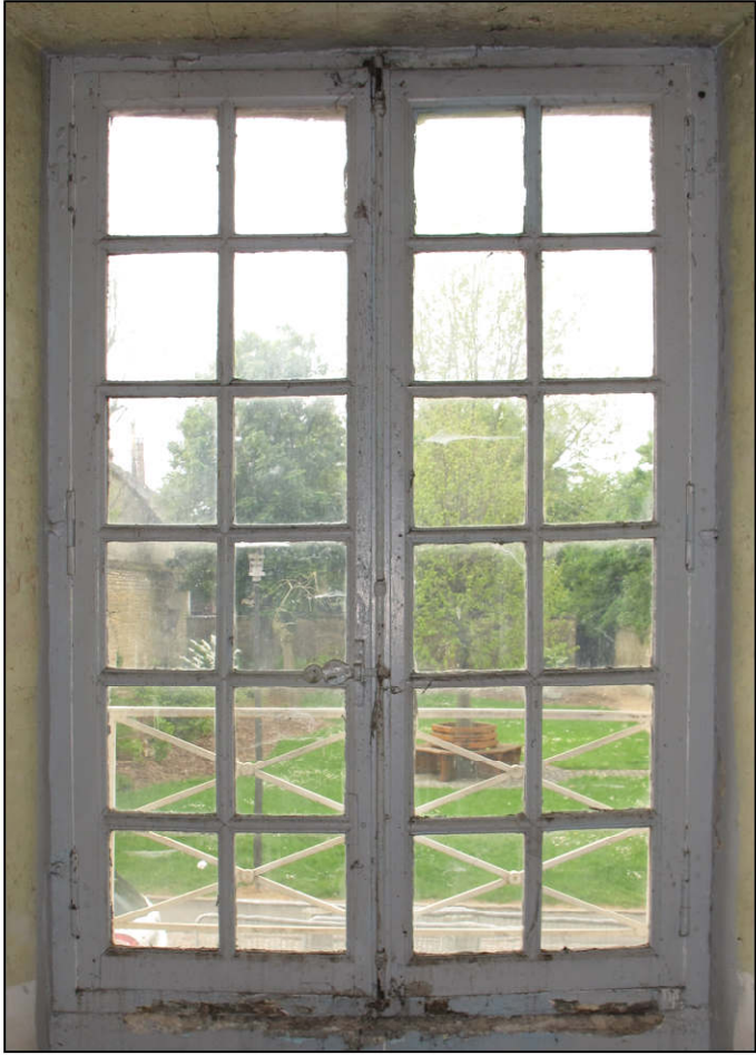
Fig. 4.1. Elévation intérieure (E)