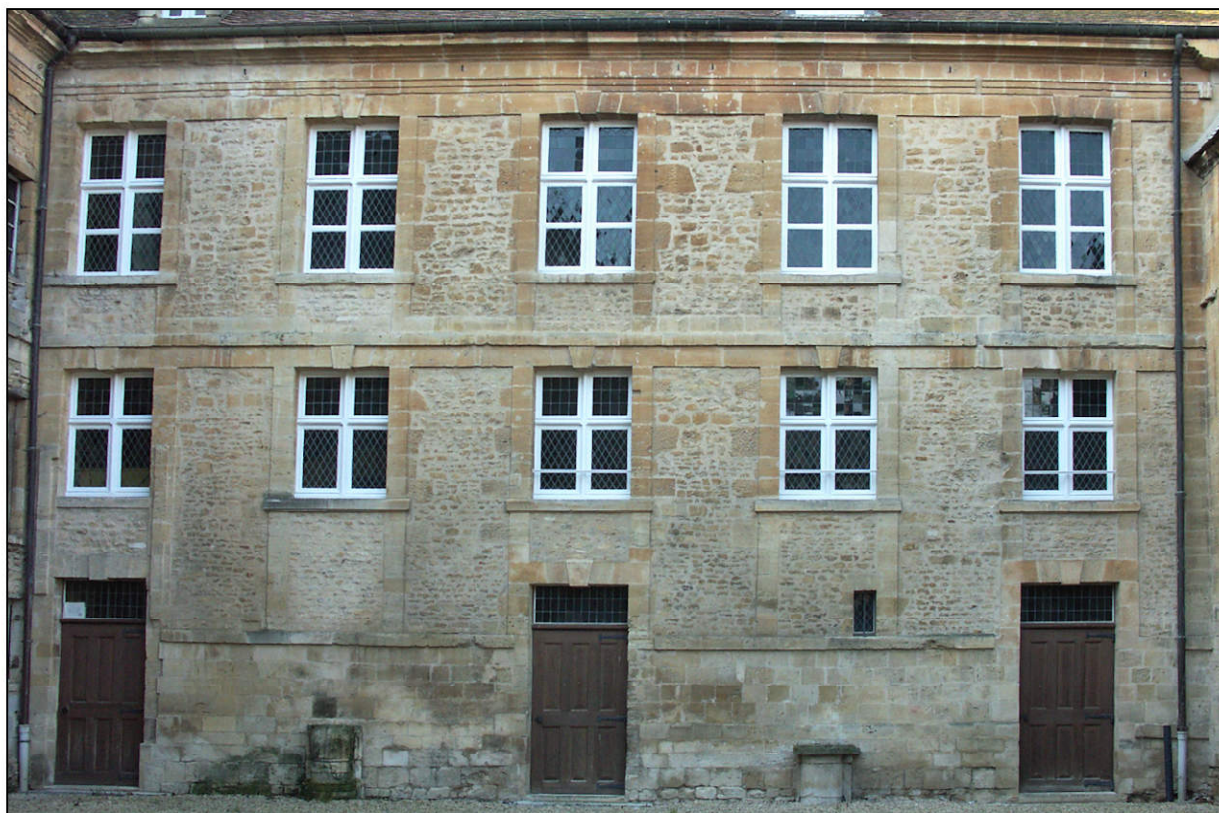
Fig. 5.3. Aile est / façade est (2013)