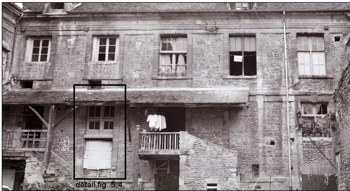
Fig. 5.2. Aile est / façade est (entre 1970 et 1980)