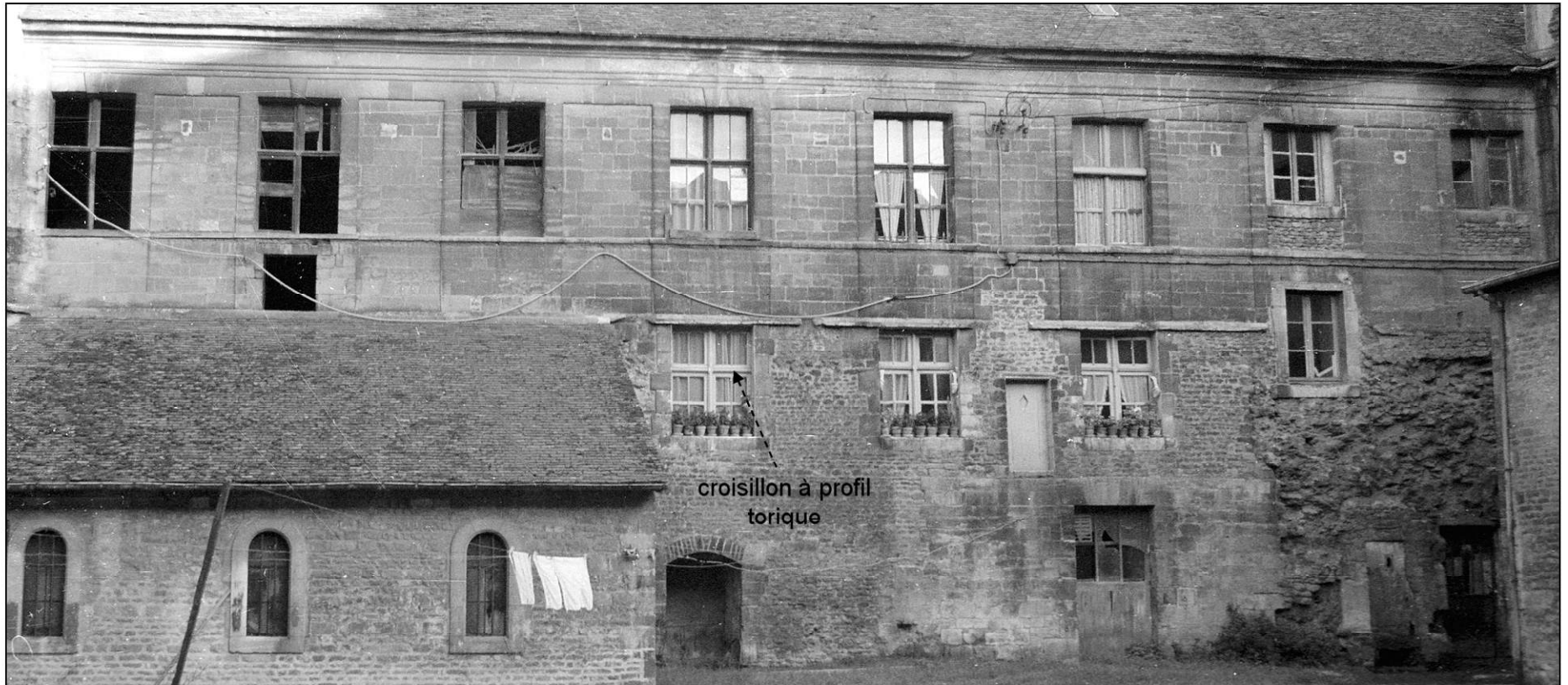
Fig. 5.1. Aile est / façade ouest (entre 1970 et 1980)