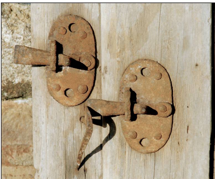
Fig. 1.7. Loquets (vantail vitré et volet sup.)