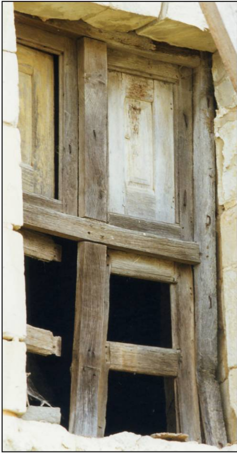
Fig. 1.1. Croisée (élévation extérieure)