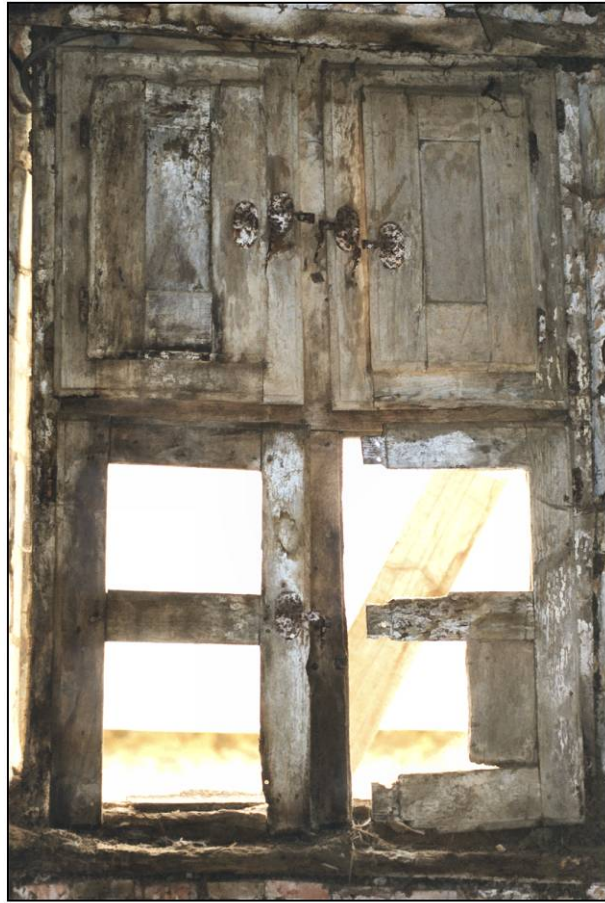
Fig. 1.2. Croisée (élévation intérieure)