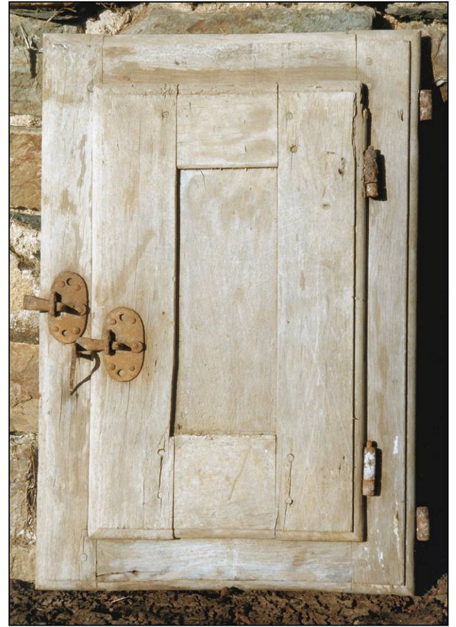
Fig. 1.3. Vantail et volet sup. (élévation int.)