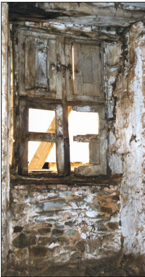
Fig. 1.4. Fenêtre (élévation int.)