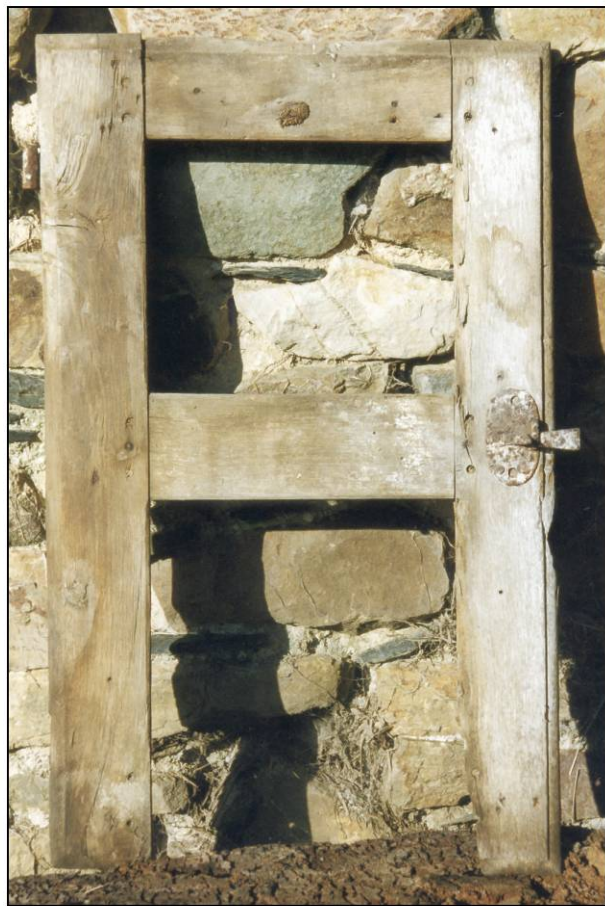
Fig. 1.5. Volet inf. (élévation int.)