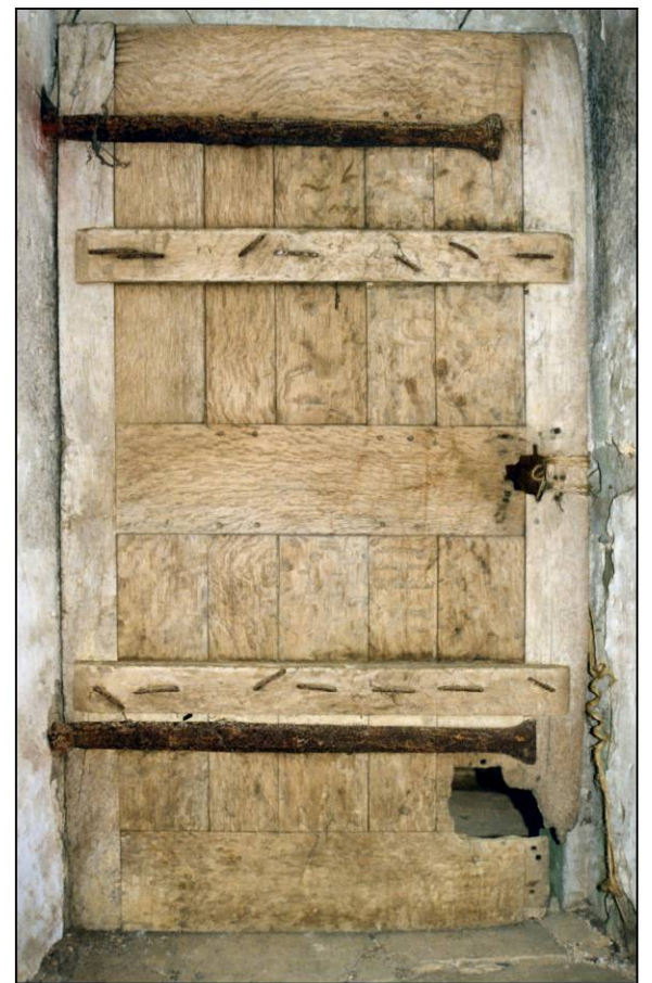
Fig. 4.6. Vant. C (élévation / côté ferrage)