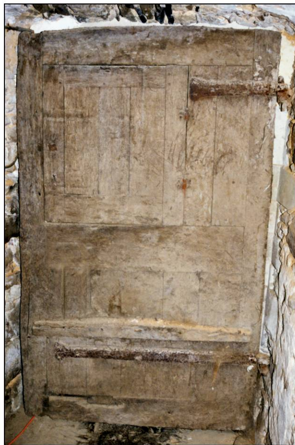
Fig. 4.5. Vant. B (élévation / côté ferrage)