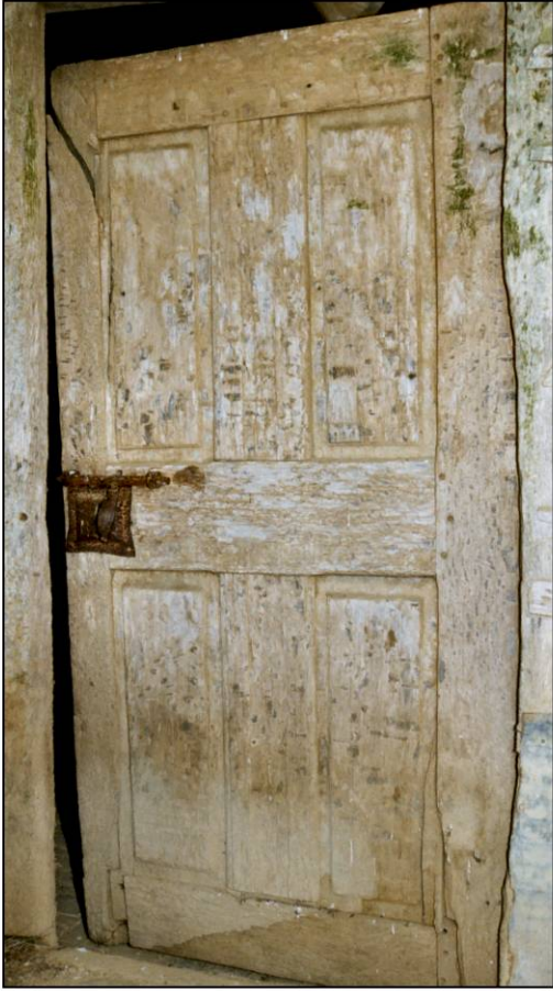
Fig. 4.1. Vantail A (élévation)