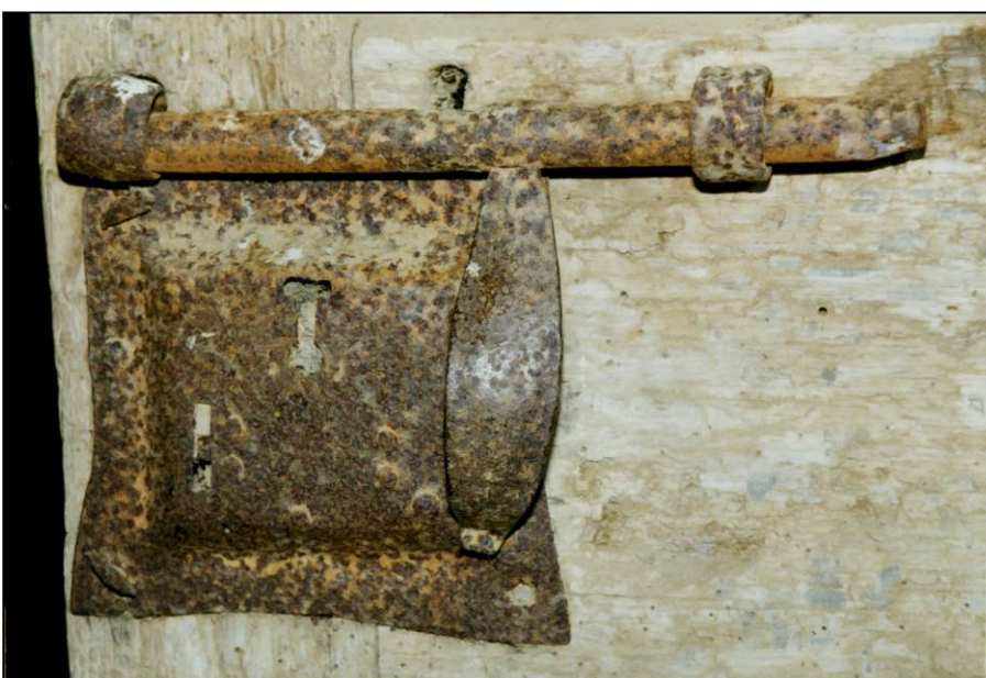
Fig. 4.7. Vantail A / Verrou