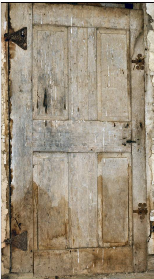
Fig. 4.4. Vant. A (élévation / côté ferrage)