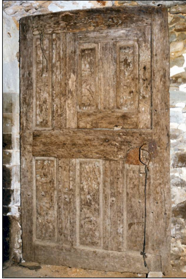
Fig. 4.2. Vantail B (élévation)