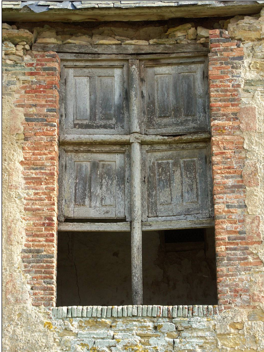
Fig. 2.2. Fenêtre et croisée