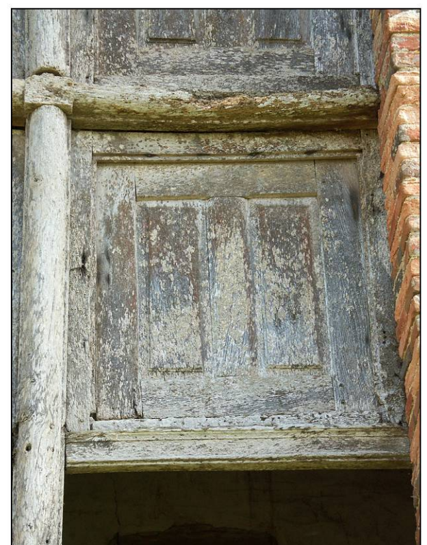
Fig. 2.6. Compartiment intermédiaire gauche