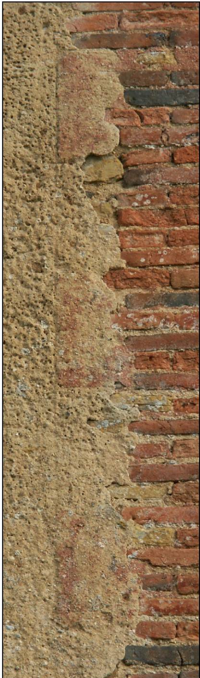
Fig. 2.1. Jambage