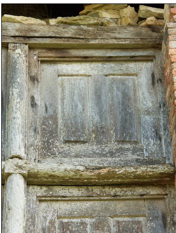
Fig. 2.4. Compartiment supérieur gauche