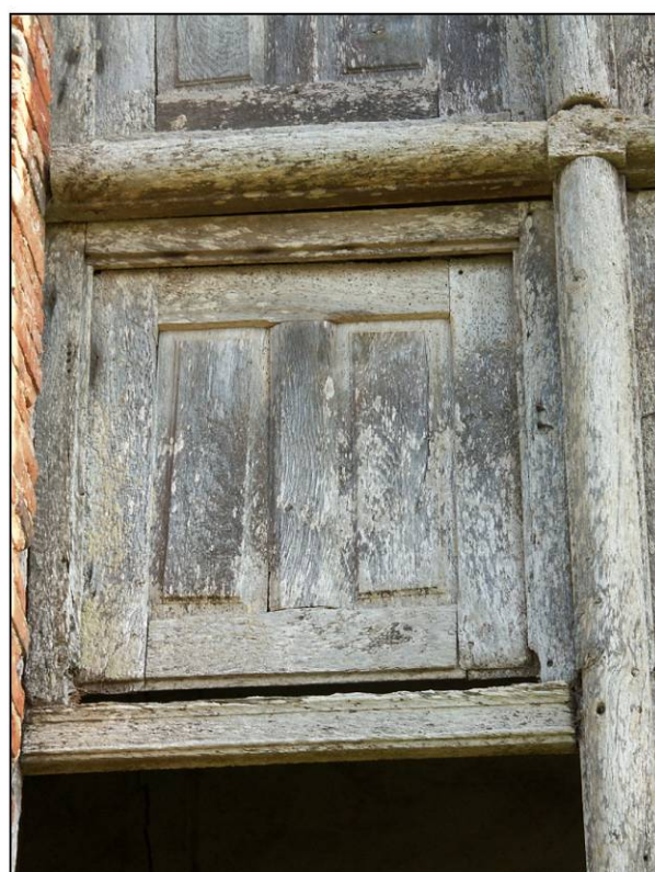
Fig. 2.5. Compartiment intermédiaire droit