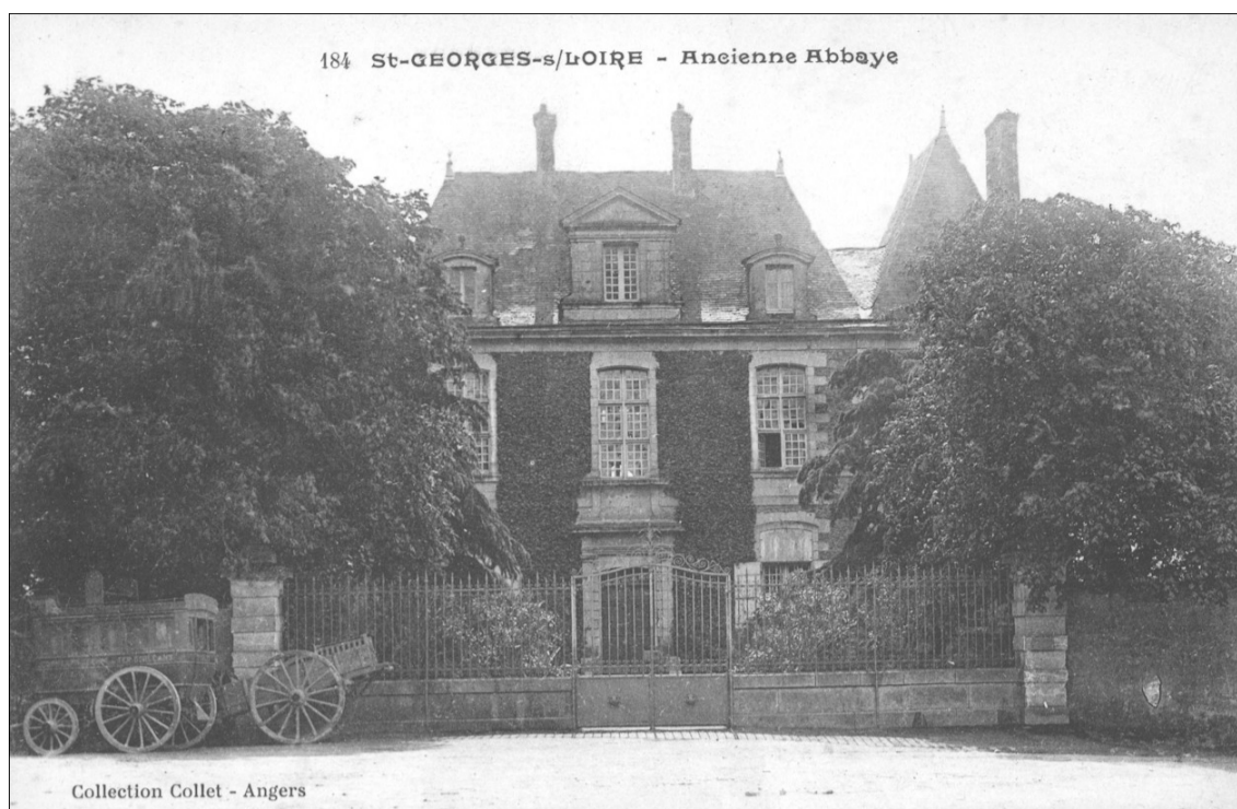
Fig. E.3. Le logis abbatial au début du XXe siècle Carte postale Collet, Angers (collection de l'auteur)

Pour l'essentiel, ces croisées perpétuent les procédés utilisés tout au long du XVIIe siècle et offrent une étanchéité pour le moins réduite. L'adoption simultanée de petits carreaux, de jets d'eau en talon et d'une traverse haute en arc surbaissé permet toutefois de les dater de la fin du siècle. La date de 1699 inscrite sur le linteau de la porte sud confirme cette analyse (fig. 2.3, voir date de part et d'autre du blason dans les métopes de la frise dorique).