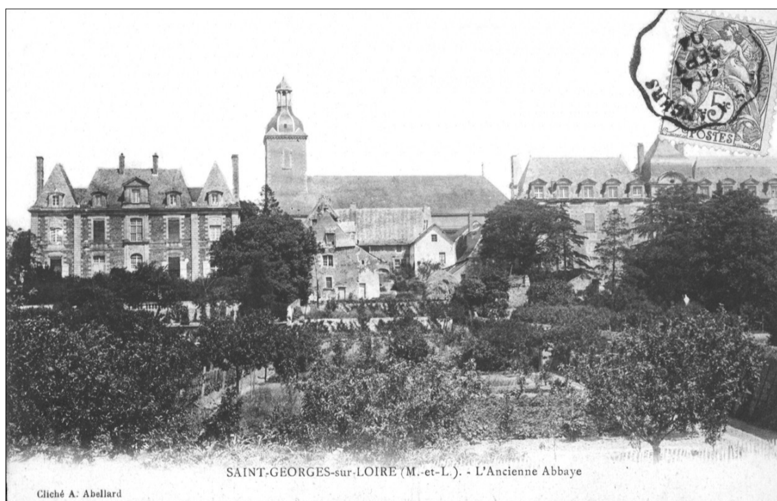
Fig. E.1. L'abbaye au début du XXe siècle (à gauche, le logis abbatial) Carte postale.

En façade sud, les croisées ont été refaites ou fortement remaniées. En façade nord, il reste plusieurs croisées d'origine. Selon une numérotation indiquant en premier l'orientation de la façade (nord), en deuxième le niveau (1 ou 2) et en troisième le numéro d'ordre des fenêtres (selon fig. 2.2), il reste les croisées N1-3, N1-4, N2-2 et N2-3. Leur serrurerie a été remaniée, certains vantaux n'ouvrent plus, leurs éléments sont parfois renforcés par des mastics et elles ont été repeintes. Nous avons donc été contraint d'établir notre relevé à l'aide de plusieurs éléments. La menuiserie a été relevée sur la croisée N1-3, mais sa serrurerie ayant été entièrement changée, sa disposition a été copiée sur la croisée suivante N1-4. Les jets d'eau protégés par des pièces de zinc ont été relevés sur des vantaux déposés et conservés par le propriétaire, ainsi que le profil des petits-bois. Nous avons procédé de la même façon pour le modèle de targette.