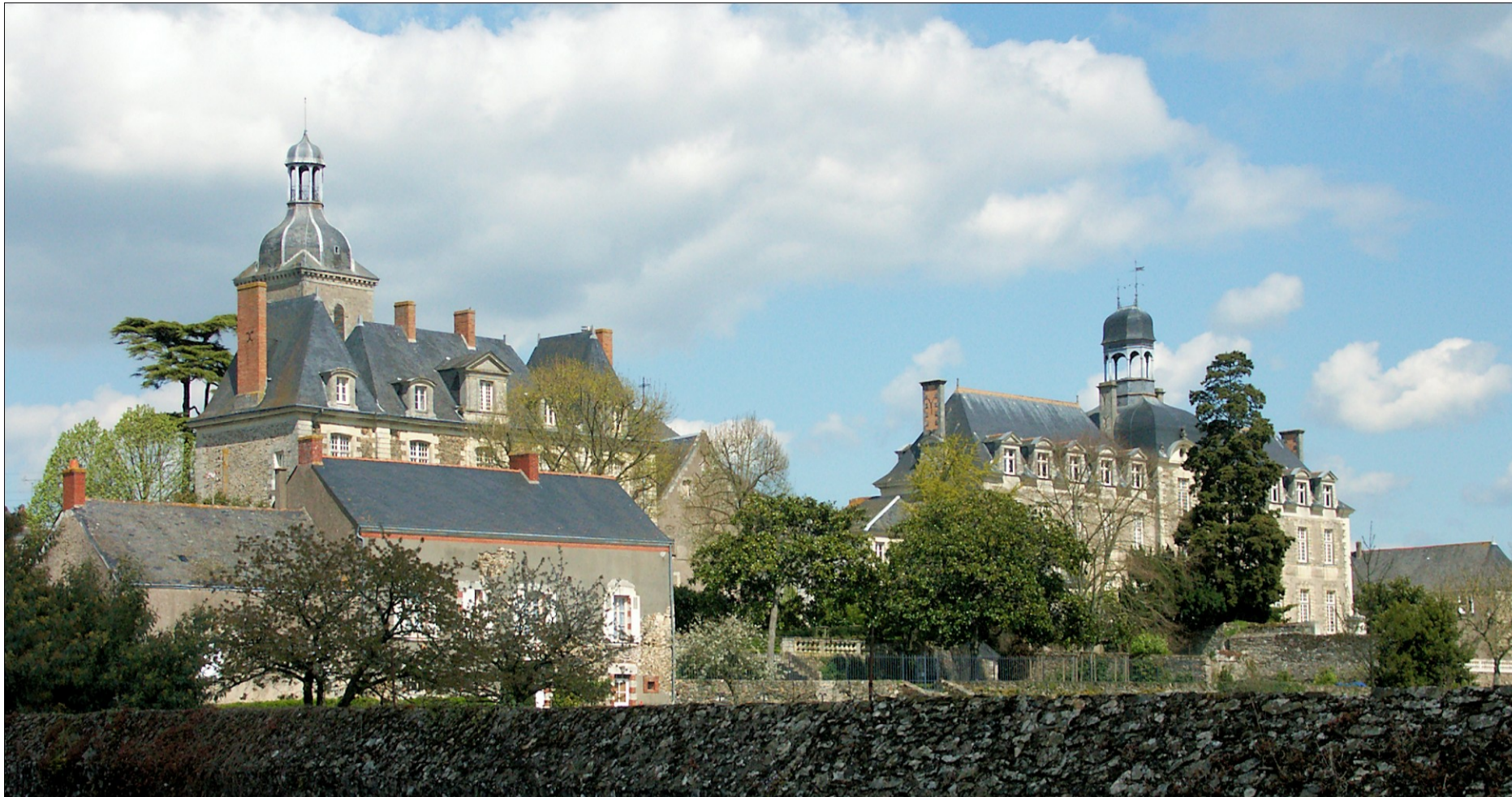
Fig. E.2. L'abbaye (à gauche, le logis abbatial)