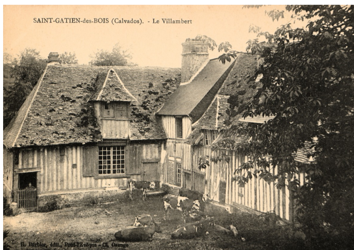
Fig. E.3. Le manoir du Villambert au début du XX e siècle Carte postale Barbier à Pont-l'Évêque (collection de l'auteur)

Le manoir du Villambert était la demeure d'un verdier de la forêt ducal qui assurait la gestion et la garde du domaine. Selon Yves Lescroart, son aile la plus ancienne aurait été construite au milieu du XVIe siècle (à droite, sur la fig. E.3), et celle en retour d'équerre, dans le dernier quart du même siècle 6 . Les caractéristiques des châssis étudiés ne permettent pas d'établir une datation précise, mais l'absence probable de remplage dans la grande fenêtre du rez-de-chaussée, le décor de godrons et l'utilisation de paumelles à moustaches tendent à confirmer cette datation du dernier quart du XVIe siècle.