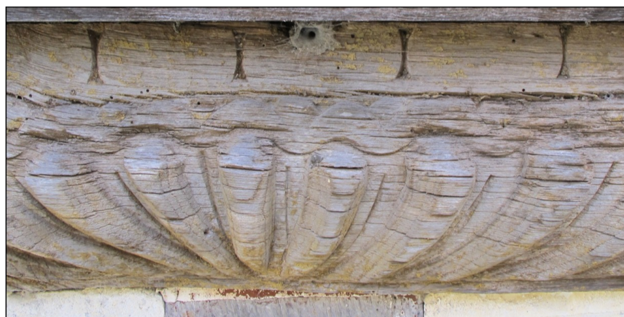
Fig. E.1. Détail des godrons de l'appui de fenêtre de la lucarne.

La lucarne surmonte une fenêtre qui éclaire la grande salle du rez-de-chaussée depuis la cour et qui ne semble pas avoir été compartimentée par un meneau et un croisillon (fig. 1.2). Cette lucarne reprend le registre ornemental du pan de bois. Ainsi, sur son appui s'épanouissent les larges godrons utilisés sur les sablières (fig. E.1 et 1.2). Cet appui a été repris en partie pour compenser l'affaissement de la lucarne et plusieurs éléments lui ont été ajoutés (fig. 2.5), dont une tablette à l'extérieur qui a éliminé des bases moulurées au pied des deux poteaux latéraux (fig. 1.1). Les moulures du poteau central qui descendent à quelques millimètres au-dessous du niveau des vantaux, ainsi que les deux arasements de son tenon qui sont au même niveau, permettent de montrer que l'appui initial n'avait pas de feuillure.