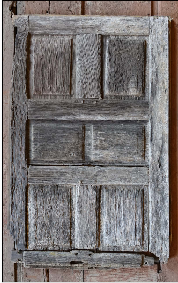
Fig. 4.2. Autre modèle de volet (1)