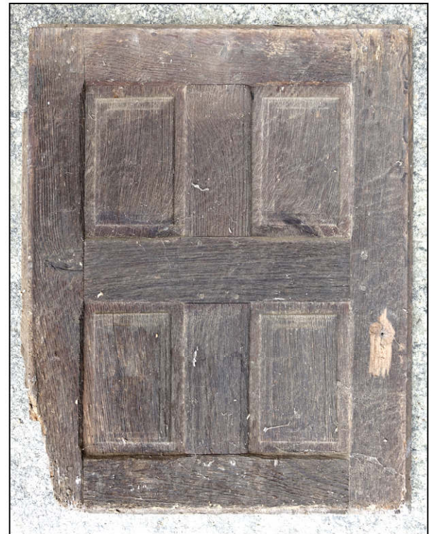
Fig. 4.6. Autre modèle de volet (3)