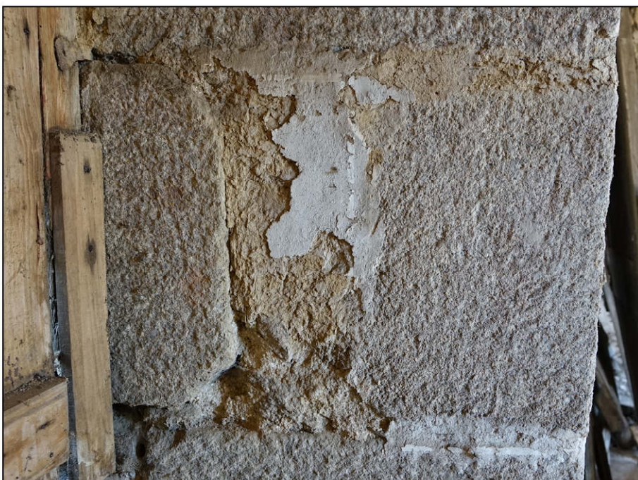
Fig. 4.8. Décor de fausses pierres