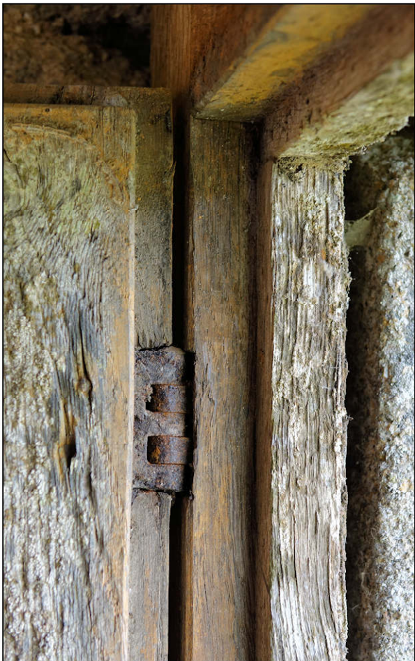
Fig. 4.4. Fiche et traces de peinture extérieure