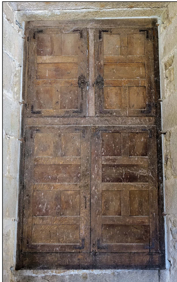
Fig. 4.5. Croisée restituée