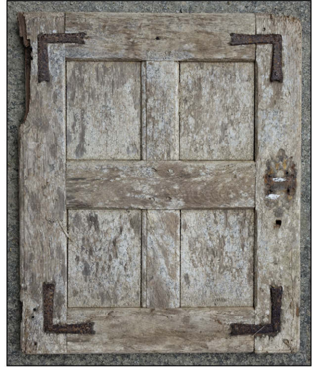
Fig. 4.3. Autre modèle de volet (2)