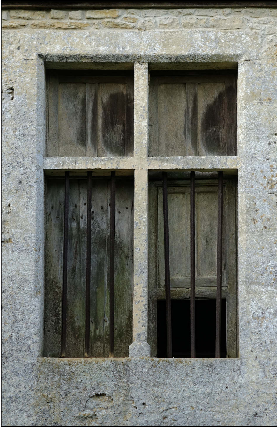
Fig. 2.1. Élévation extérieure