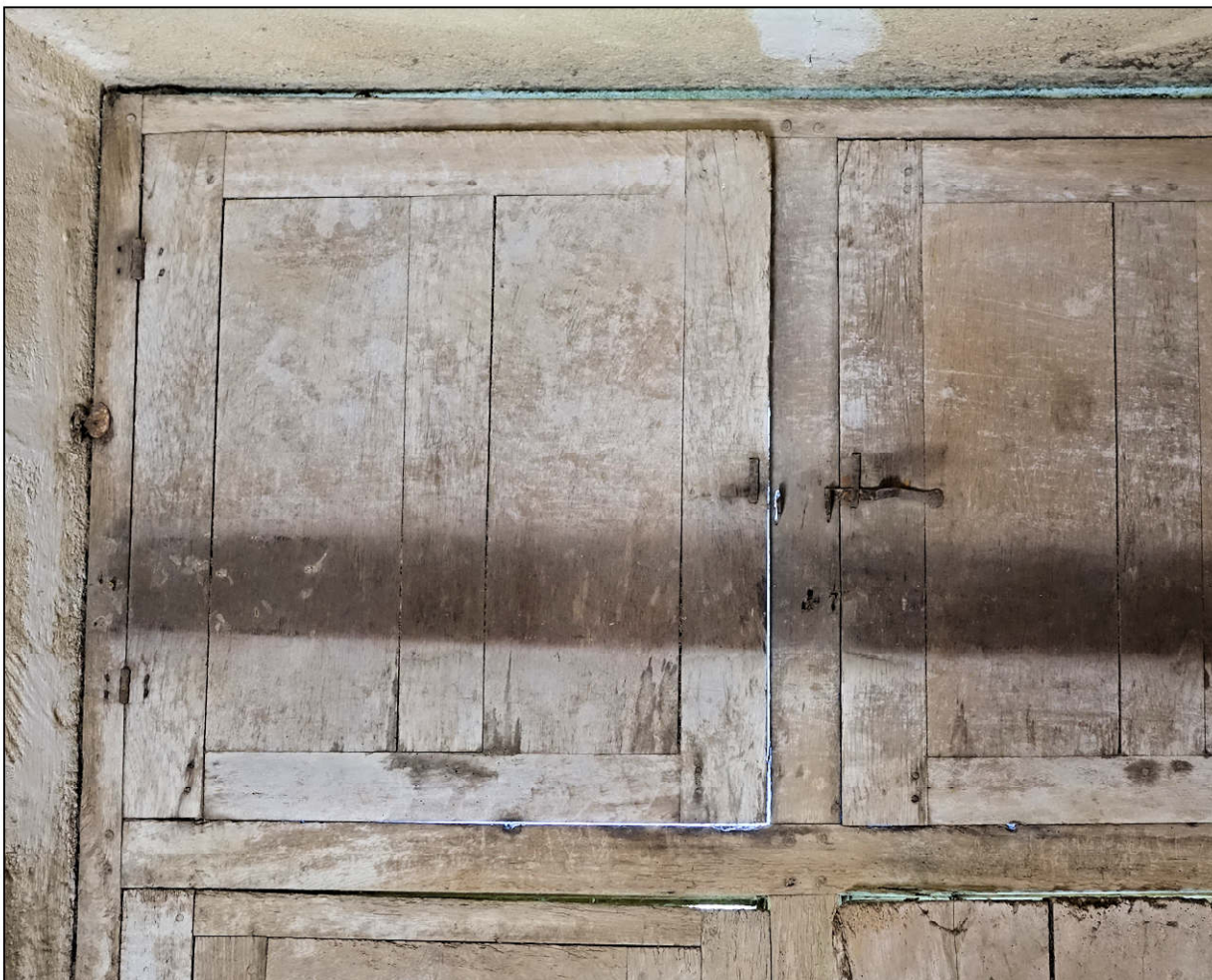
Fig. 2.3. Compartiments supérieurs