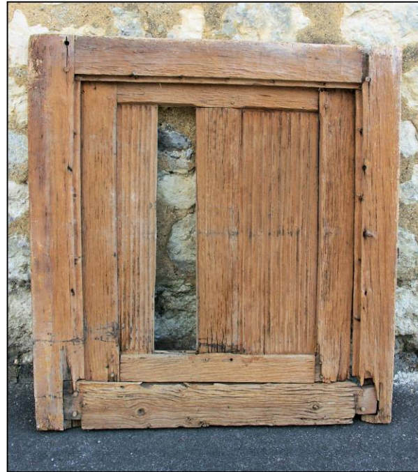
Fig. 2.2. Elévation extérieure