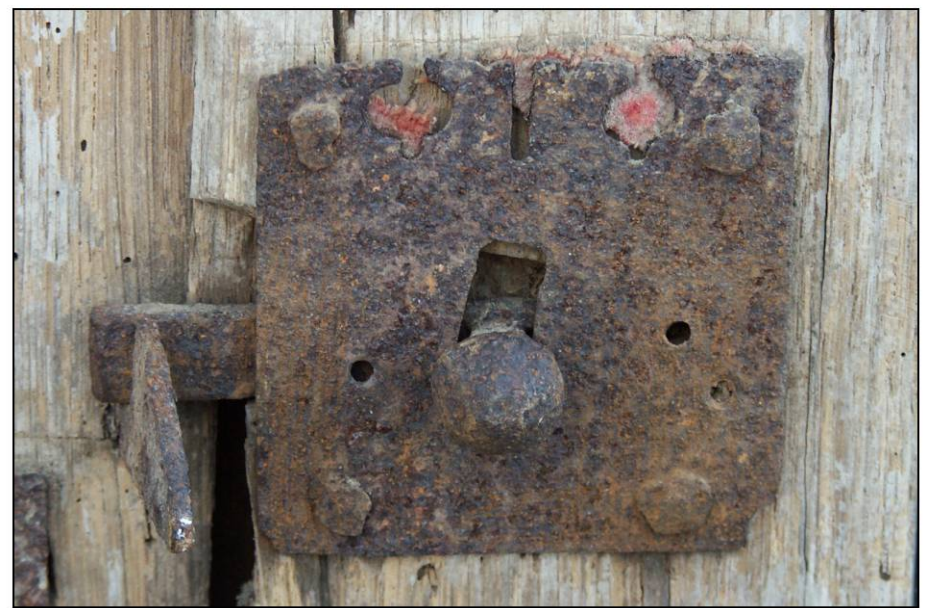
Fig. 2.5. Loquet