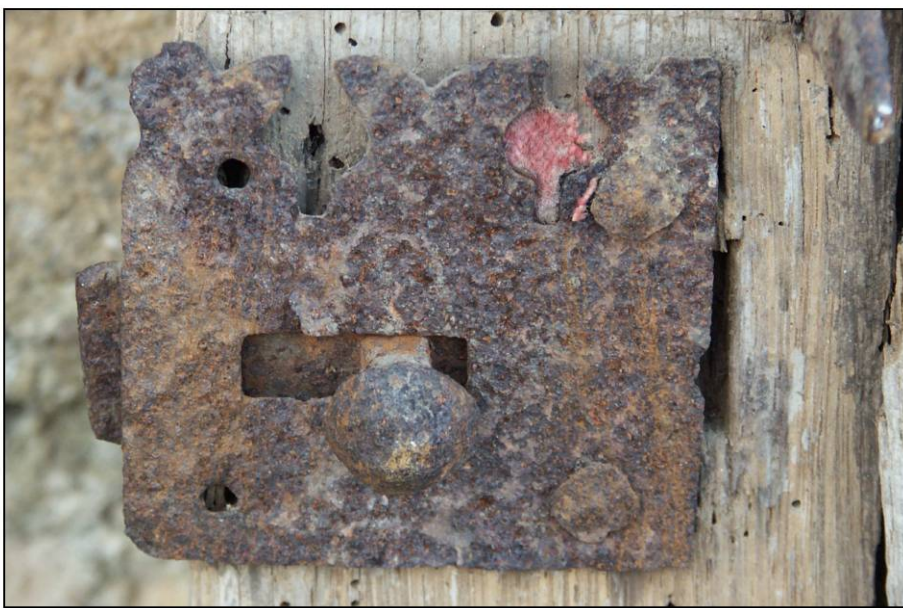
Fig. 2.4. Targette