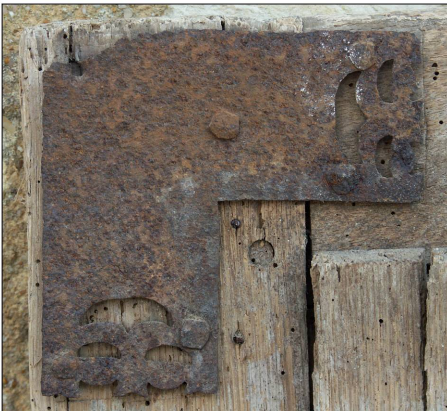
Fig. 2.6. Equerre