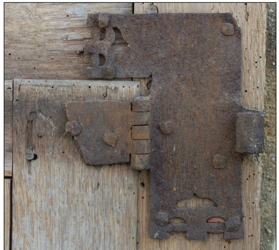
Fig. 2.7. Penture à charnière