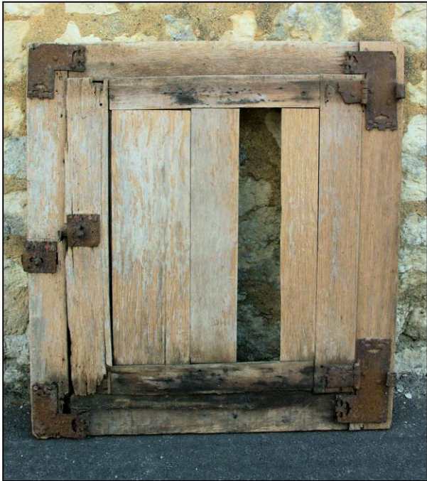
Fig. 2.1. Elévation intérieure