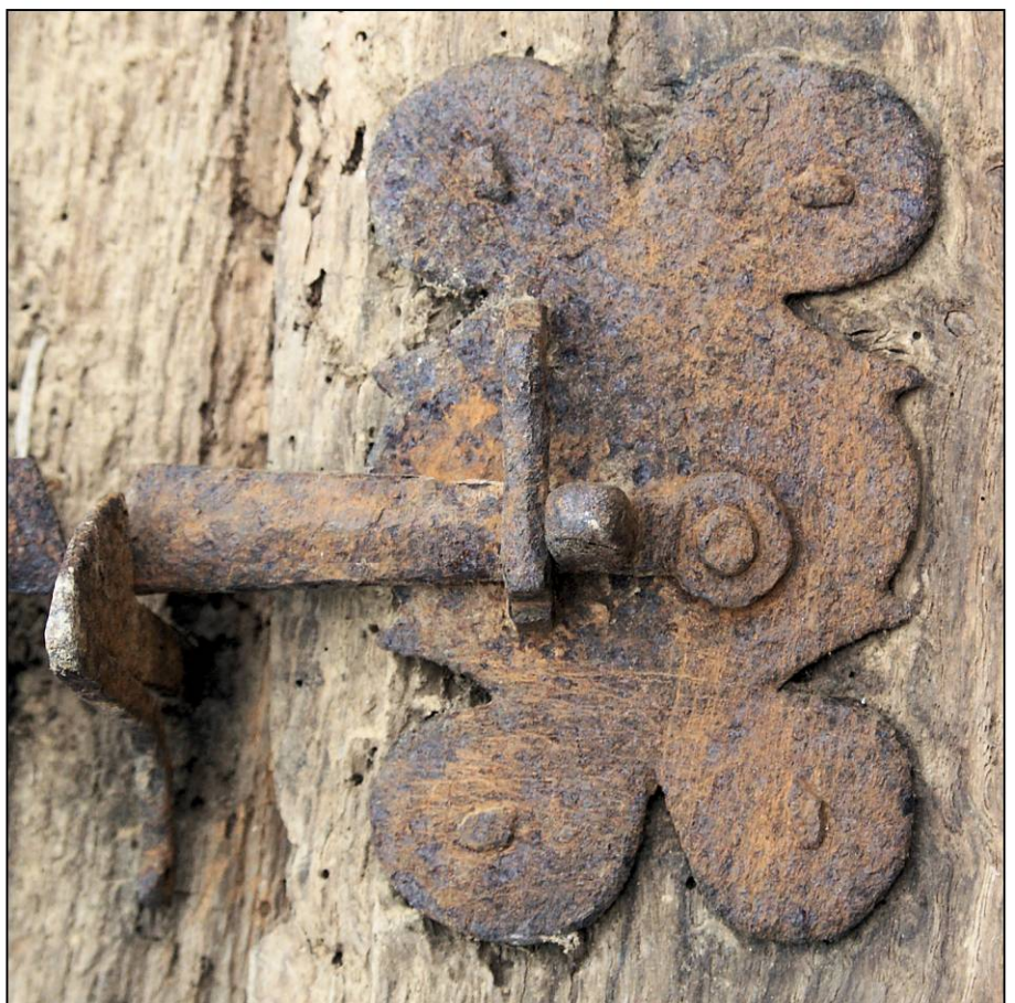
Fig. 1.4. Loquet