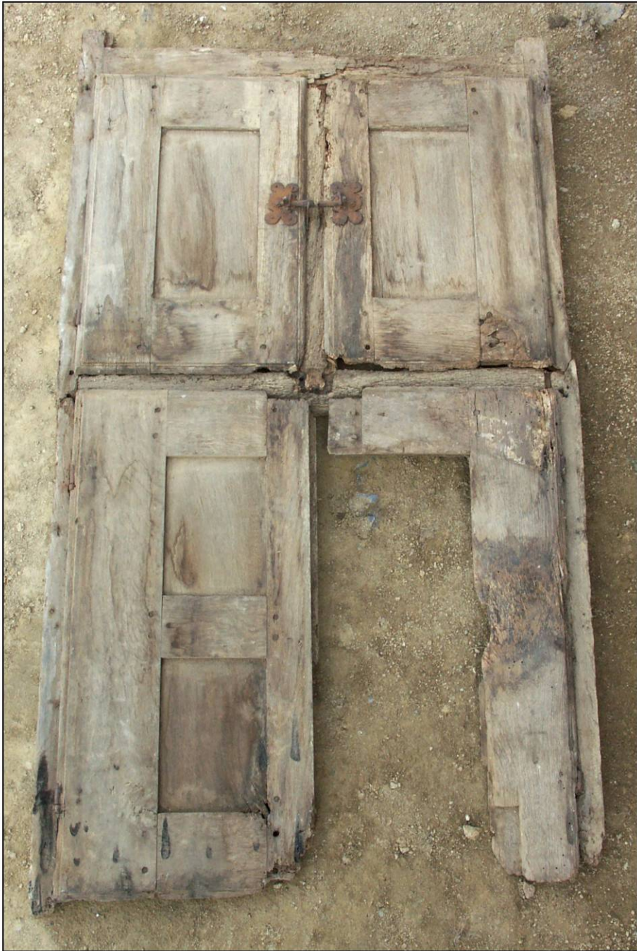
Fig. 1.1. Elévation intérieure