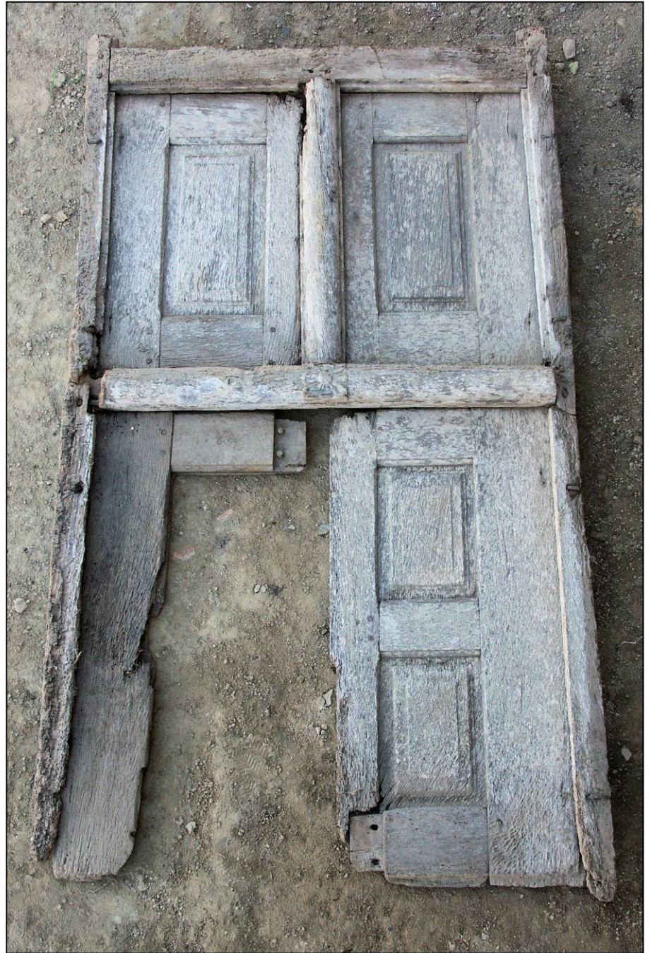
Fig. 1.2. Elévation extérieure