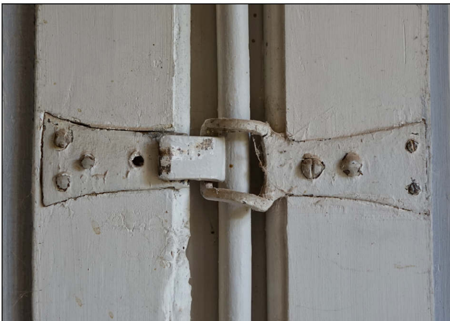
Fig. 4.4. Contre-panneton / panneton / agrafe