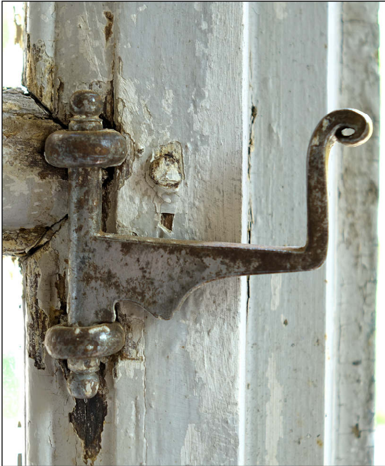
Fig. 4.2. Arrêt à charnière