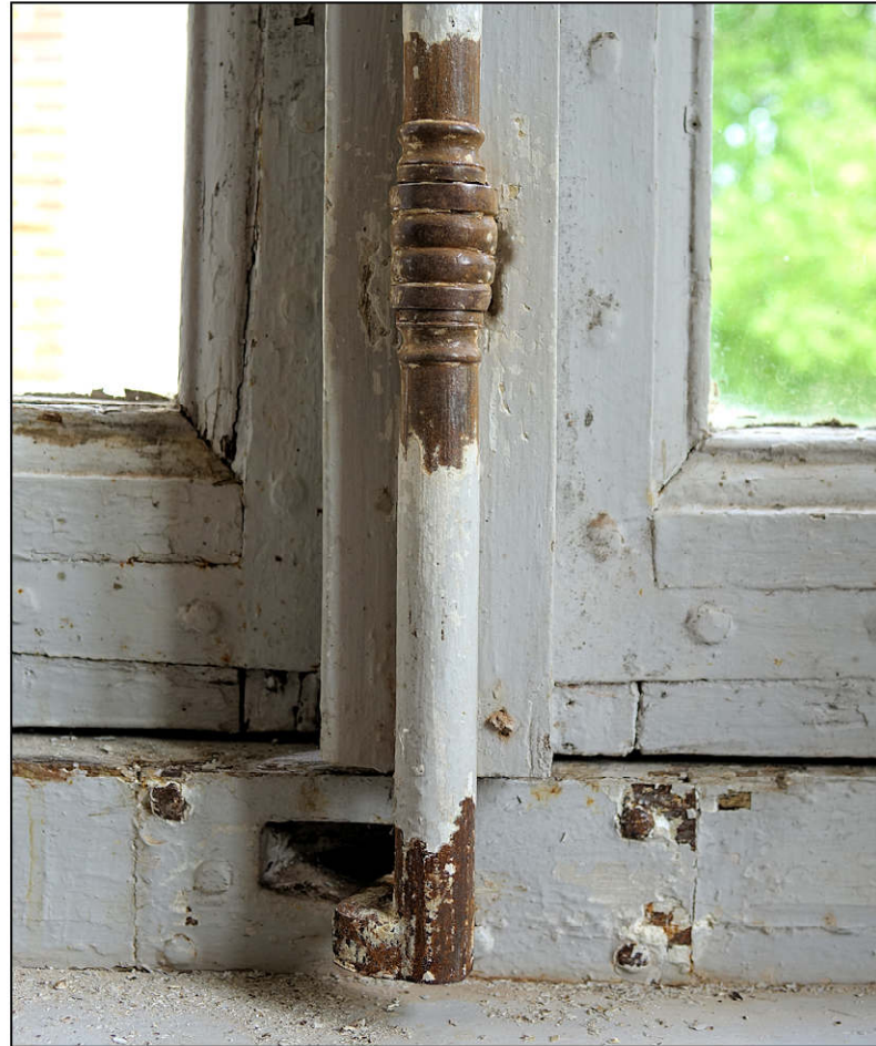
Fig. 4.3. Embase / crochet et gâche