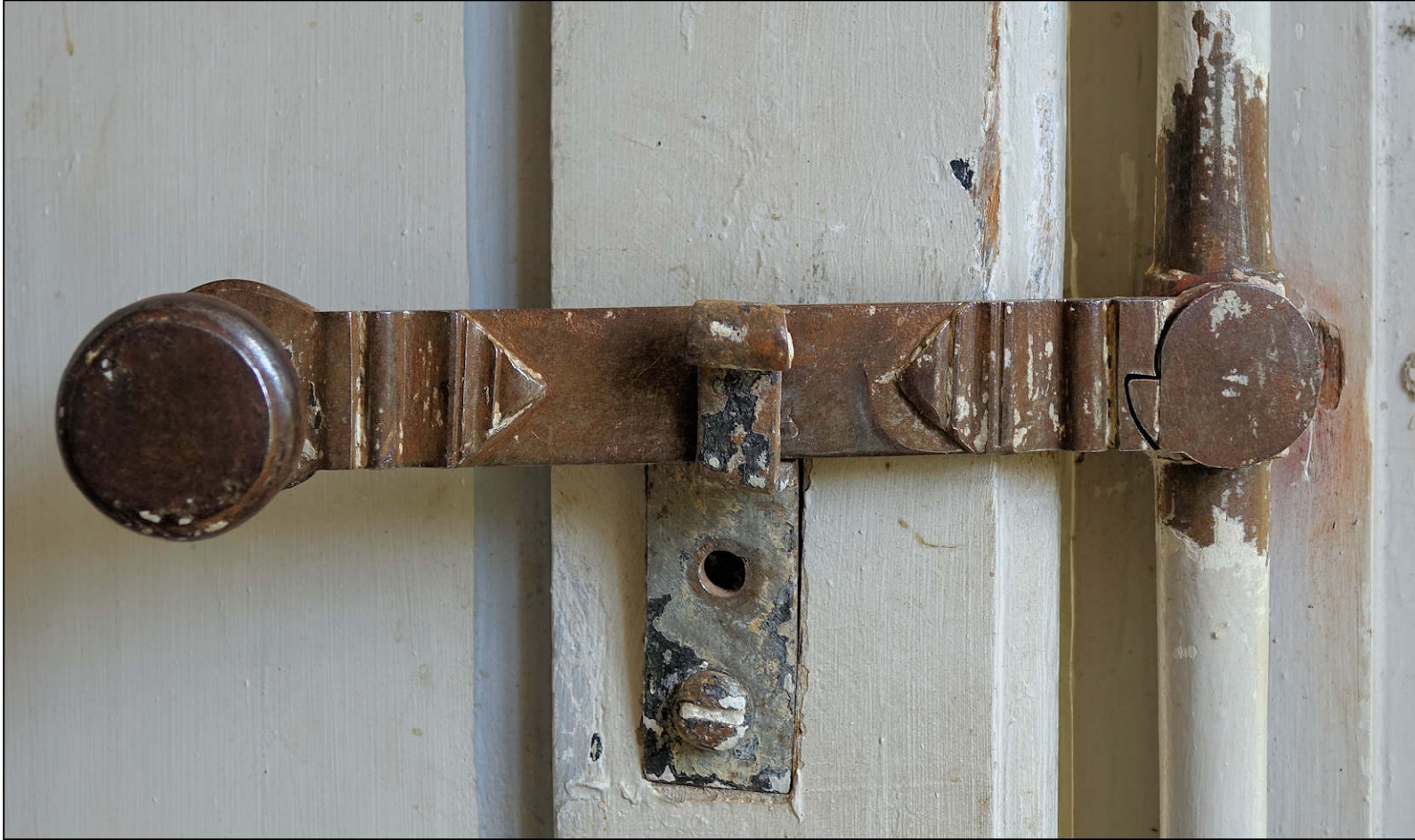
Fig. 4.1. Poignée d'espagnolette sur un arrêt fixe