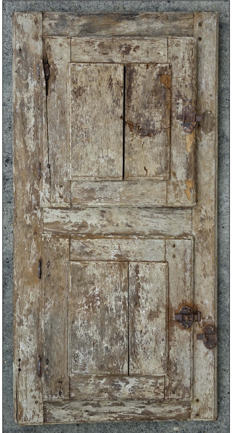
Fig. 2.2. Elévation intérieure