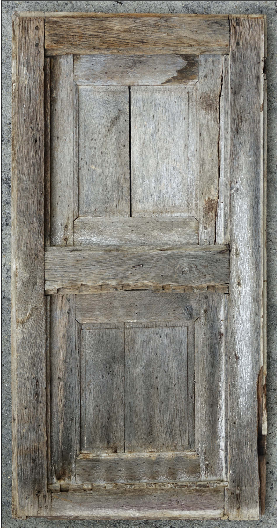
Fig. 2.1. Elévation extérieure