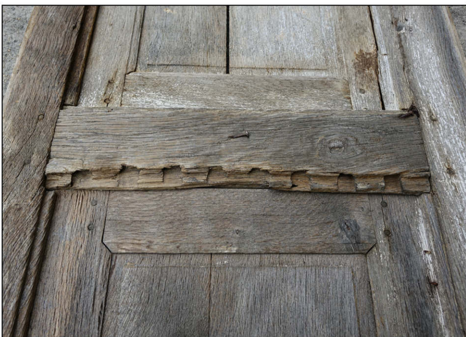
Fig. 2.3. Traverse intermédiaire