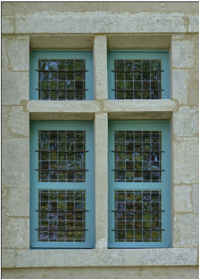
Fig. 1.3. Croisée (niveau 3)