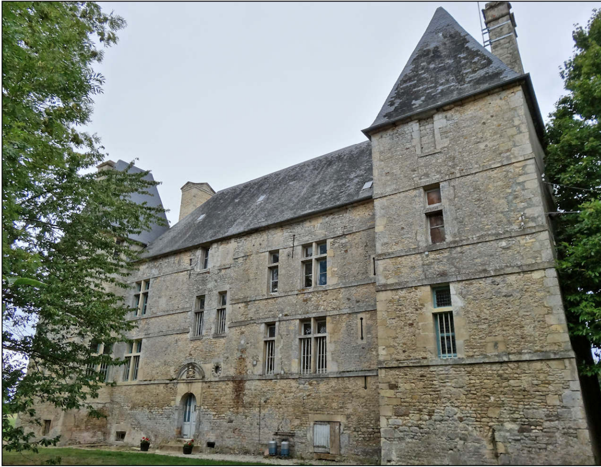
Fig. 1.1. Façade nord-ouest (2013 / avant restauration)*