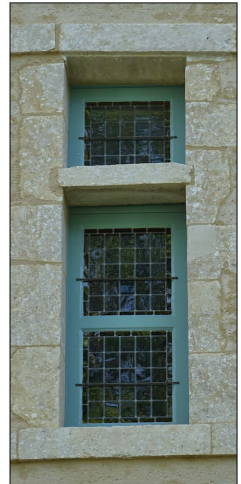
Fig. 1.5. Demi-croisée (niveau 3)