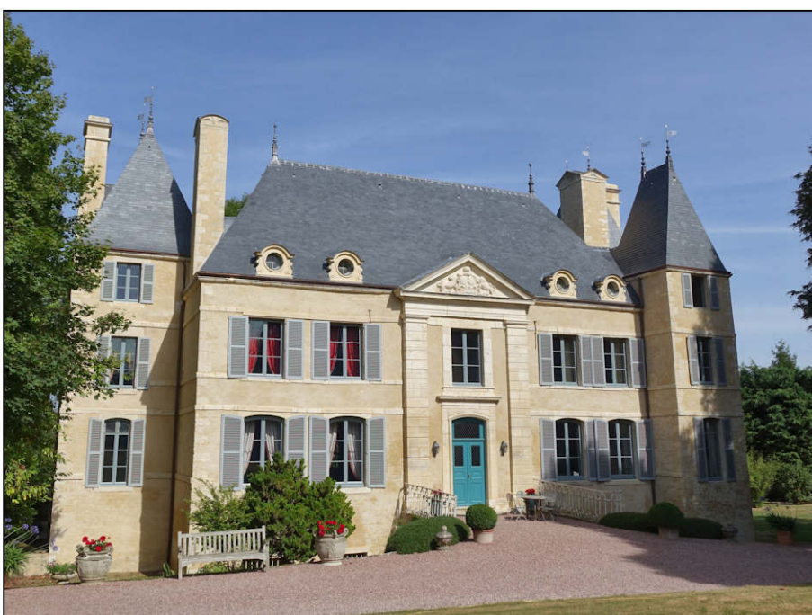
Fig. 1.6. Façade sud-est