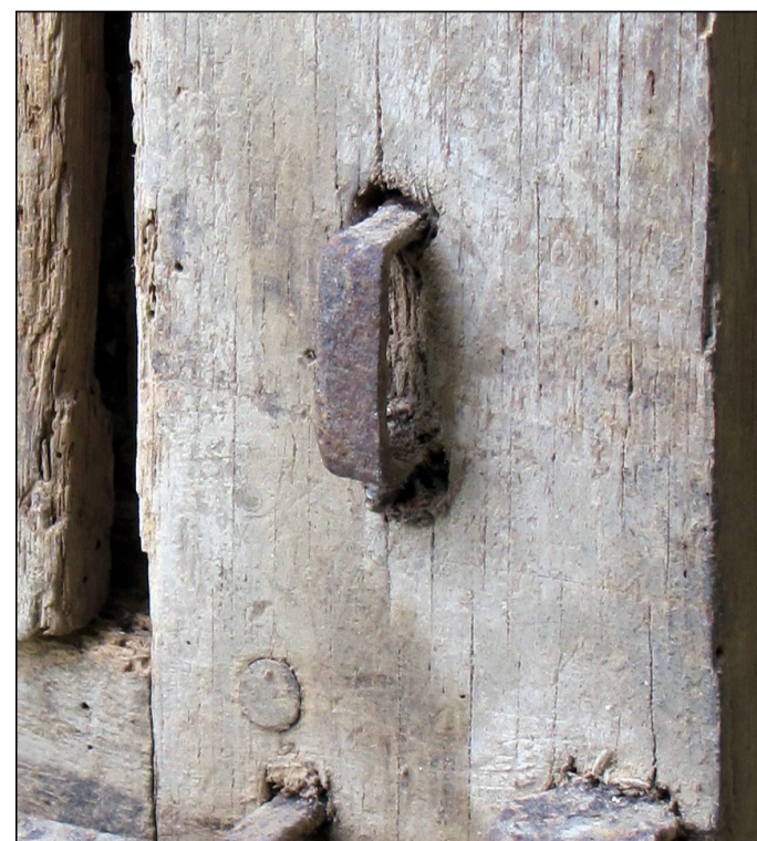
Fig. E.1 – Bride ou conduit fiché dans le montant droit du vantail vitré.

La fermeture du volet est assurée par un loquet sans platine (fig. 1.5) et celle du vantail par une targette du même type avec un pêne à bouton plat (fig. 1.6). On peut s'étonner de la largeur de ses conduits, trop lâches pour assurer un coulisage précis, mais il s'agit bien de la disposition d'origine. Au-dessus de cette targette, on peut observer une bride ou un conduit isolé dont la fixation semble indiquer son caractère d'origine, mais dont la fonction reste énigmatique (fig. 1.3 et E.1). Sous celui-ci, le bois est très usé et on devine une trace d'oxydation à sa gauche. Vu son emplacement, il pourrait être liée à un système de tirage, mais nous n'avons aucun exemple constitué d'une bride ou d'un conduit de ce type.