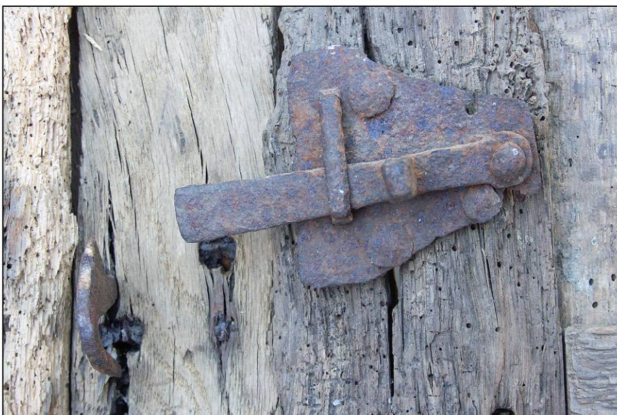
Fig. 2.5. Loquet (volet supérieur droit)