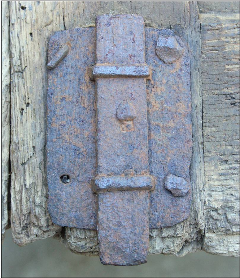
Fig. 2.1. Verrou inférieur (volet inférieur droit)