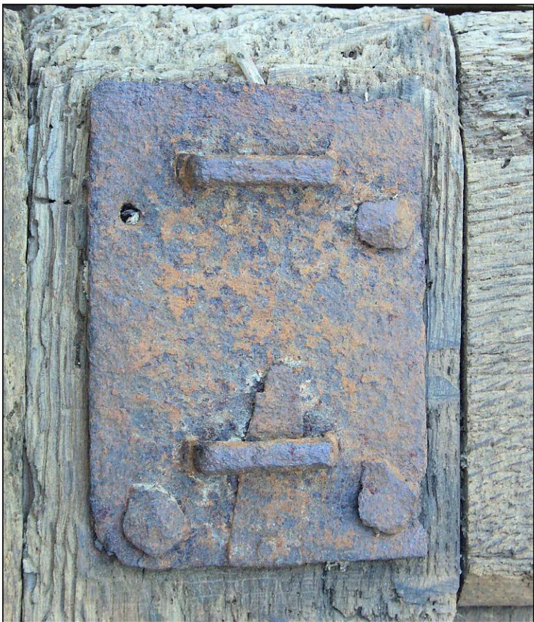
Fig. 2.3. Verrou supérieur (volet inférieur droit)