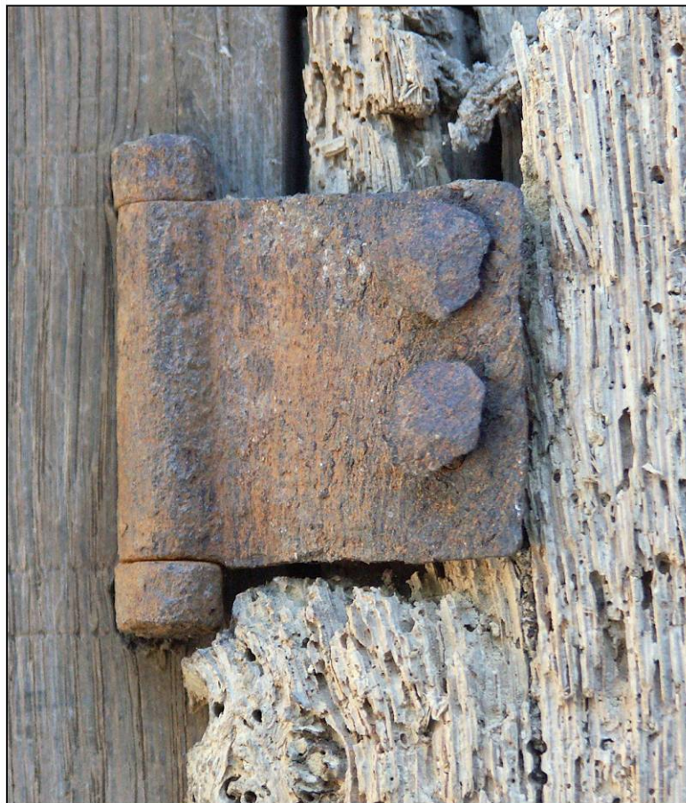
Fig. 2.4. Fiche à broche rivée