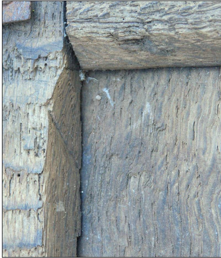
Fig. 2.2. assemblage carré (chanfrein arrêté)