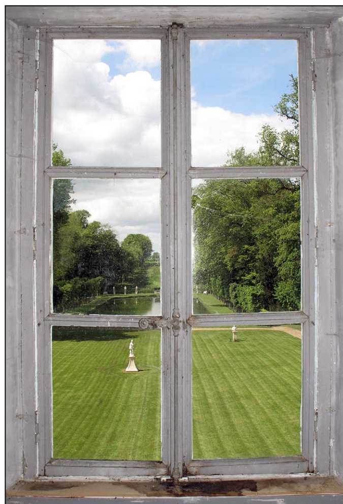
Fig. 6.5. Fenêtre de l'étage