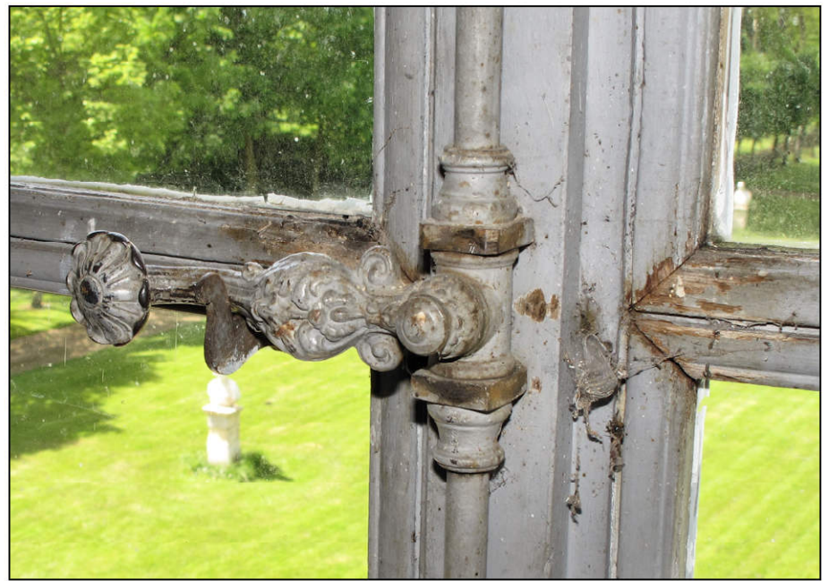
Fig. 6.3. Fenêtre de l'étage / espagnolette