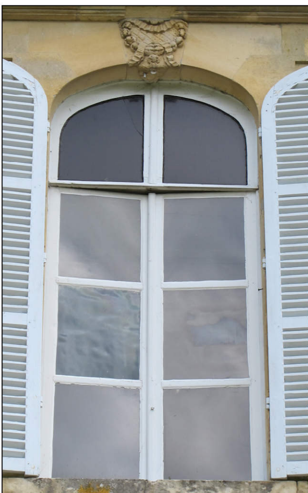
Fig. 6.4. Fenêtre de l'étage