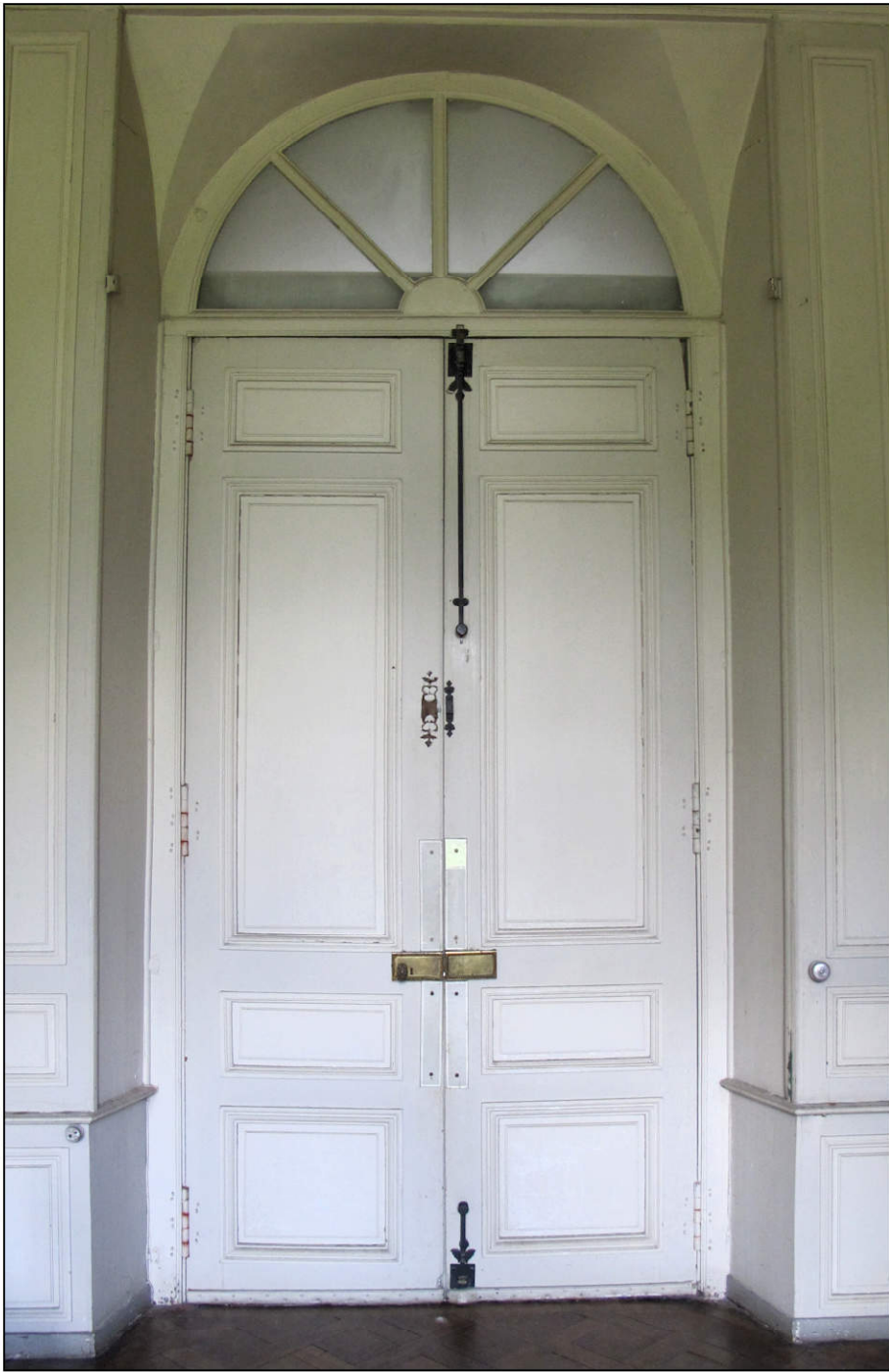
Fig. 6.1. Porte du vestibule