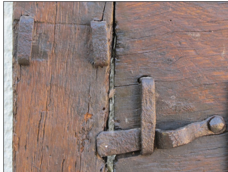
Fig. E.1 – Conduits de la targette disparue du vantail vitré et loquet du volet du haut.

Il s'agissait d'une vitrerie mise en plomb. Quelques traces de sa fixation demeurent dans la feuillure du haut. Par contre, les fixations de la ou des vergettes ne sont plus lisibles. Comme nous l'avons indiqué plus haut, la vitrerie était limitée au seul compartiment du haut.