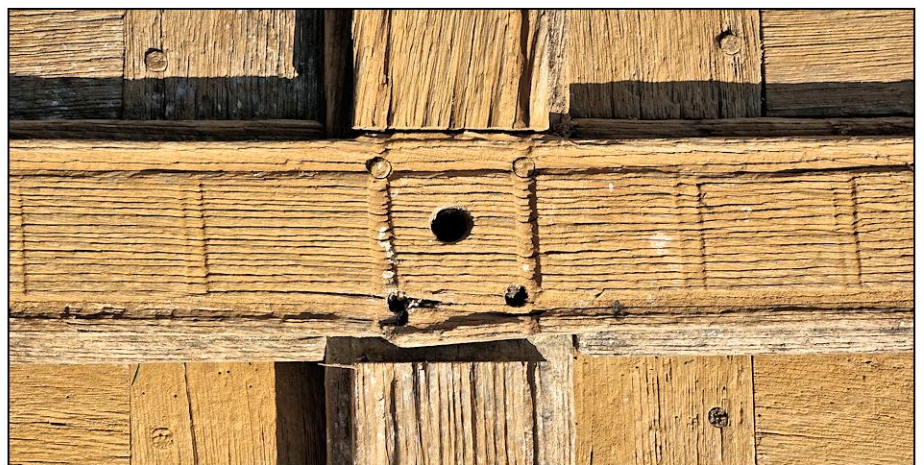
Fig. 3.4. Meneau et croisillon