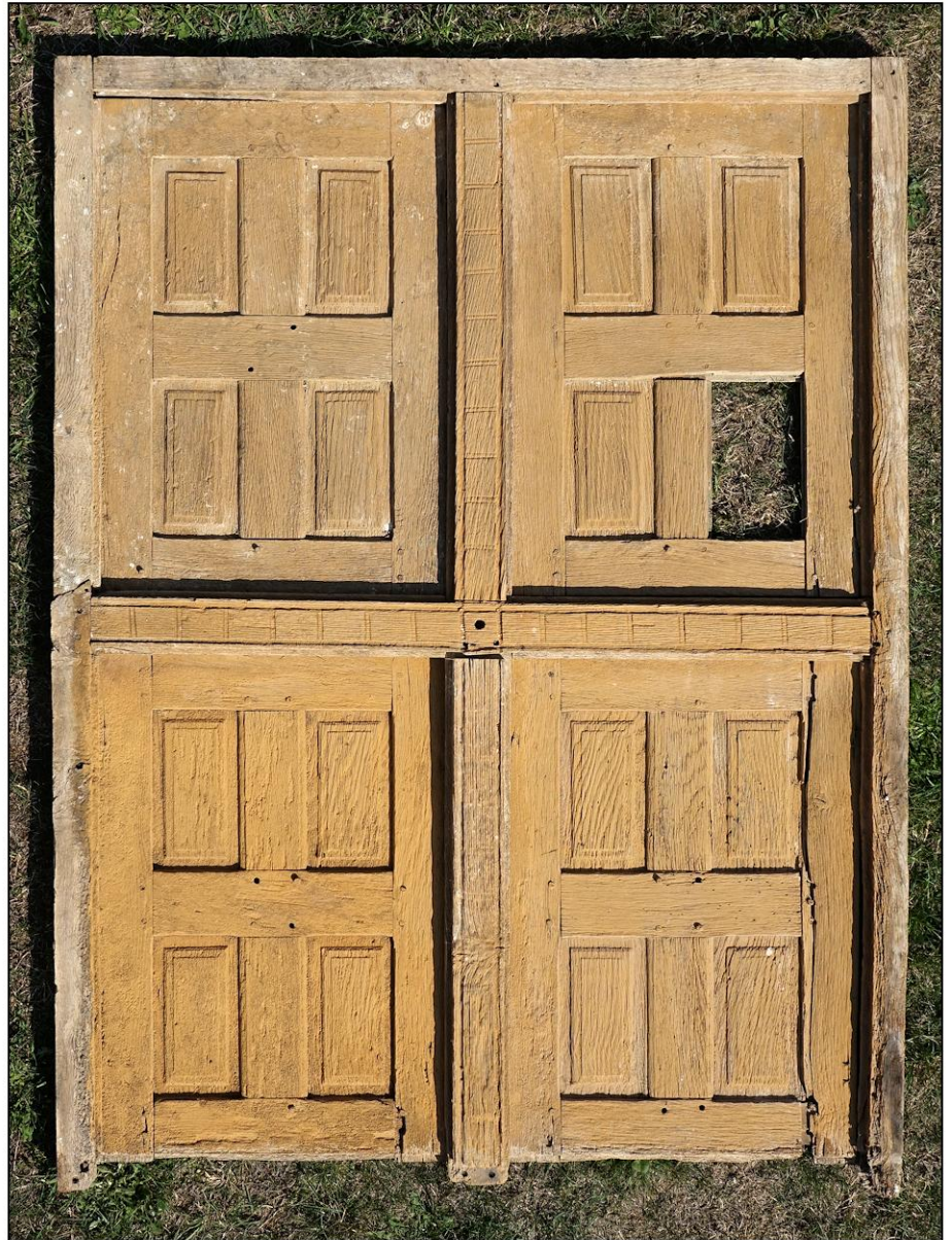
Fig. 3.2. Elévation extérieure