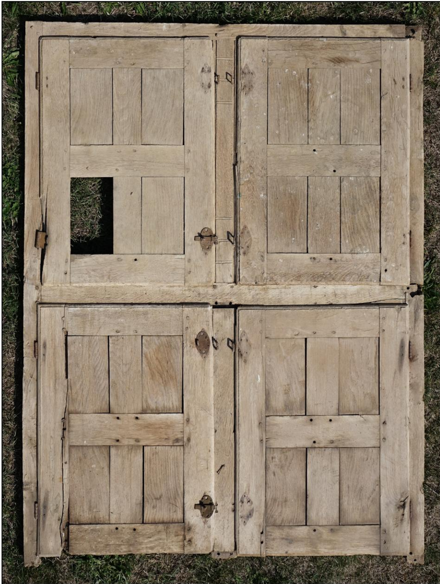
Fig. 3.1. Elévation intérieure