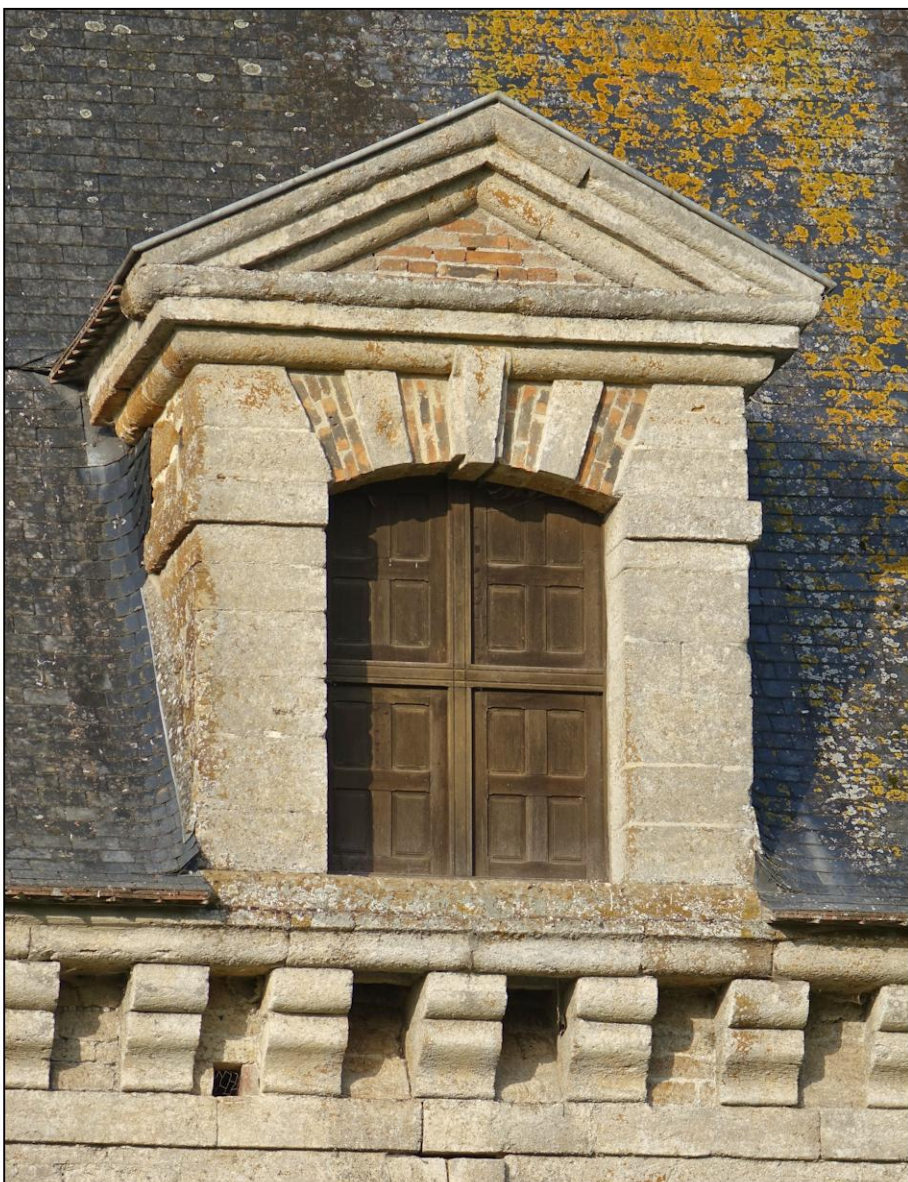
Fig. 3.3 Lucarne et croisée restituée