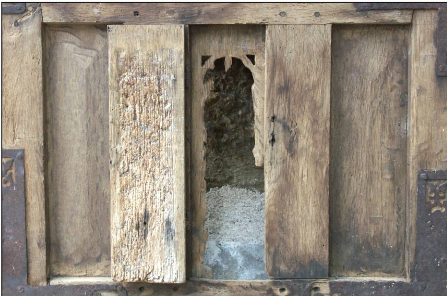
Fig. 2.3. Claire-voie et guichet