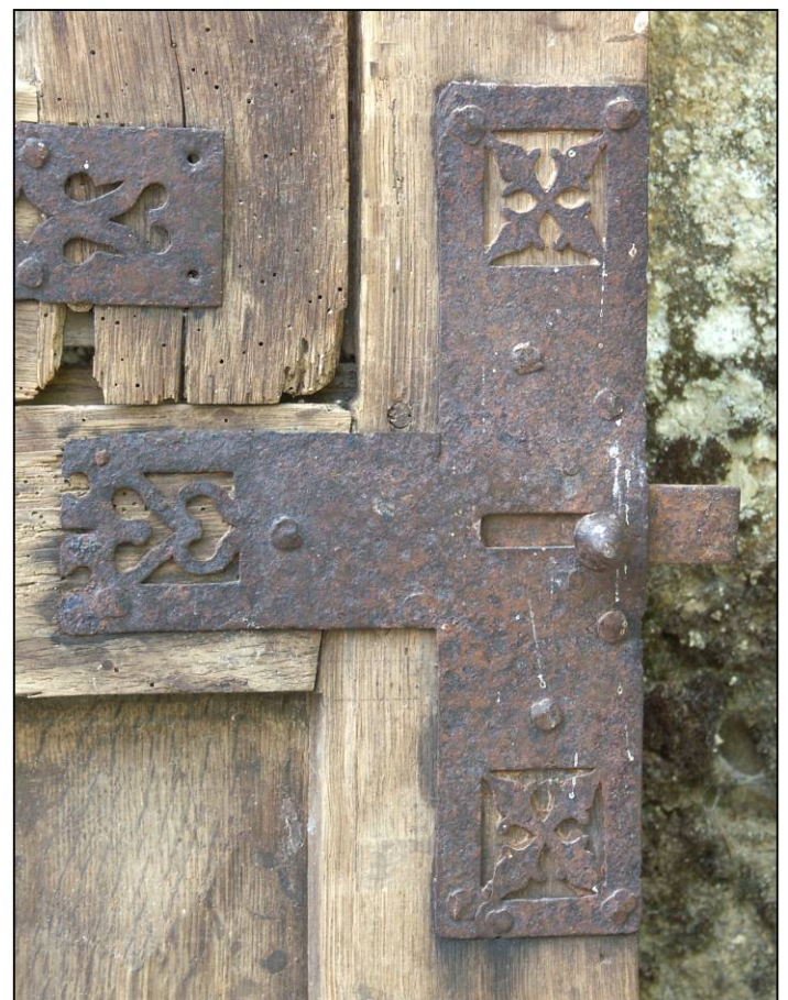
Fig. 2.7. Targette