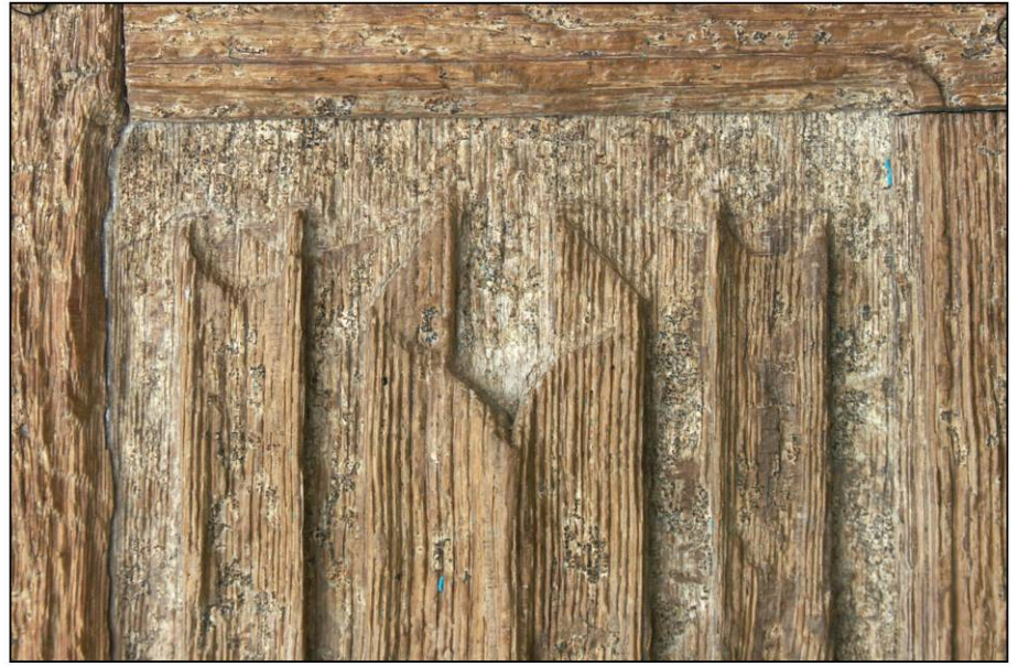
Fig. 2.2. Panneau à pli de serviette