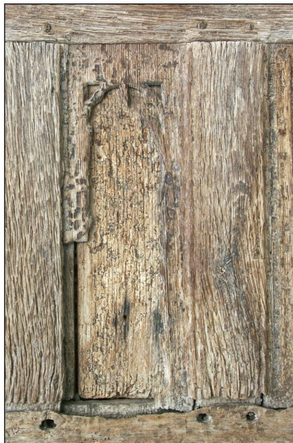
Fig. 2.6. Claire-voie