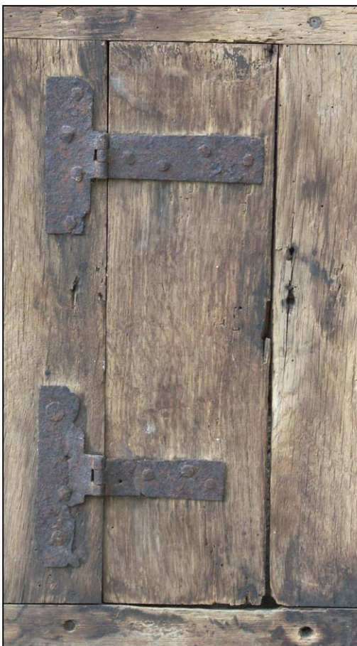
Fig. 2.5. Guichet