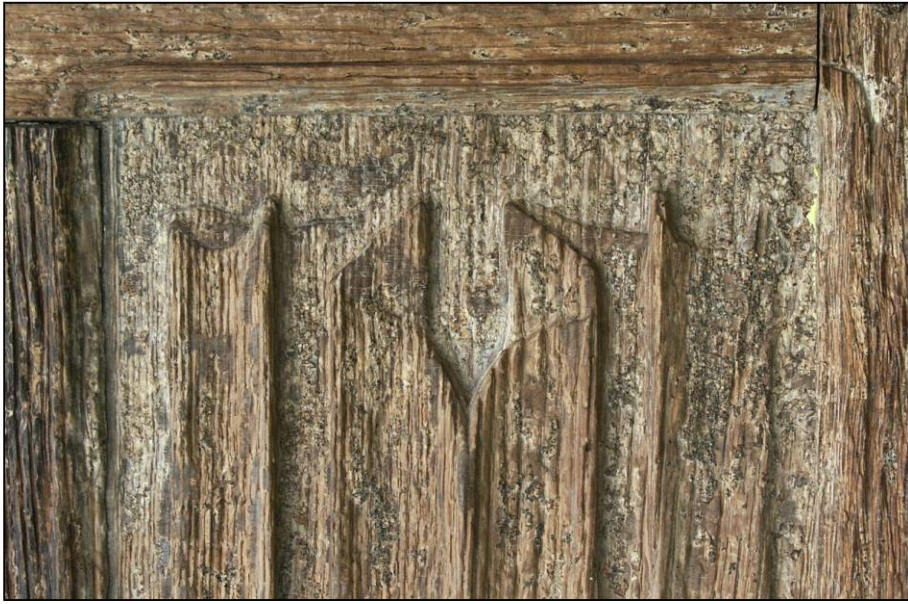
Fig. 2.1. Panneau à pli de serviette