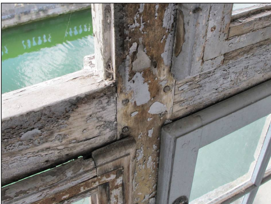
Fig. 10.7. Croisée RdC 25