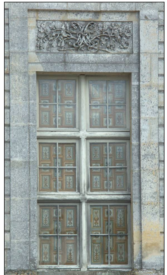
Fig. 10.6. Croisée RdC 39