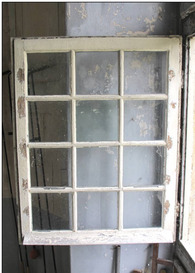
Fig. 10.5. Croisée RdC 25