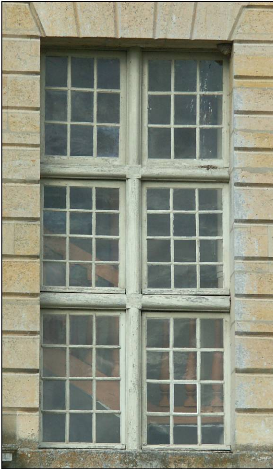
Fig. 10.1. Croisée RdC 19