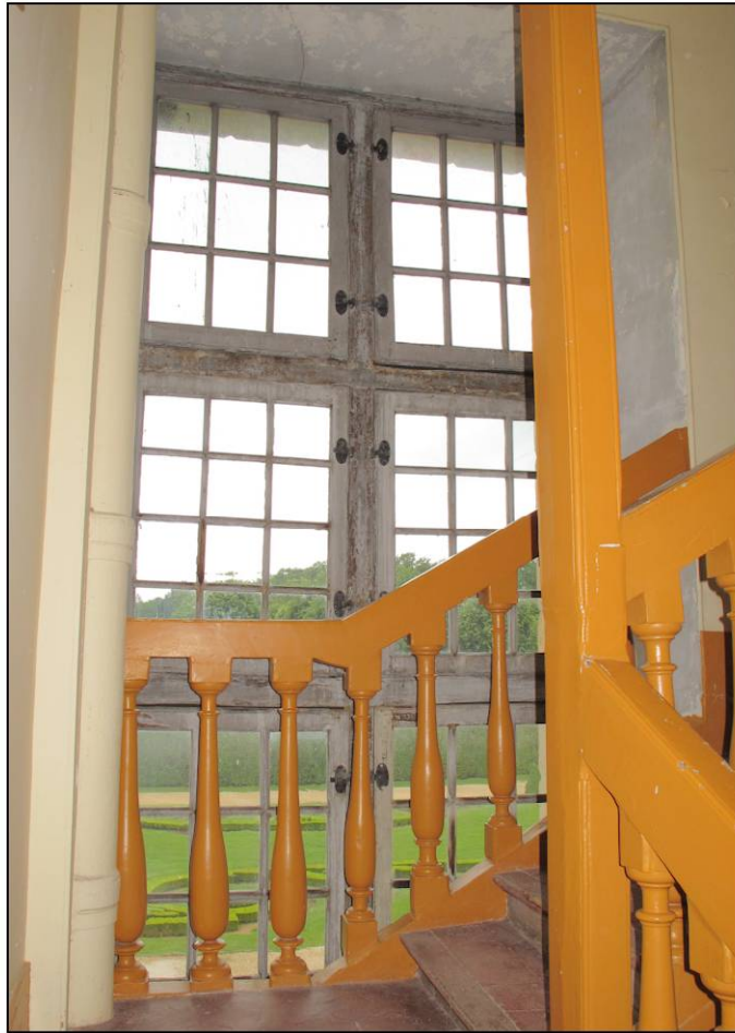
Fig. 10.2. Croisée RdC 19