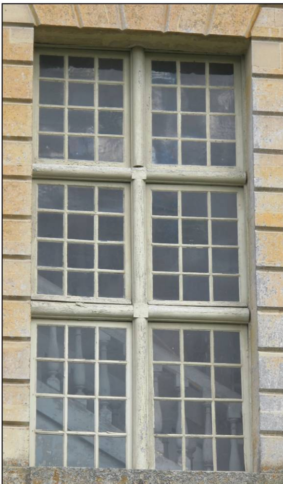
Fig. 10.4. Croisée RdC 25