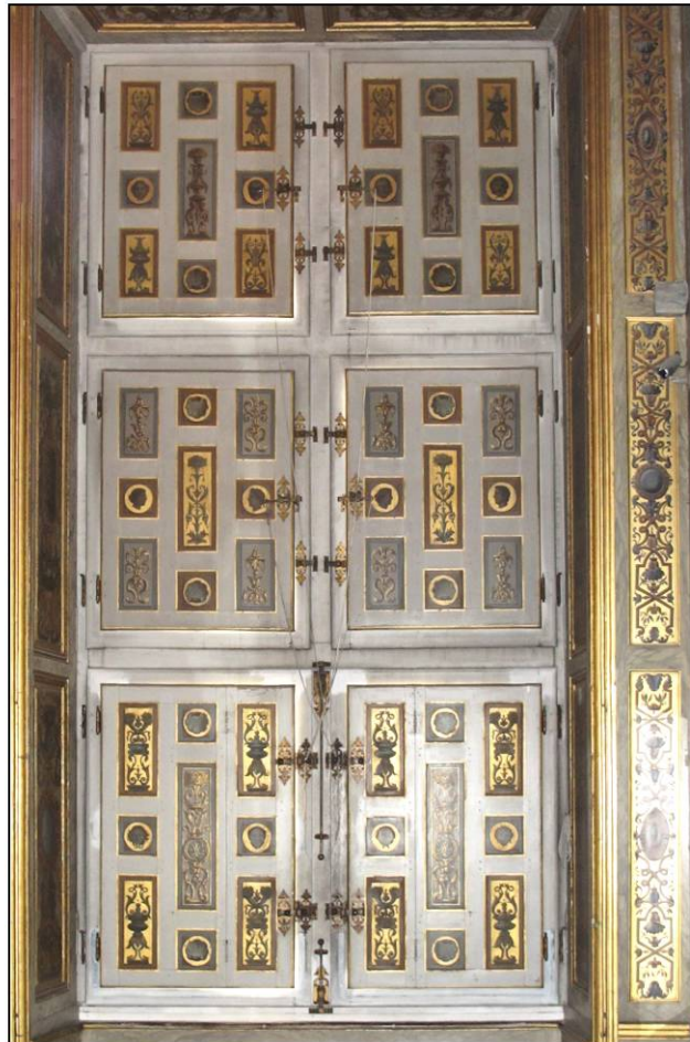
Fig. 9.5. Croisée RdC 16