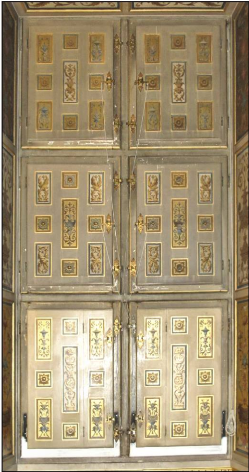
Fig. 9.1. Croisée RdC 5