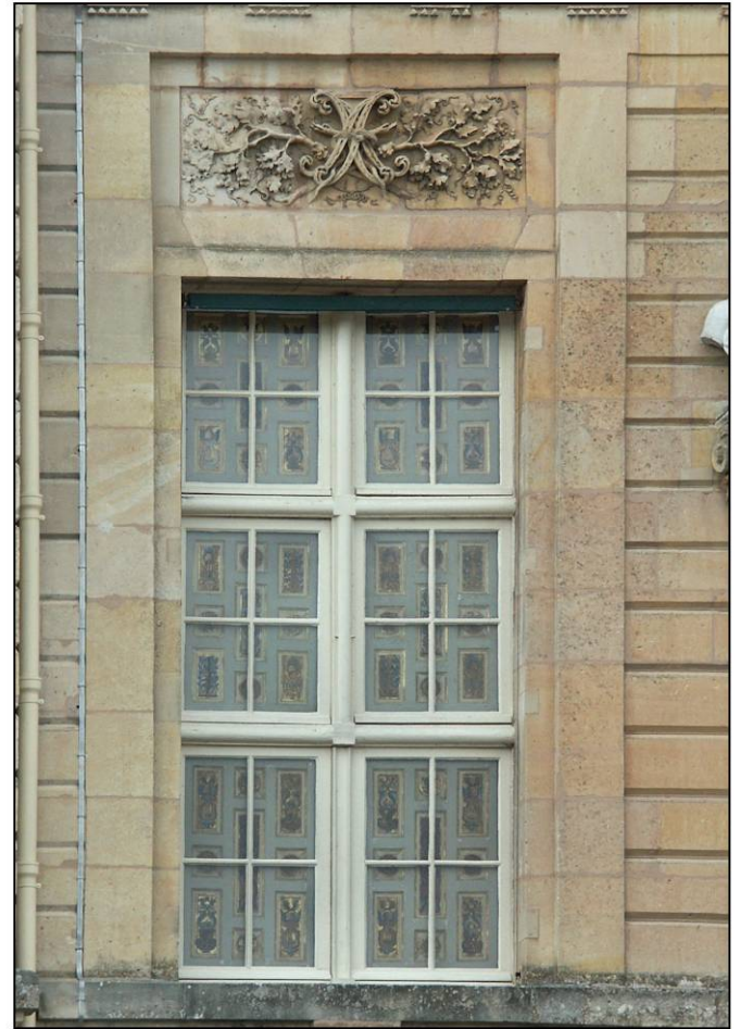
Fig. 9.3. Croisée RdC 14