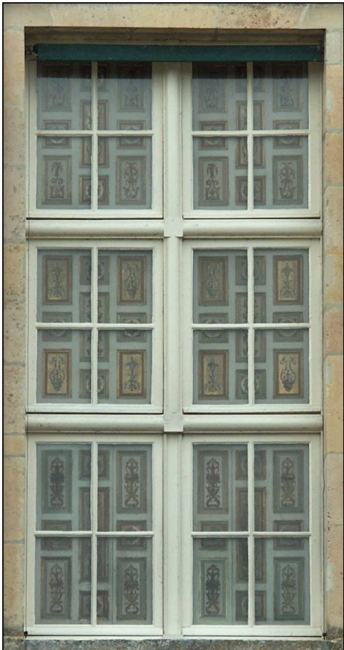
Fig. 9.4. Croisée RdC 16