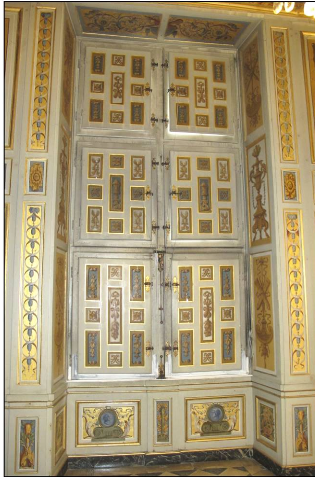
Fig. 9.2. Croisée RdC 13