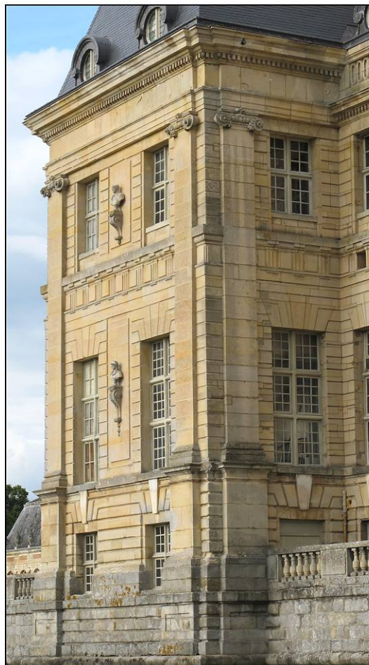
Fig. 2.4. Pavillon nord-ouest