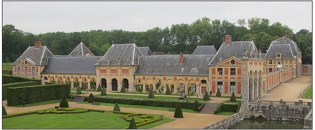
Fig. 2.2. Communs