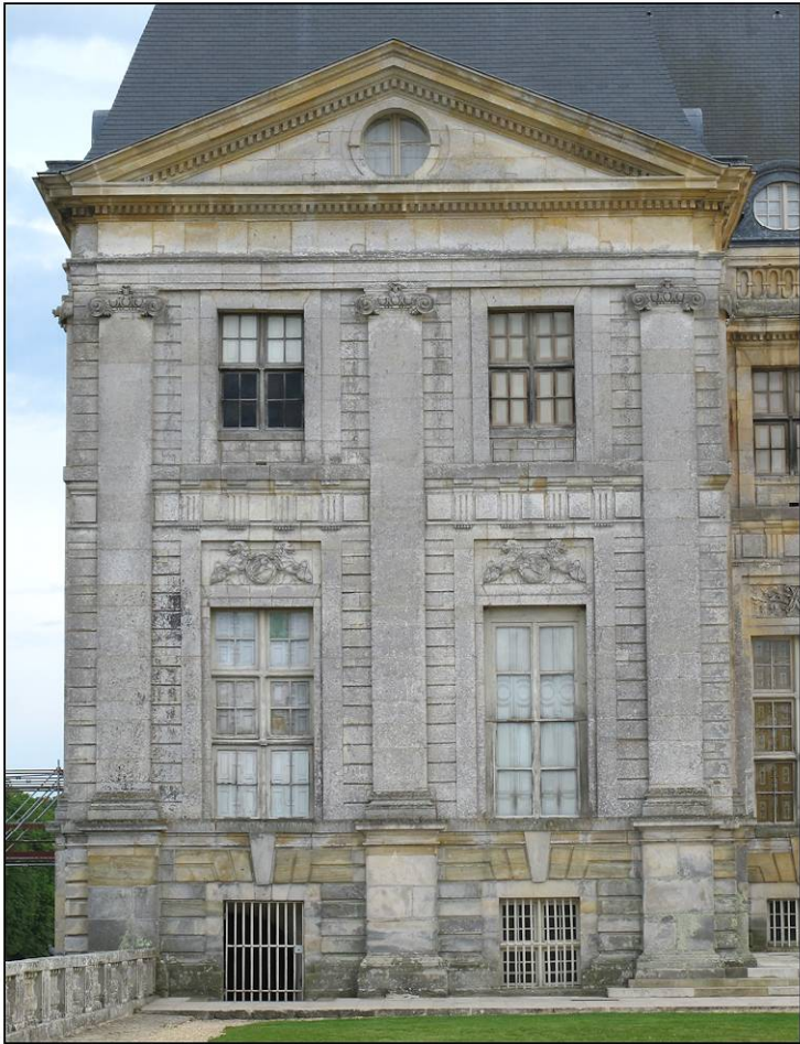
Fig. 2.1. Pavillon nord-est / façade nord