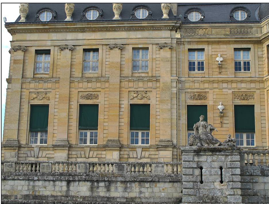
Fig. 2.6. Façade sud