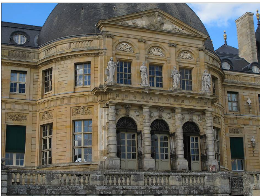
Fig. 1.5. Façade sud / rotonde