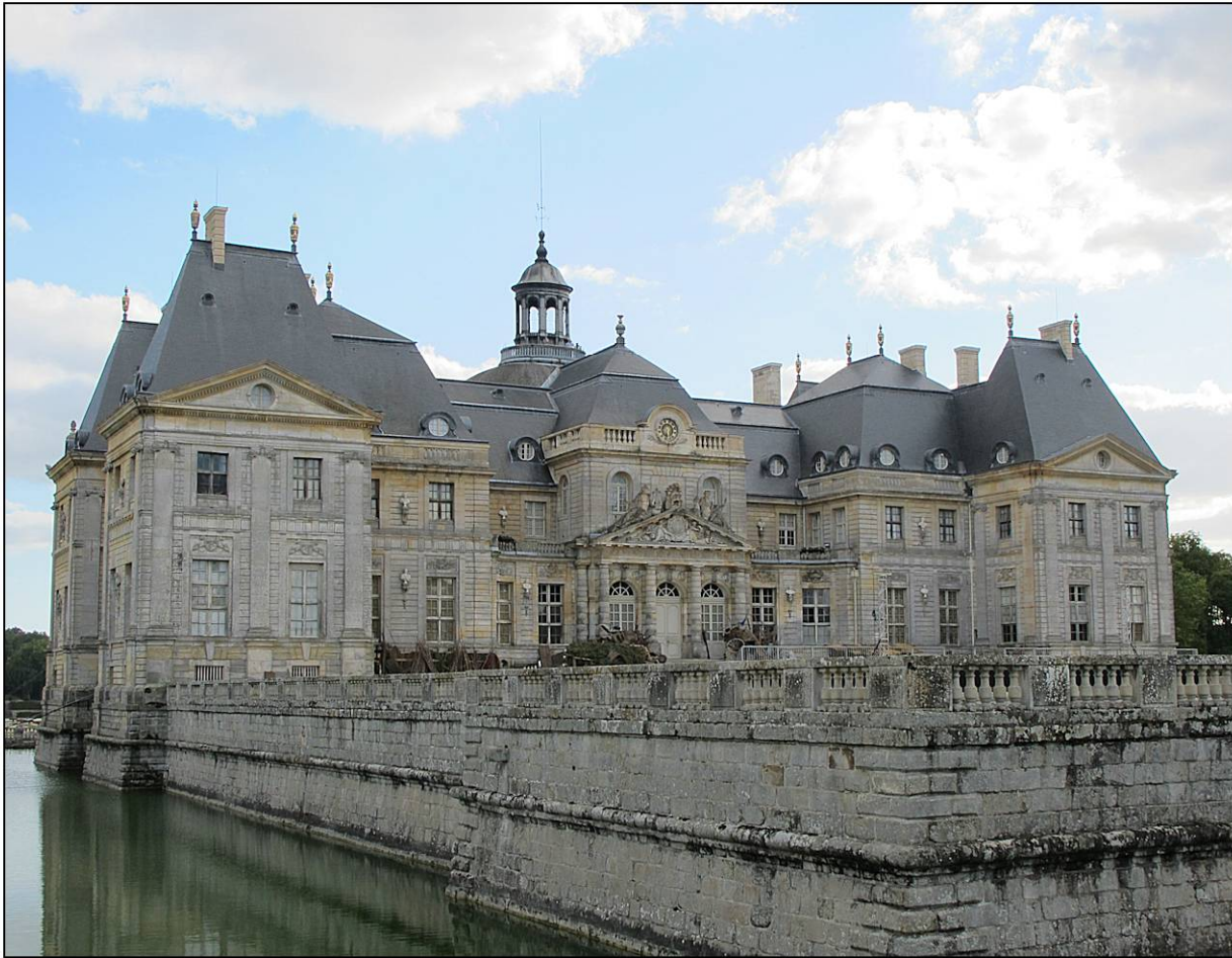
Fig. 1.1. Façade nord