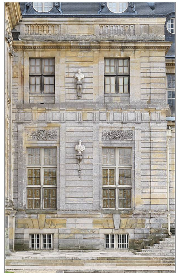
Fig. 1.4. Avant-corps nord-est / façade nord