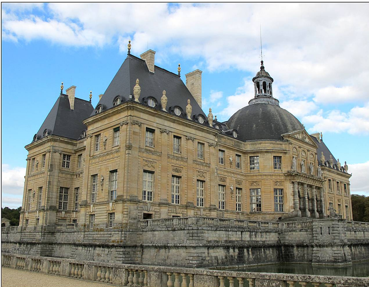
Fig. 1.3. Façades ouest et sud