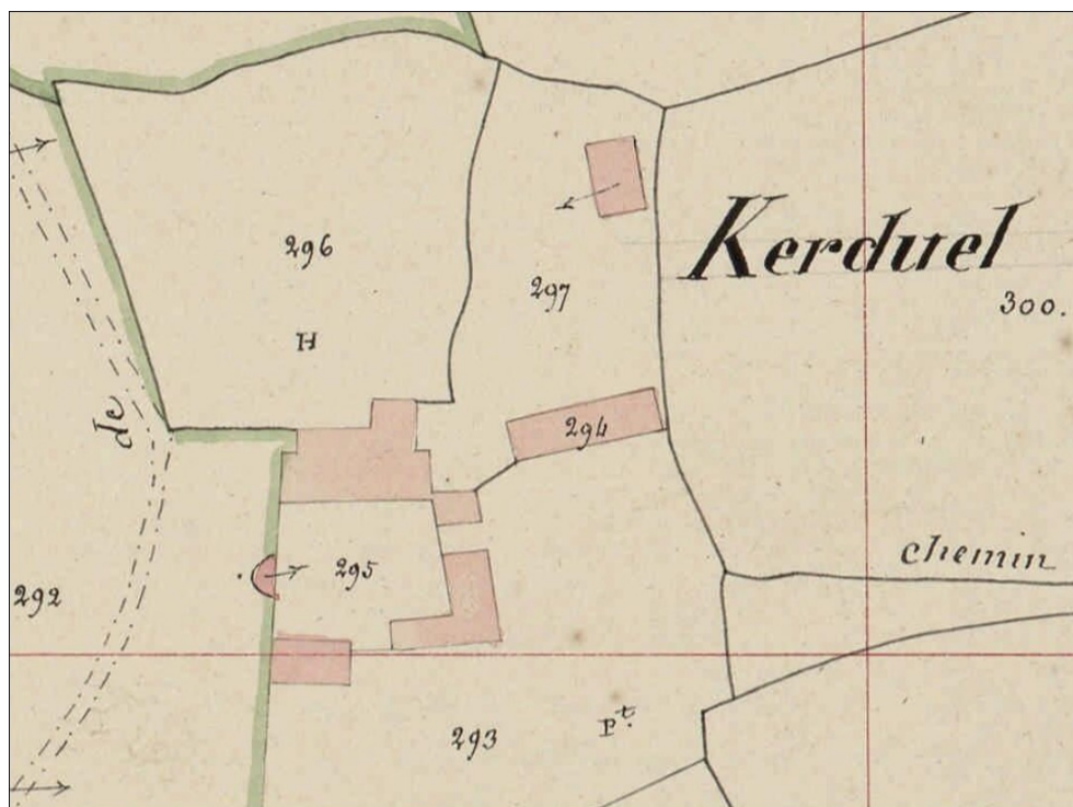
Fig. E.2. Le manoir sur la cadastre Napoléonien (1842)

Les éléments ont des épaisseurs irrégulières et sont simplement ajustés au niveau de leurs assemblages. Le parement intérieur de la croisée, seul analysable, n'a pas été dressé à l'aide d'un outil à fût. Si elle peut paraître étonnante, cette caractéristique s'explique pourtant aisément. Seul le parement extérieur doit être plan pour servir de référence et établir précisément la position des assemblages et des profils. Le parement intérieur, sans aucun décor et rarement visible, peut donc être grossièrement égalisé pour affleurer les assemblages et éliminer les traces de sciage.