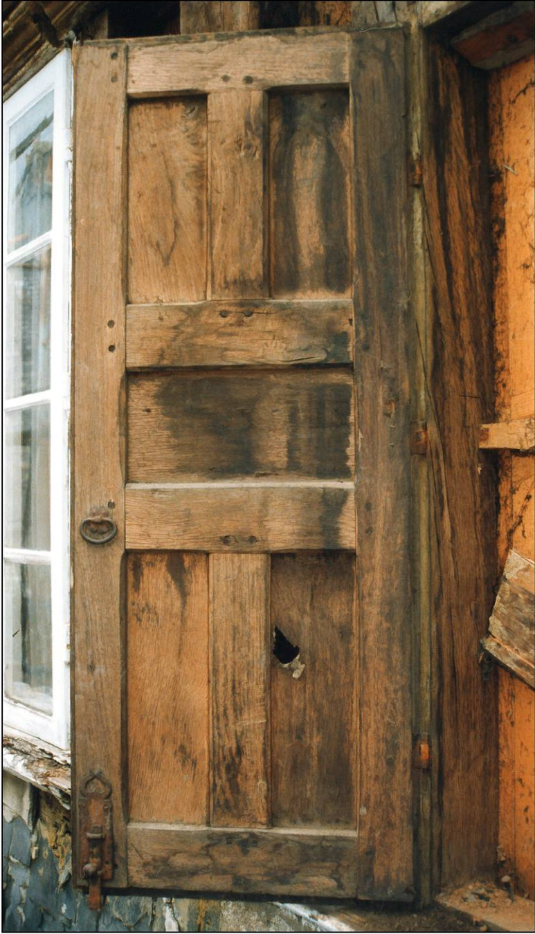
Fig. 2.1. Volet droit (intérieur)