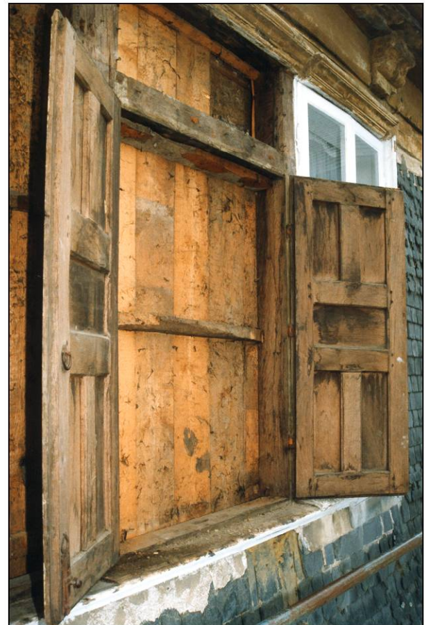
Fig. 2.5. Fenêtre (volets ouverts)