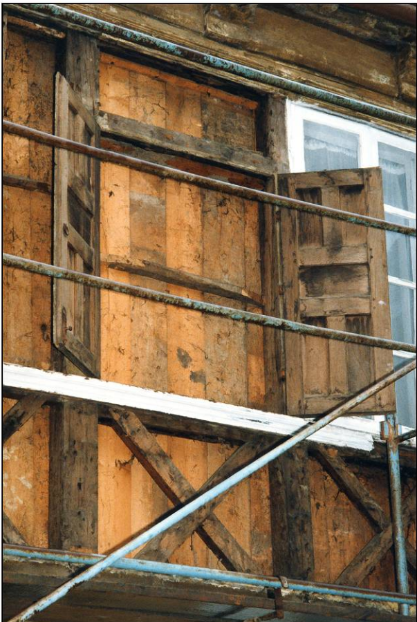
Fig. 2.3. Travée 6