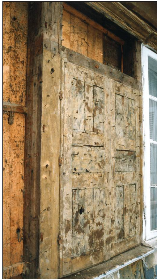
Fig. 2.4. Fenêtre (volets fermés)