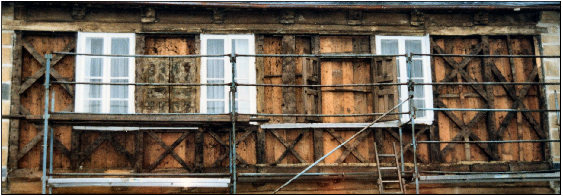
Fig. 1.1. Façade nord / second niveau