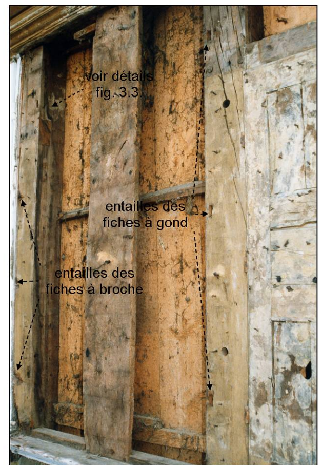
Fig. 1.3. Travée centrale (5)