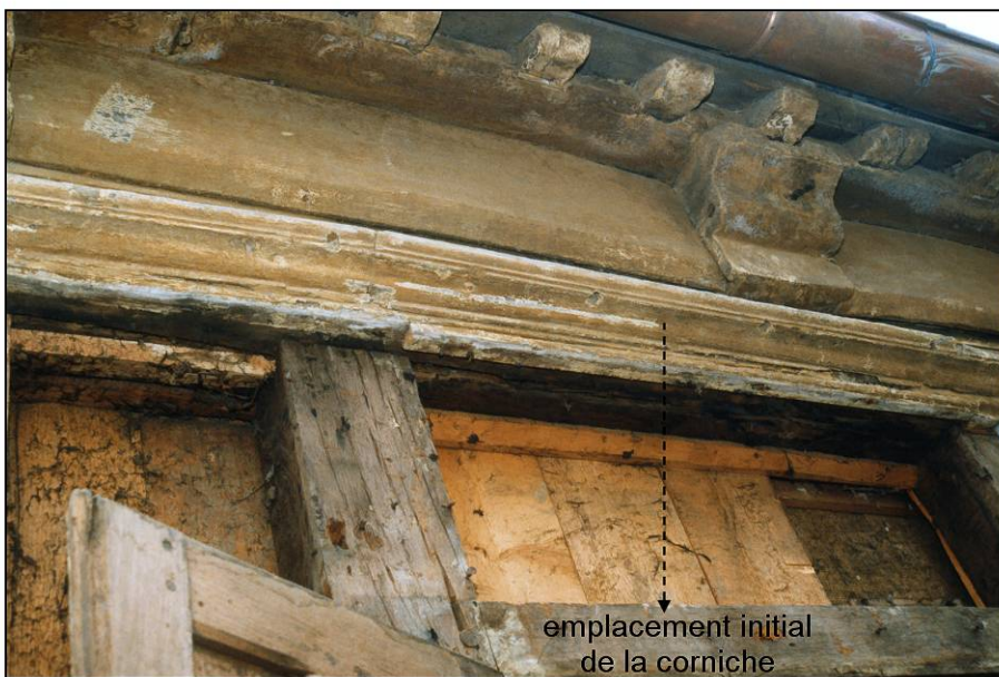
Fig. 1.2. Travée 6