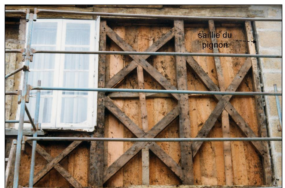
Fig. 1.5. Travées 7, 8 et 9