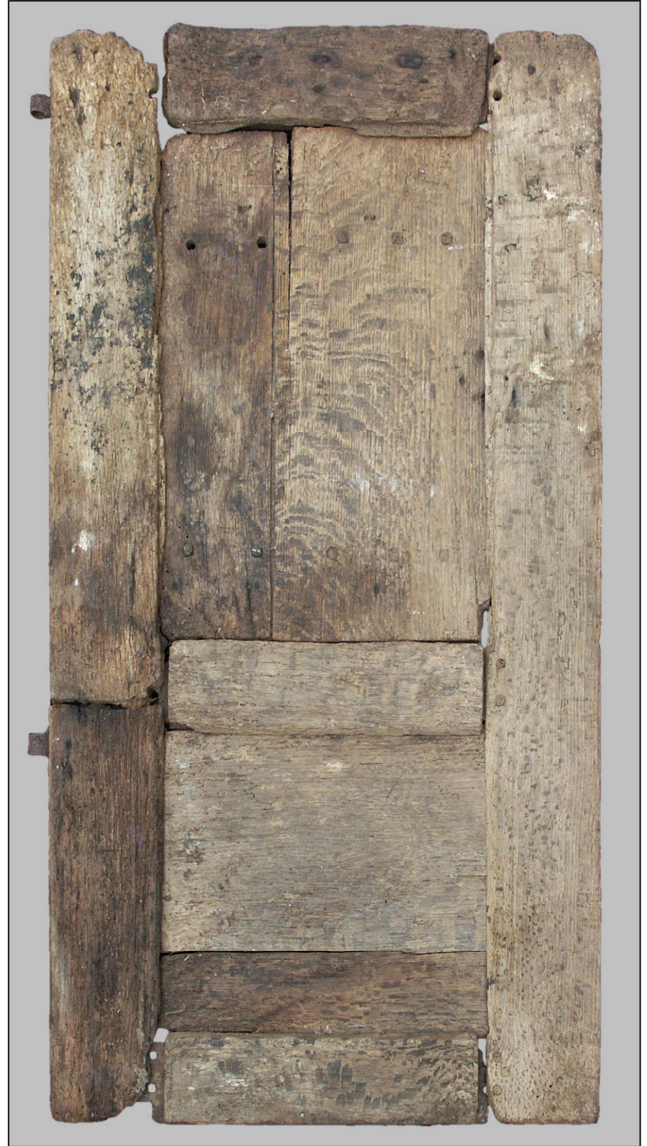
Fig. 3.2. Elévation extérieure