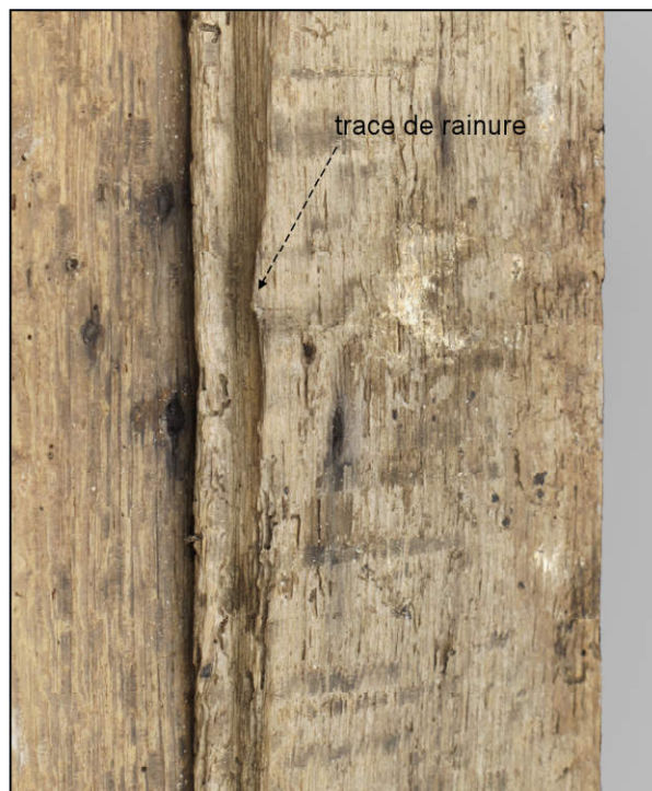
Fig. 3.4. Battant gauche (vue extérieure)