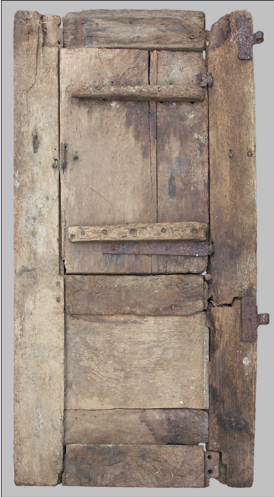
Fig. 3.1. Elévation intérieure