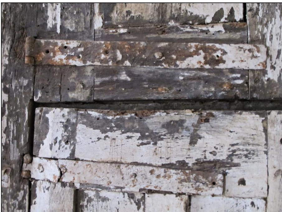
Fig. 3.7. Charnières