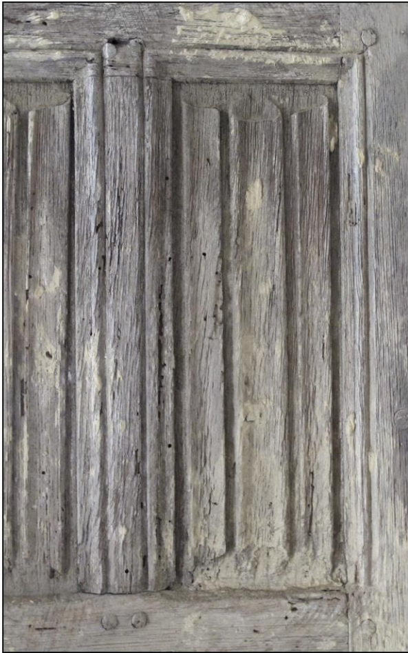
Fig. 3.1. Panneau à plis de serviette