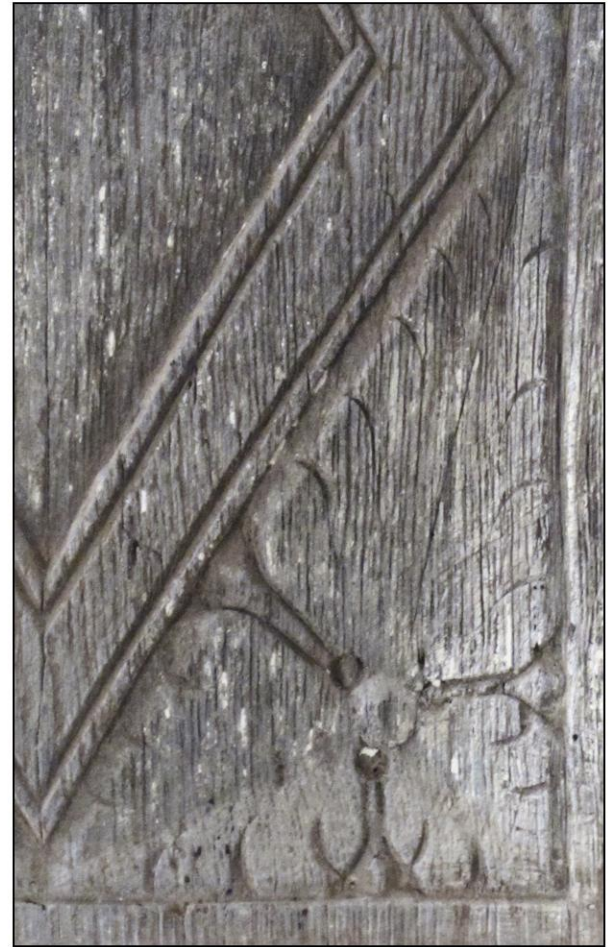
Fig. 3.3. Ecoinçon à fleur stylisée