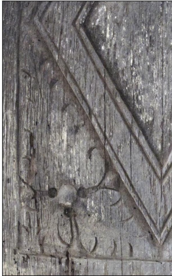
Fig. 3.2. Ecoinçon à fleur stylisée