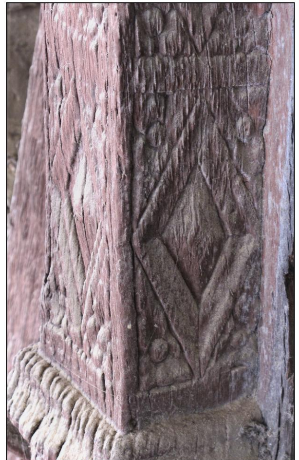
Fig. 3.6. Console ou pigeâtre