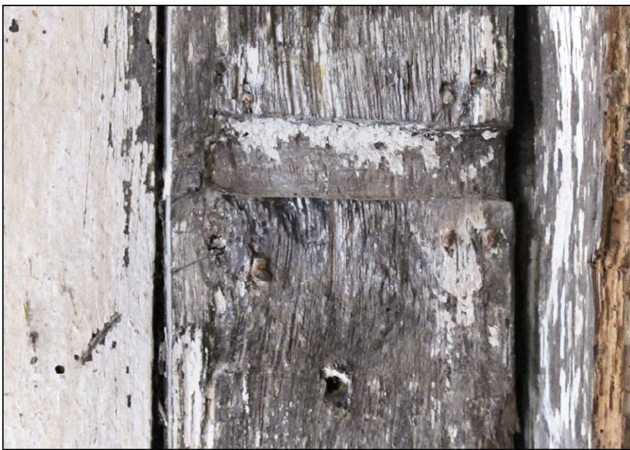
Fig. 2.3. Volet supérieur gauche / entaille du pêne de la targette