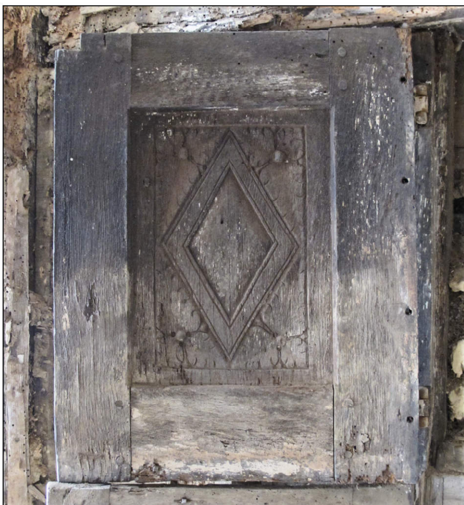
Fig. 2.5. Volet supérieur gauche / face extérieure