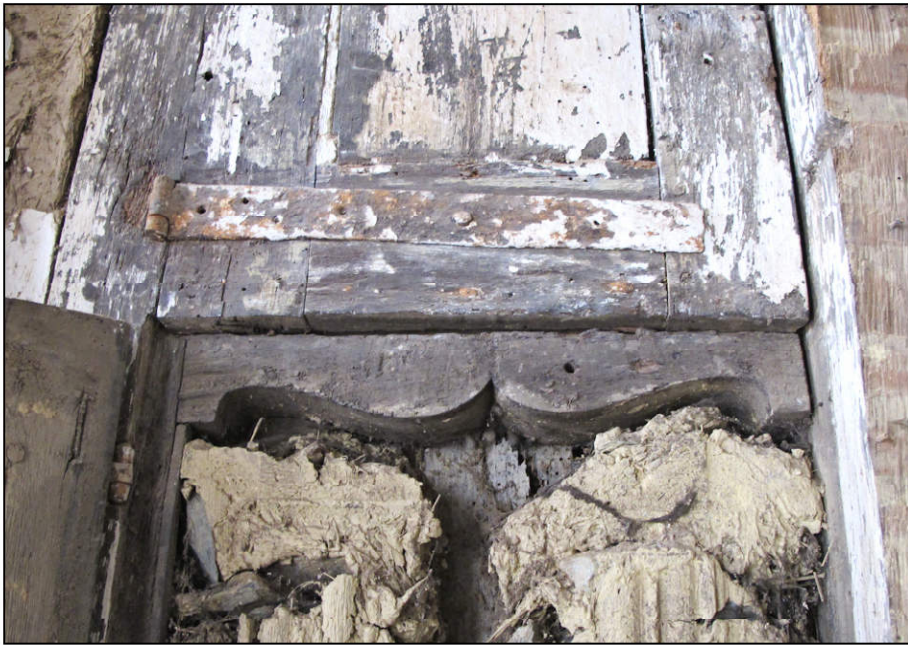
Fig. 2.1. Volet supérieur gauche / penture