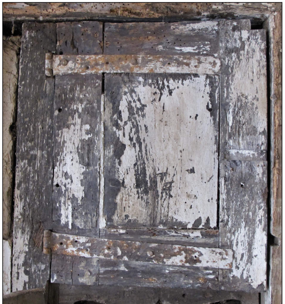
Fig. 2.4. Volet supérieur gauche / face intérieure