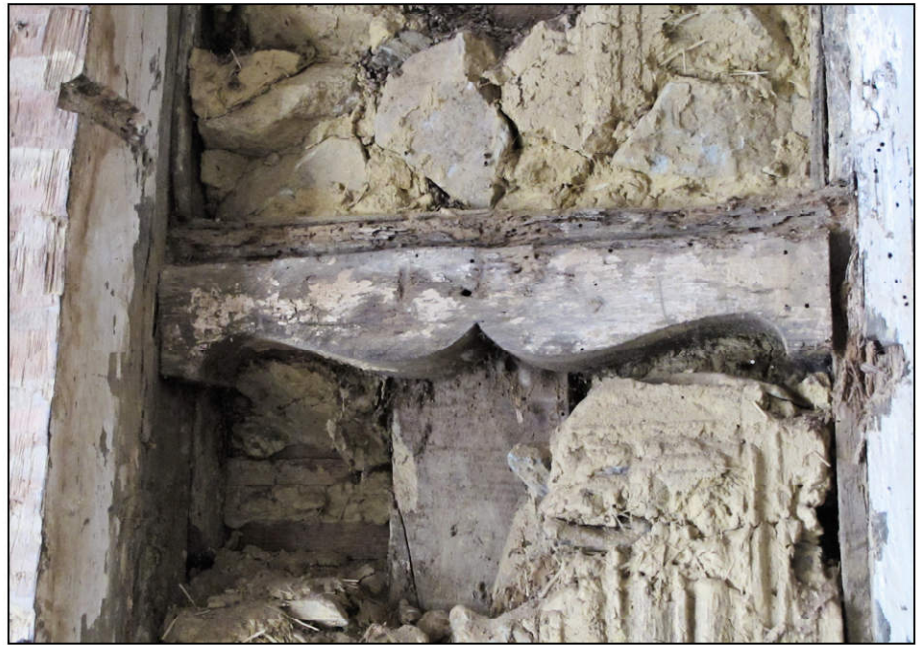
Fig. 2.2. Croisillon en accolade