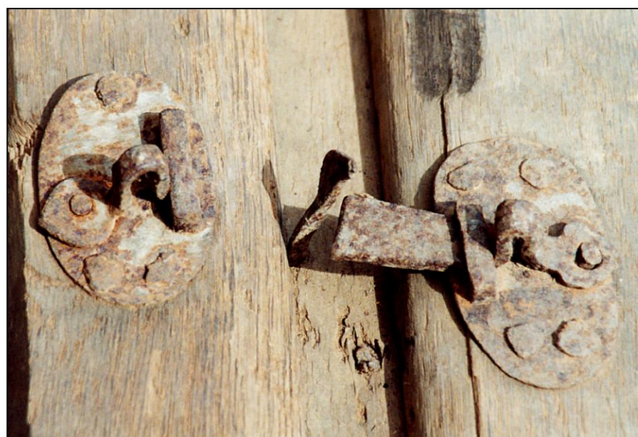
Fig. 1.5. Loquets