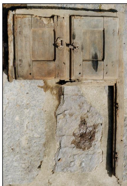
Fig. 1.4. Croisée