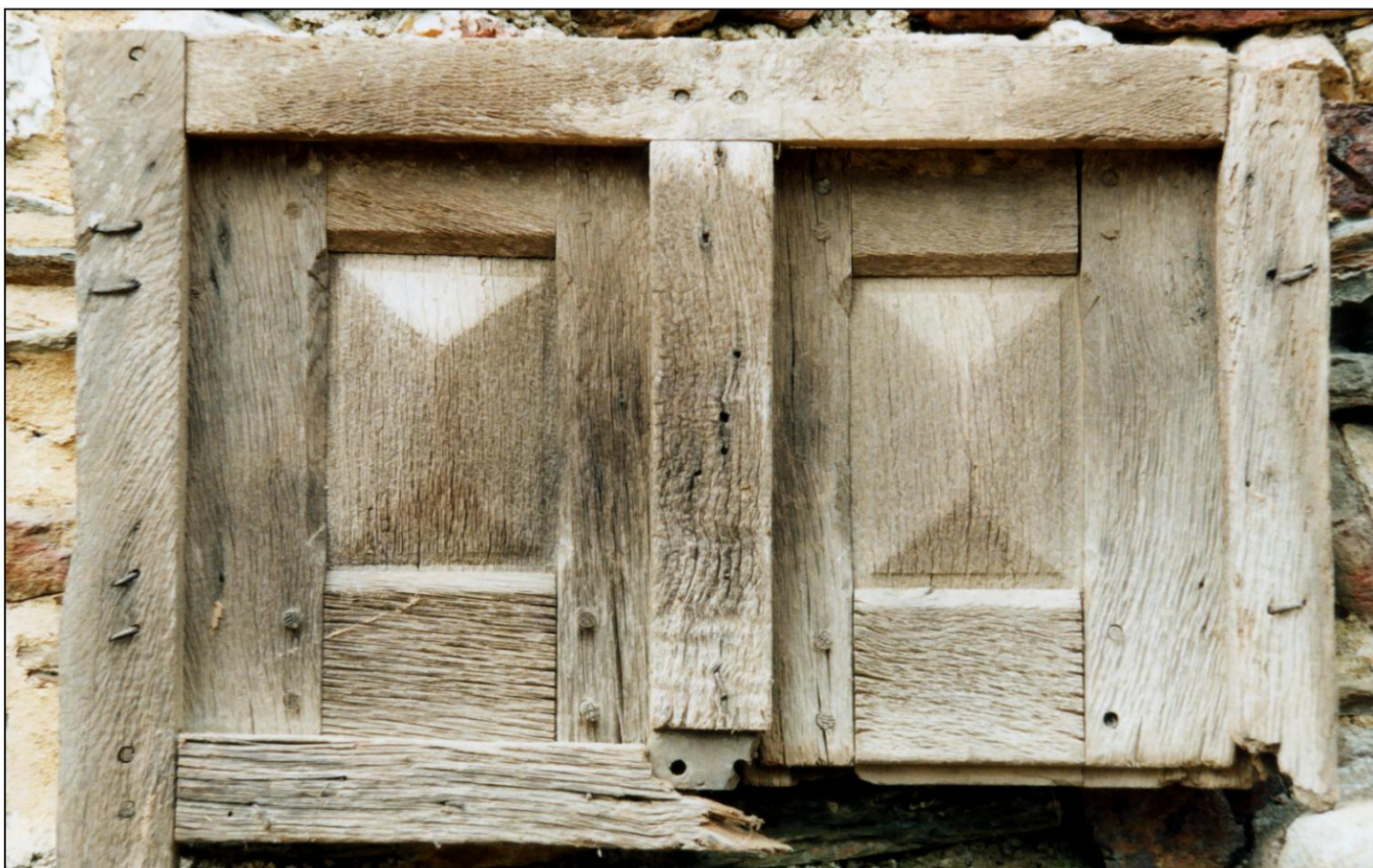
Fig. 1.2. Compartiments supérieurs (élévation extérieure)