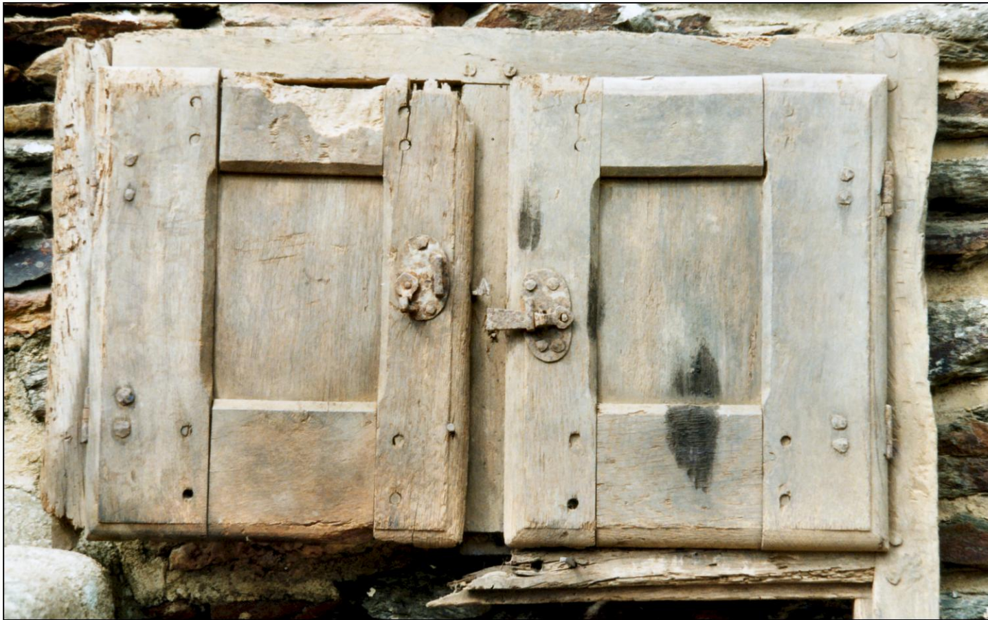
Fig. 1.1. Compartiments supérieurs (élévation intérieure)