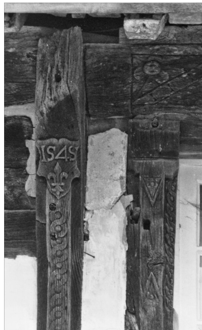
Fig. E.2. Fenêtre de l'étage (façade sud) Photo M.-H. Since, 1979, DRAC de Normandie

A l'instar de plusieurs manoirs de cette époque, chacun des volets avait une petite pendeloque pour en faciliter la manœuvre 8 . Généralement ces pendeloques accompagnent des targettes ou des loquets à bouton et ne sont donc pas indispensables. Ici, l'emploi de tourniquets pour fermer les volets leur rend leur rôle primitif.