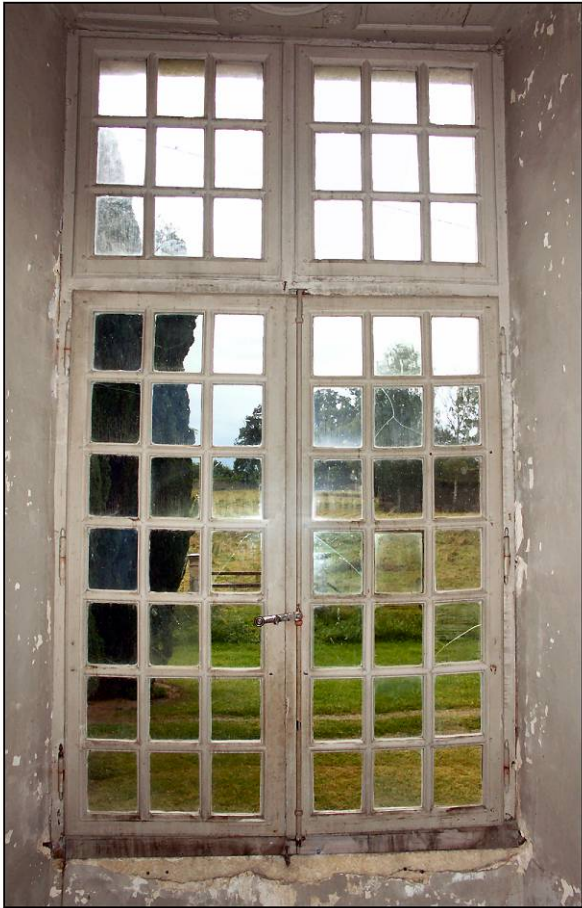
Fig. 2.1. Elévation intérieure