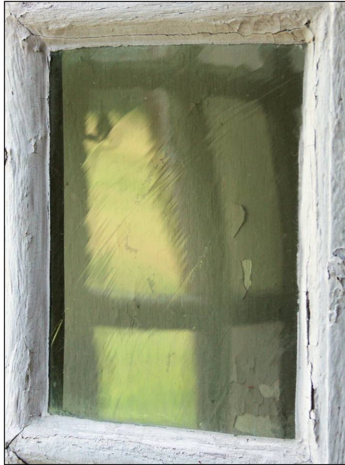
Fig. 2.2. Vitrage (verre en plateau)