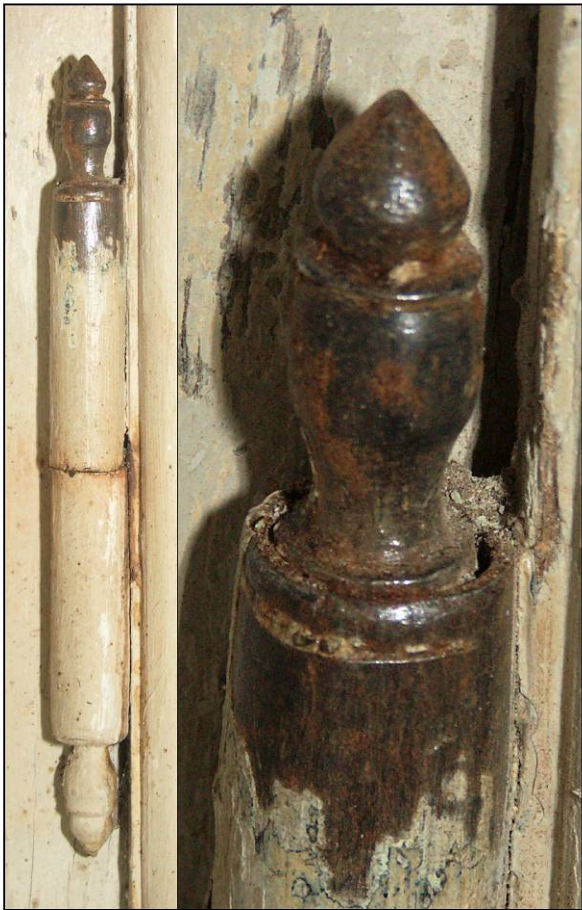
Fig. 2.3. Fiche