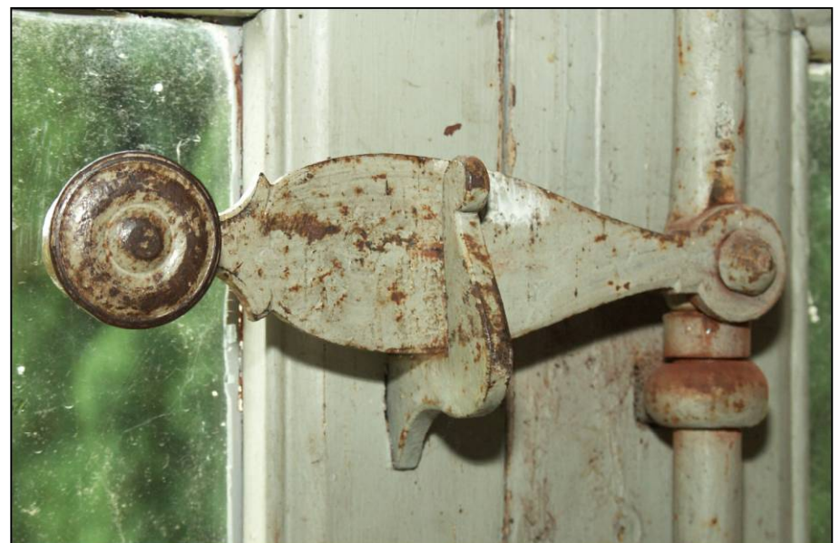
Fig. 2.6. Poignée d'espagnolette (autre modèle)