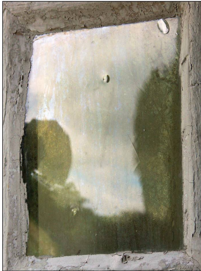
Fig. 2.4. Vitrage (verre en plateau)