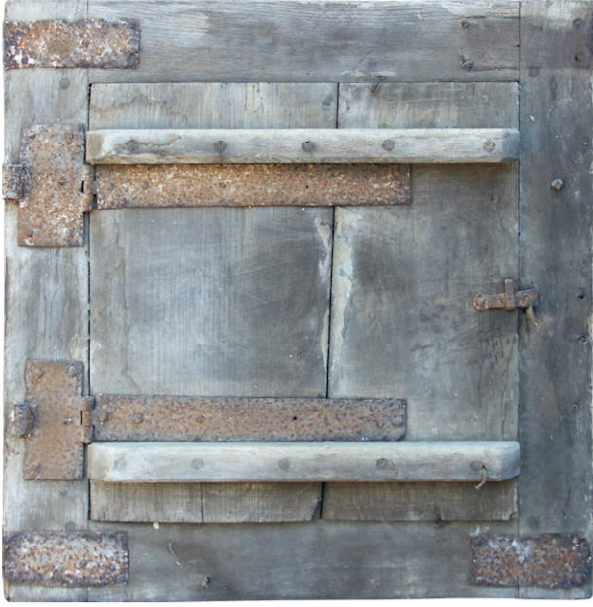
Fig. 1.1. Vantaill supérieur gauche