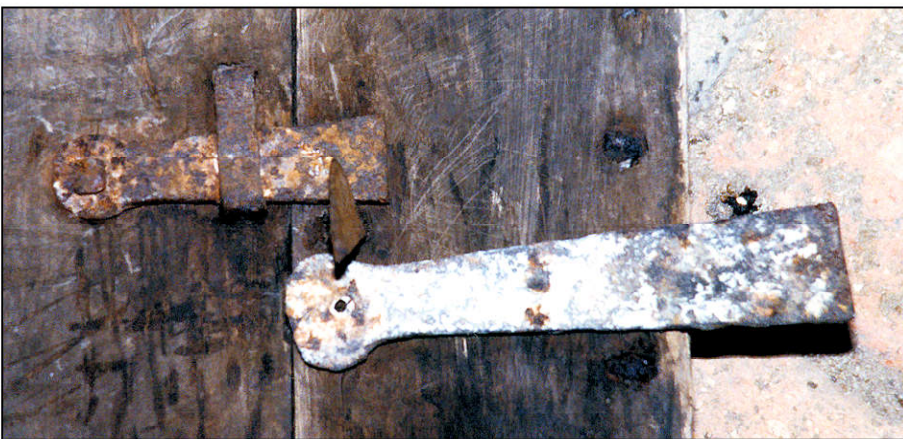
Fig. 1.6. Loquets