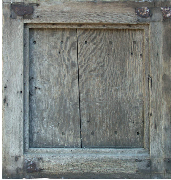
Fig. 1.2. Vantaill supérieur gauche