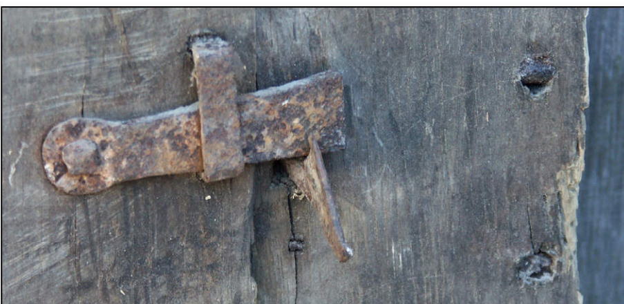
Fig. 1.7. Loquet