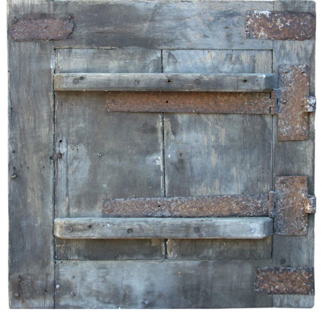
Fig. 1.3. Vantaill supérieur droit