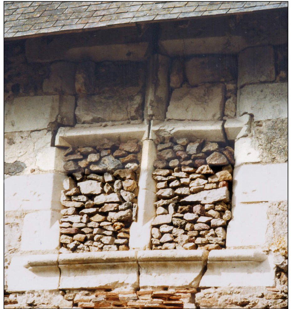
Fig. 1.5. Fenêtre (élévation extérieure)