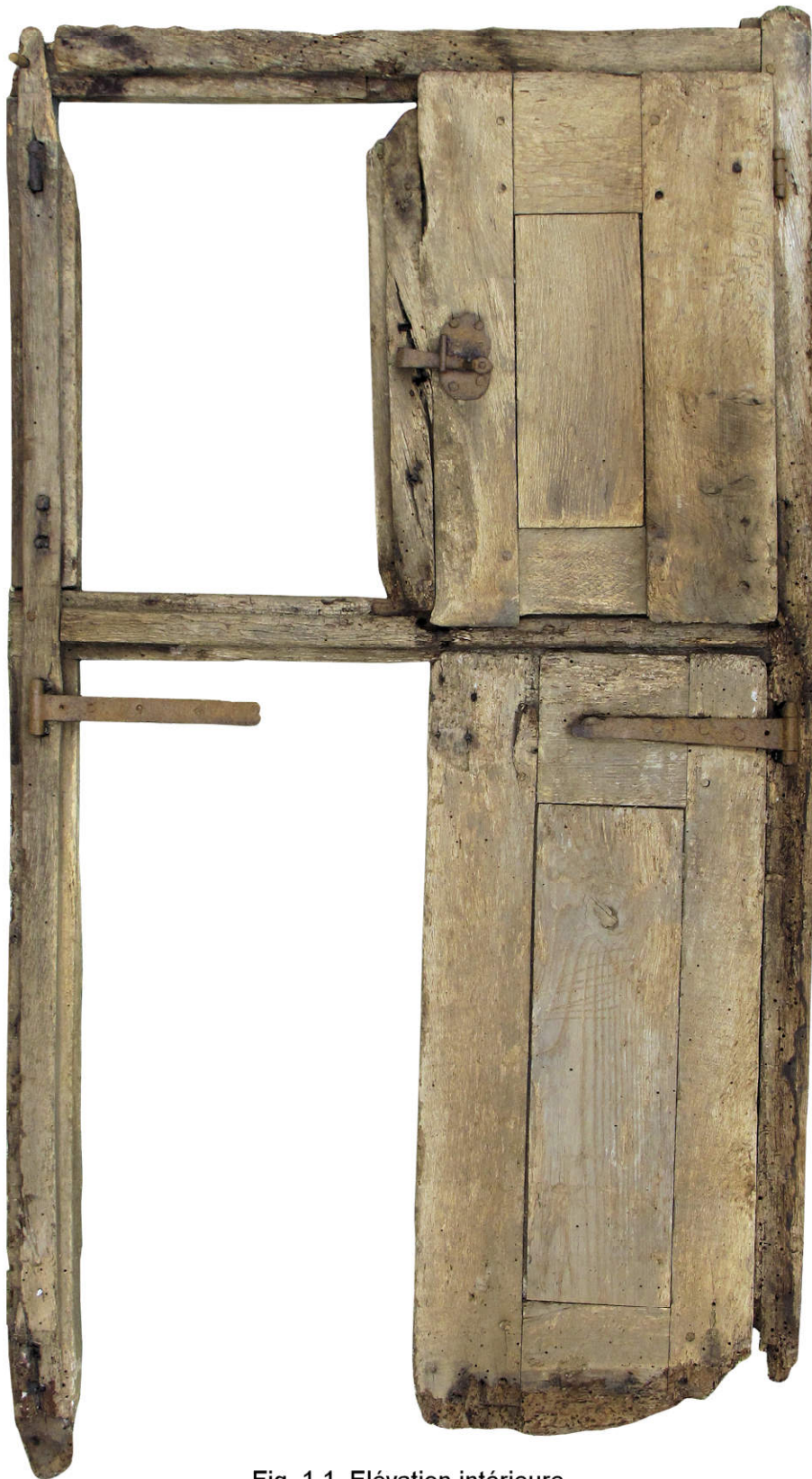
Fig. 1.1. Elévation intérieure