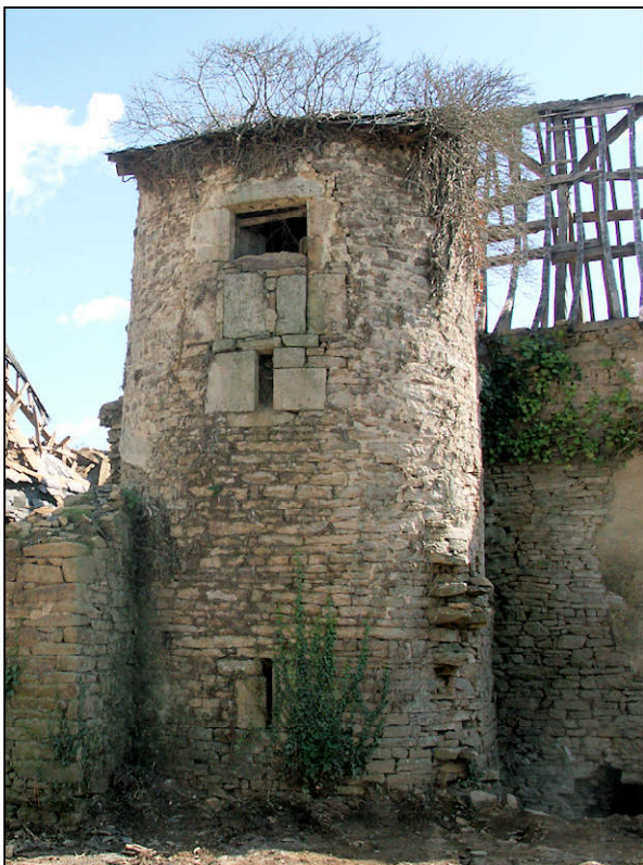
Fig. 1.3. Tour (en 2006, avant restauration)