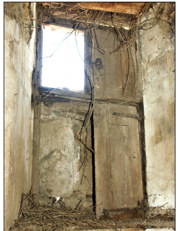
Fig. 1.5. Fenêtre (élévation intérieure)