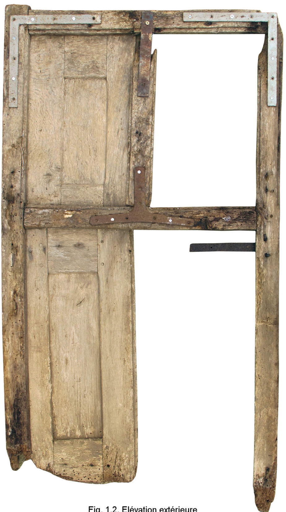
Fig. 1.2. Elévation extérieure