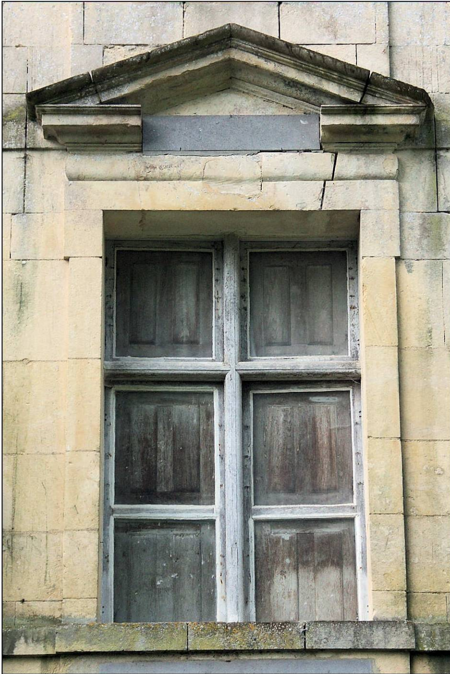
Fig. 1.1. Fenêtre du 1er étage