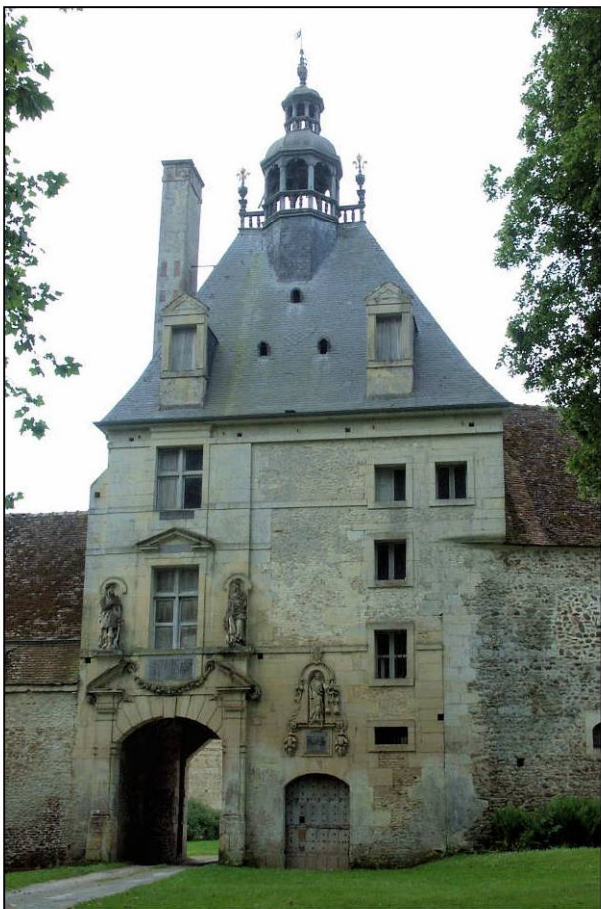
Fig. 1.3. Pavillon / façade nord