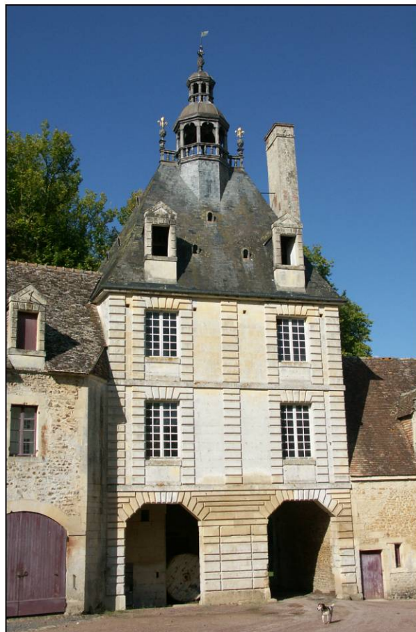
Fig. 1.4. Pavillon / façade sud