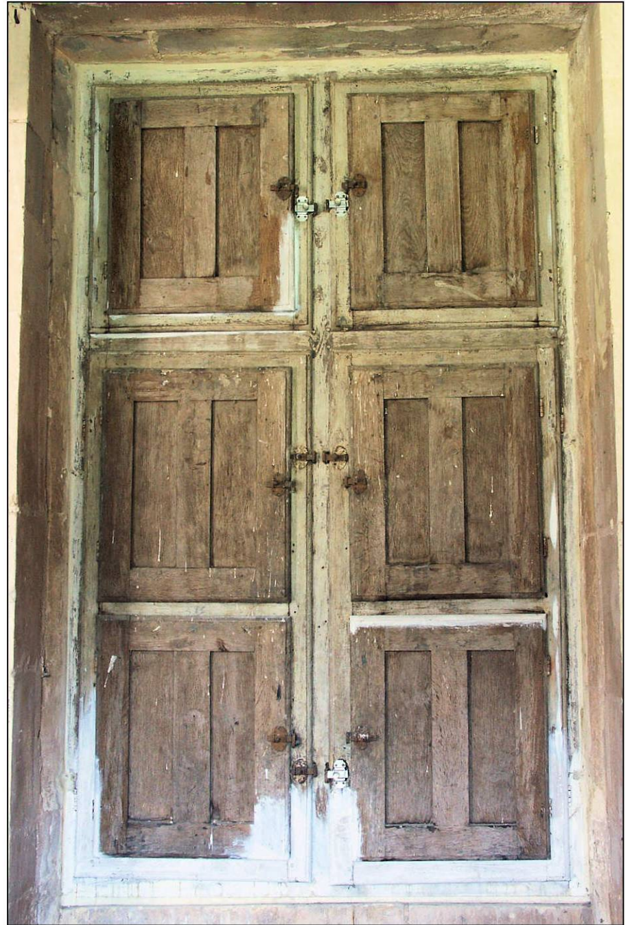
Fig. 1.2. Croisée / élévation intérieure