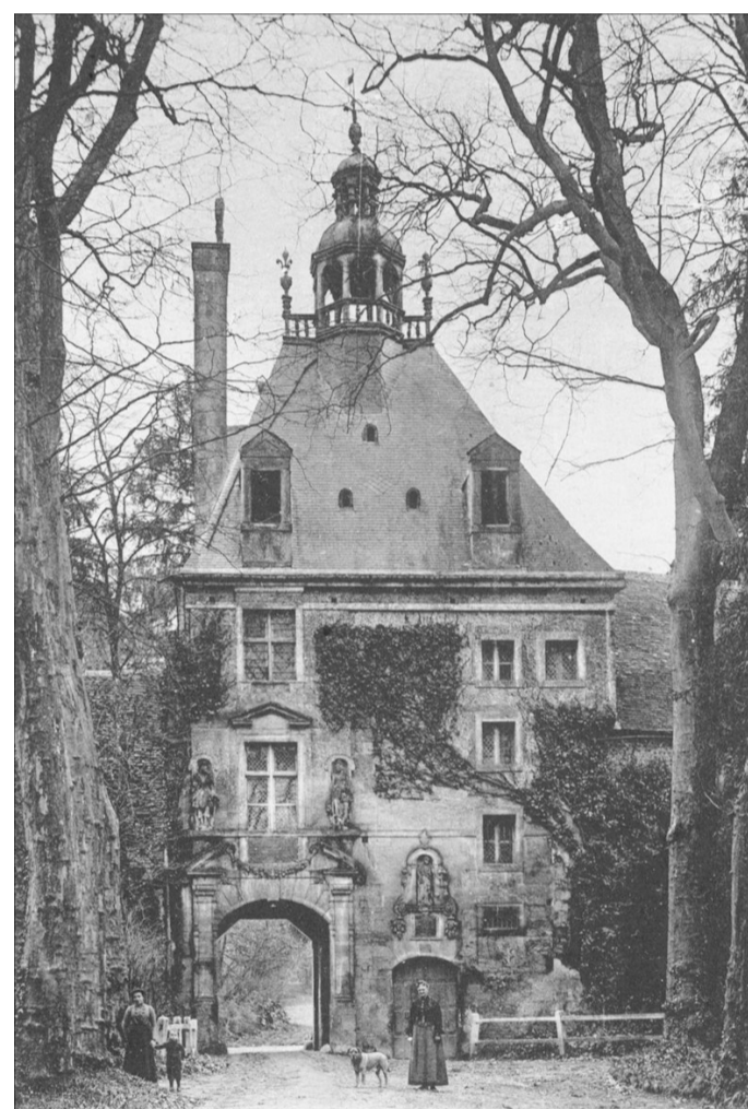
Fig. E.1. et E.2. Cartes postales du début du XXe s. Figure du haut, les vitreries dégradées de bornes en carré (voir détail fig. 2.1) Figure du bas, quelques années plus tard, les vitreries losangées