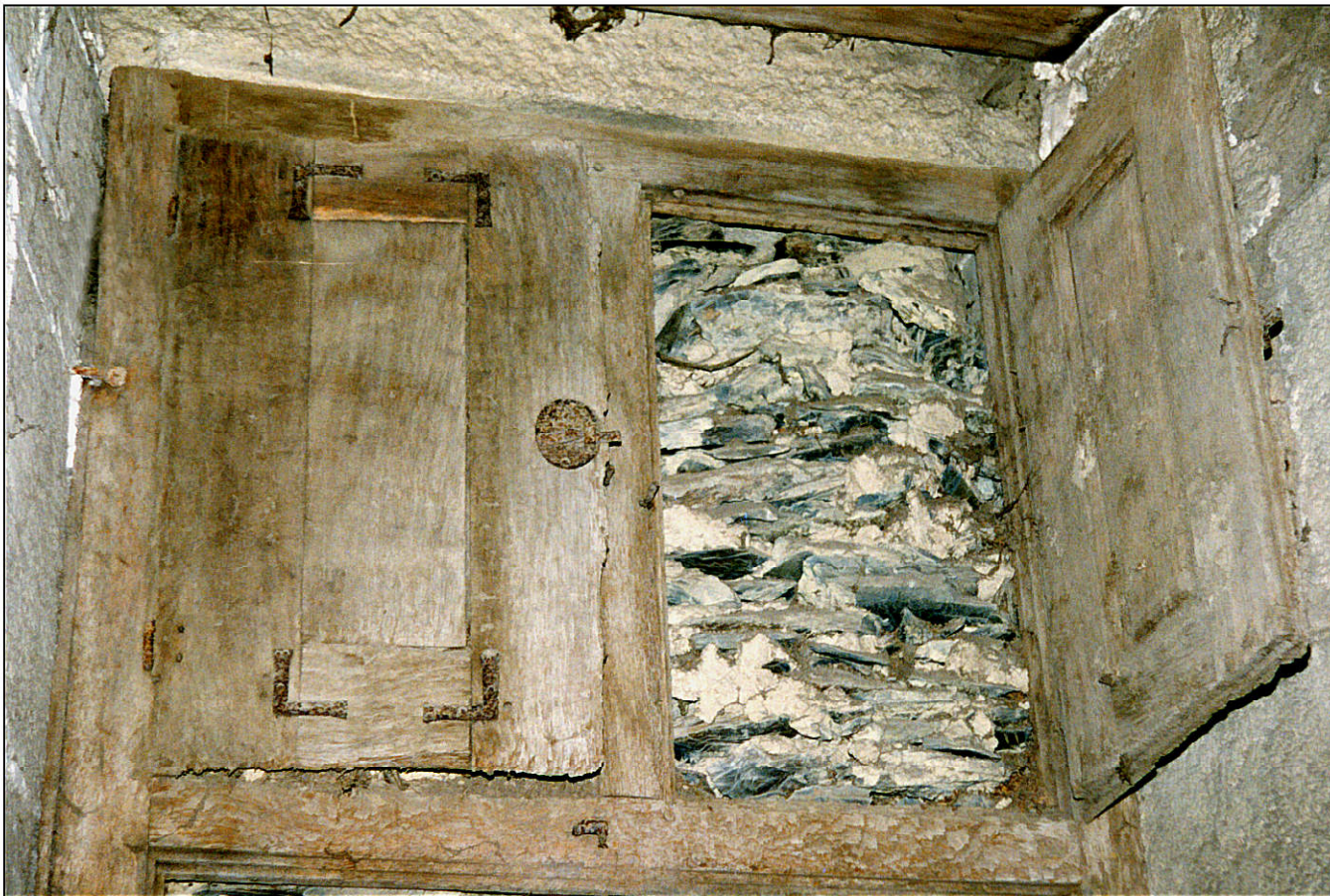
Fig. 4.4. Compartiments supérieurs