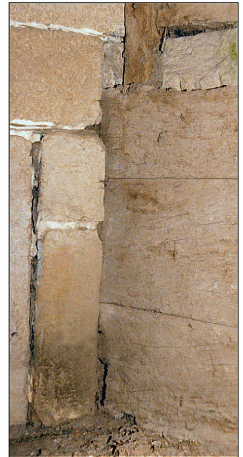
Fig. 4.5. Lambris