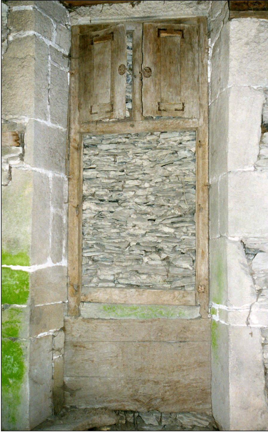
Fig. 4.1. Croisée (élévation intérieure)