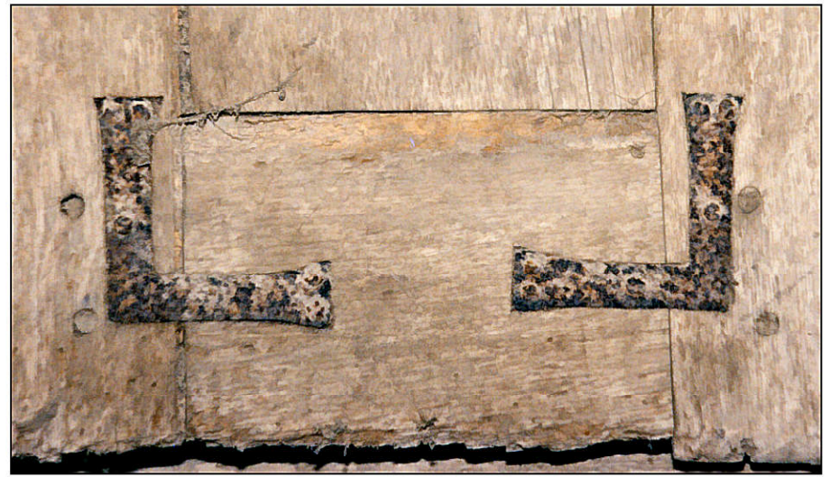
Fig. 4.3. Equerres