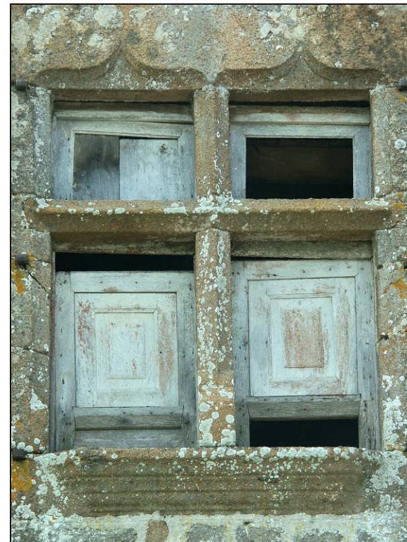
Fig. 1.2. Elévation extérieure (lucarne)