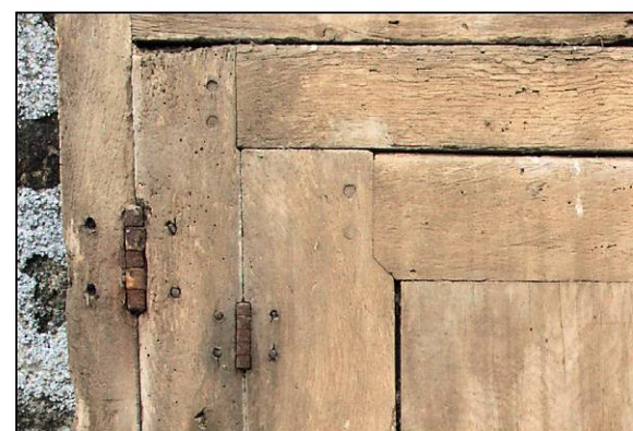
Fig. 1.3. Fiches à broche