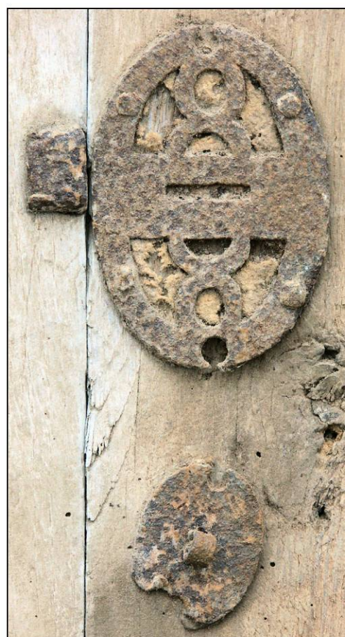
Fig. 1.5. Targette