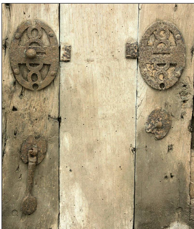
Fig. 1.4. Targettes et pendeloques