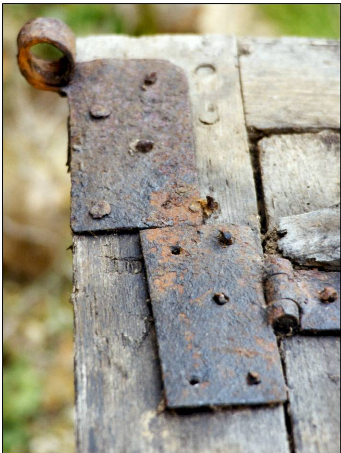
Fig. 2.3. Pentures (vantail vitré et volet inférieurs)