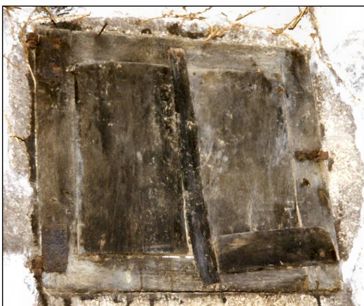
Fig. 2.5. Compartiment supérieur (élévation int.)