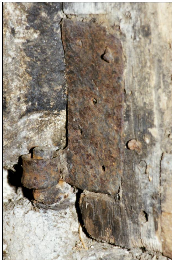
Fig. 2.4. Gond et platine (vantail vitré inf.)