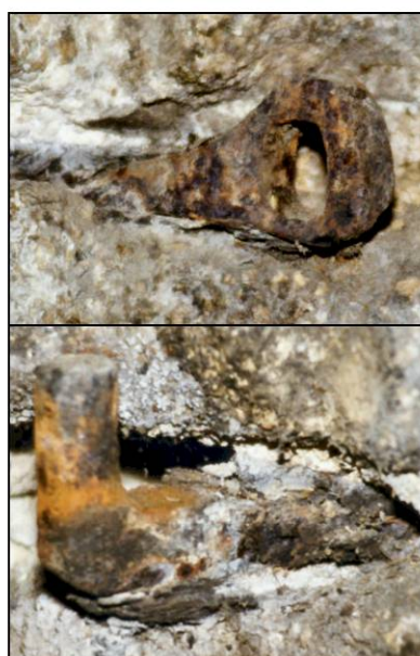
Fig. 2.6. Gâche et gond