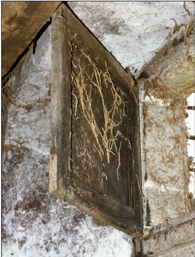
Fig. 2.1. Vantail vitré et volet supérieurs