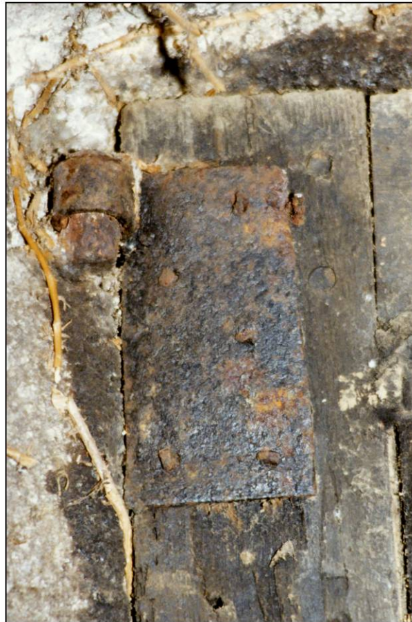
Fig. 2.2. Gond et platine (vantail vitré sup.)