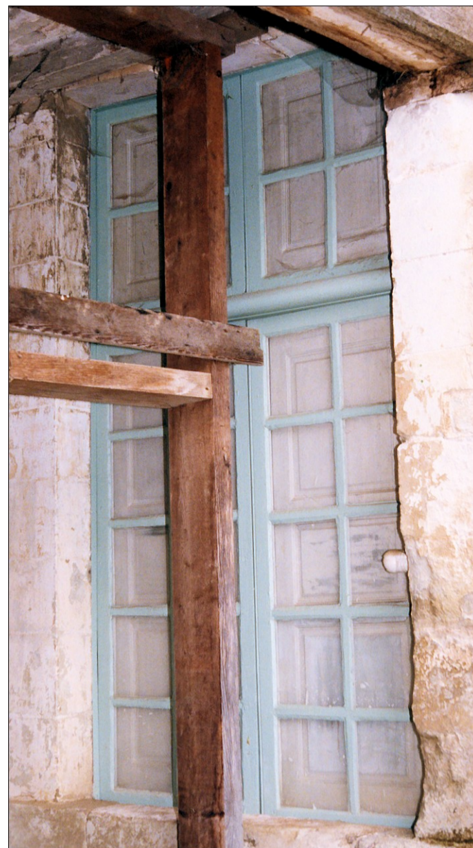
Fig. E.1. Vue extérieure de la croisée

Ses caractéristiques permettent de penser qu'elle a été fabriquée durant le premier quart du XVIII e siècle, période de transition, où la croisée, au sens initial du terme, tend à disparaître pour laisser la place à une fenêtre démunie de toute division.