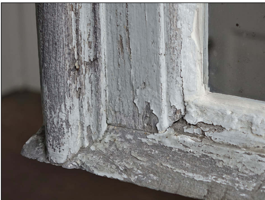
Fig. 7.7. Jet d'eau