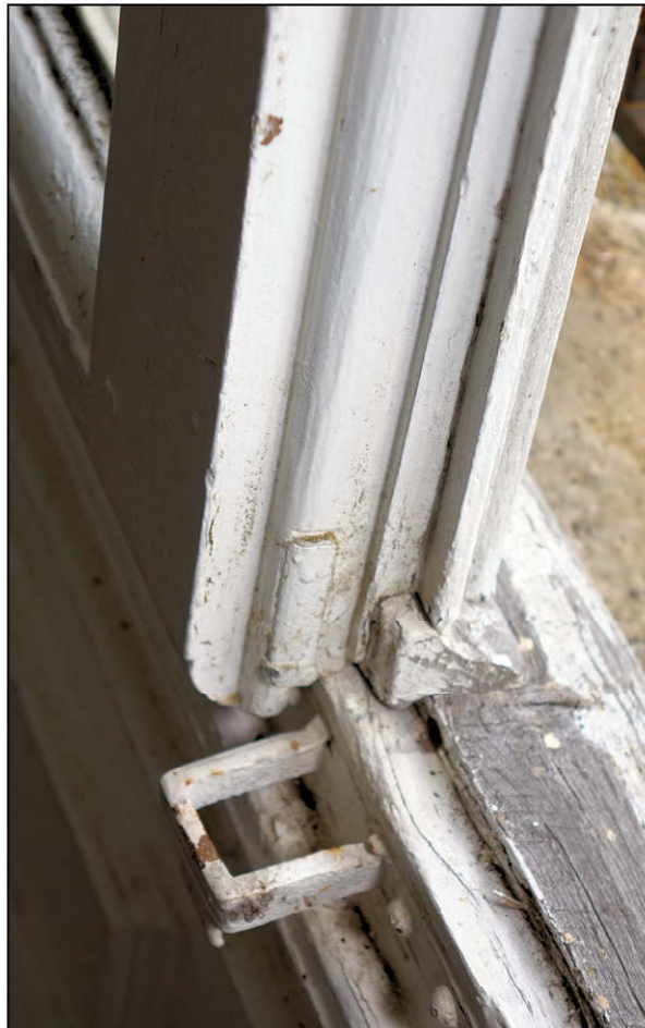
Fig. 7.5. Battant du milieu