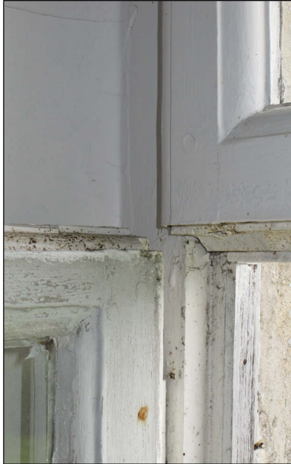
Fig. 7.2. Traverse d'imposte