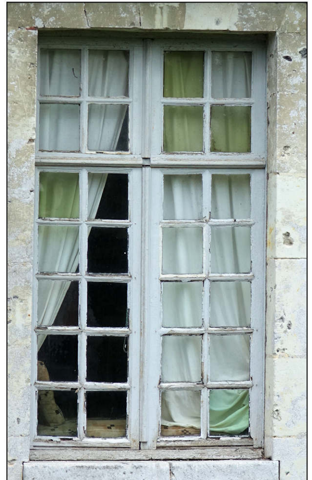
Fig. 7.6. Croisée de l'aile ouest