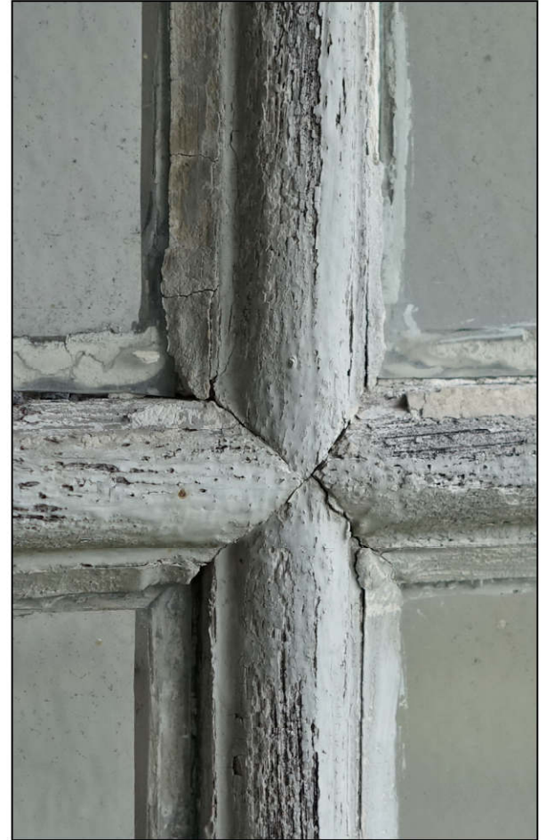
Fig. 7.3. Petits-bois