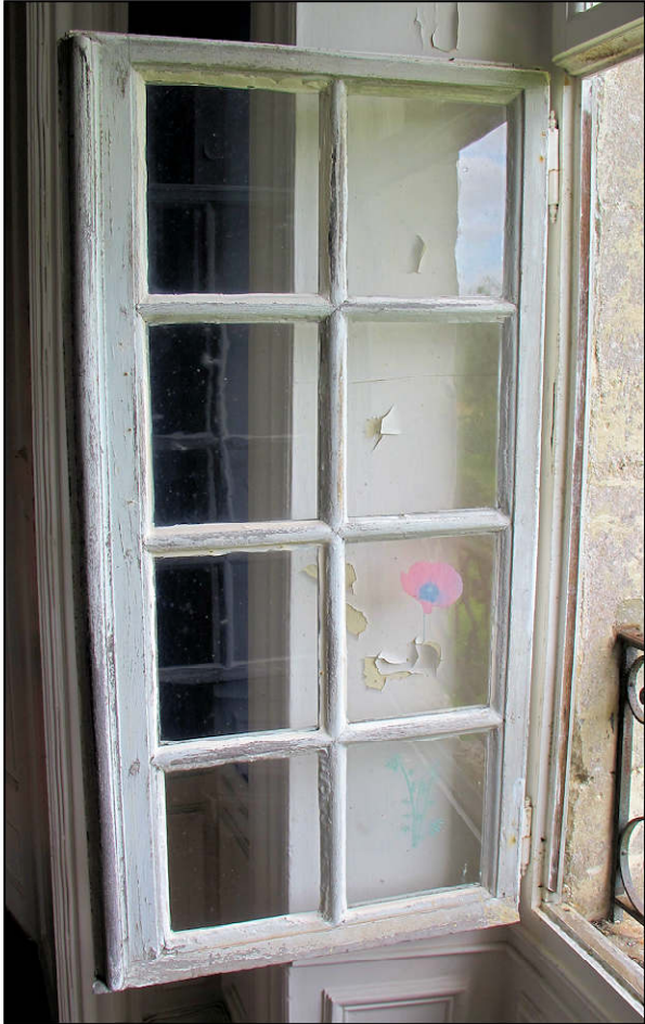
Fig. 7.1. Vantail vitré inférieur gauche