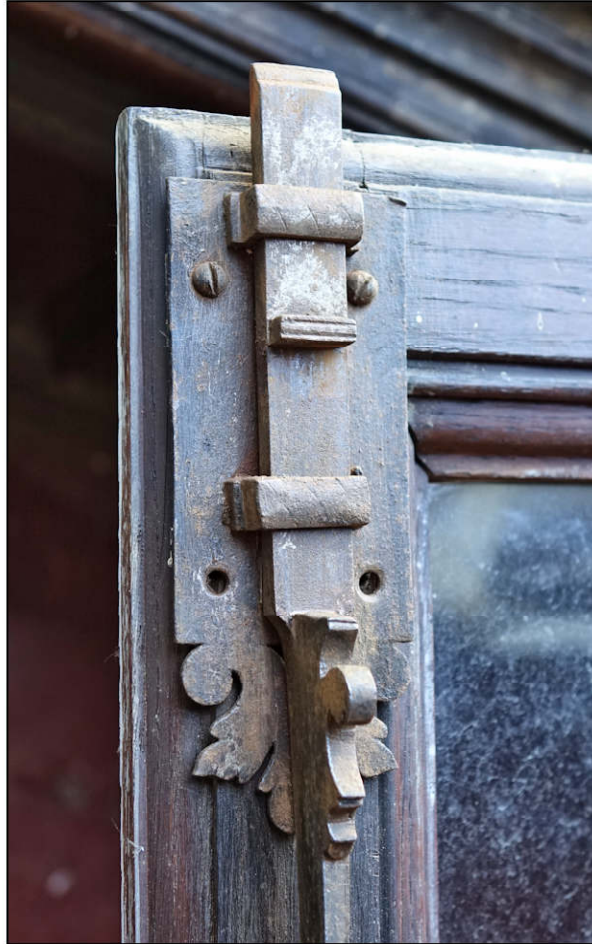
Fig. 3.2. Verrou supérieur