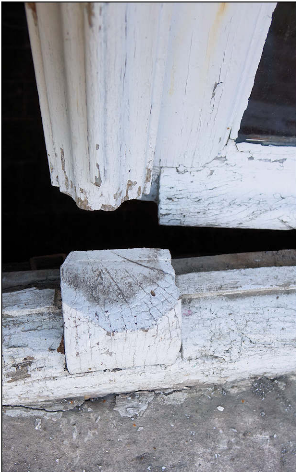
Fig. 3.4. Meneau / pièce d'appui