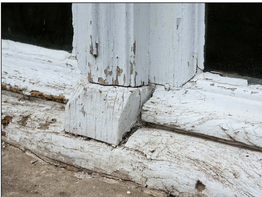
Fig. 3.7. Meneau / pièce d'appui