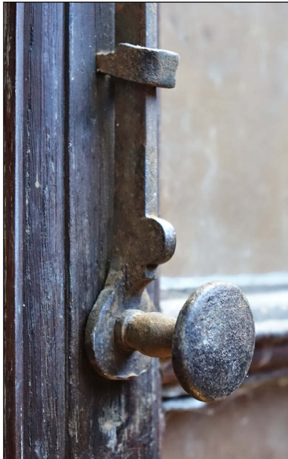
Fig. 3.5. Verrou supérieur