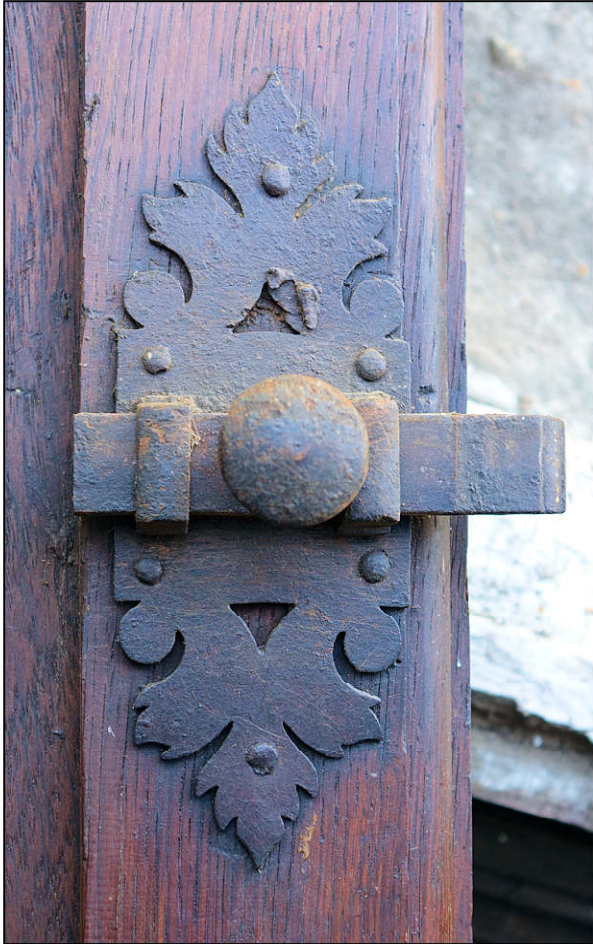
Fig. 3.1. Targette