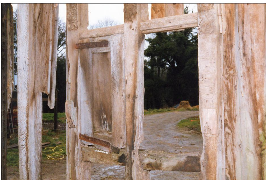
Fig. 2.5. Volet / élévation intérieure