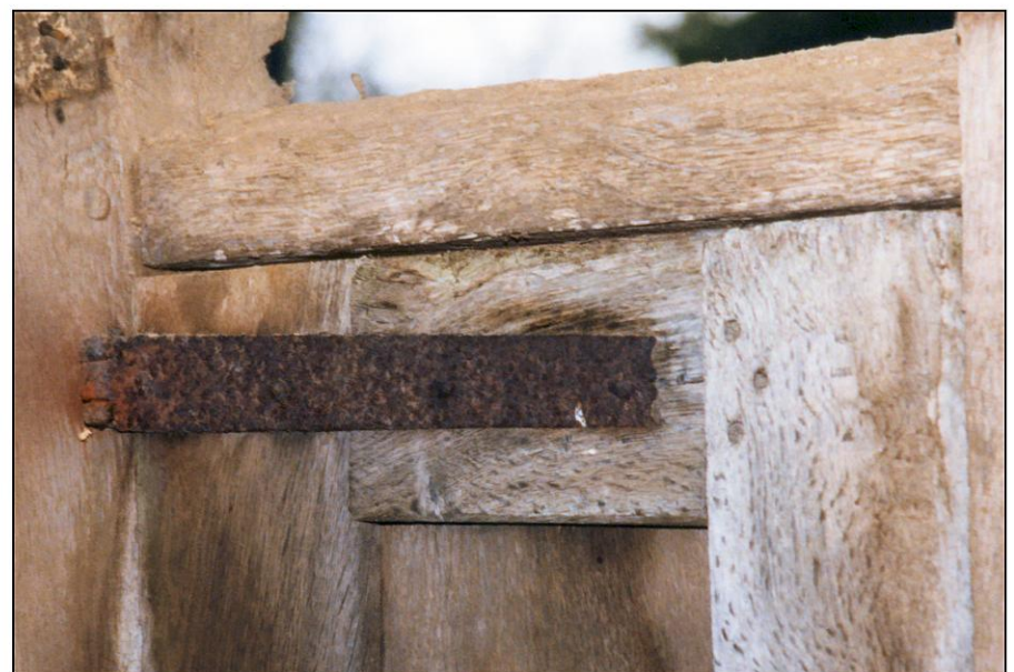
Fig. 2.6. Volet / charnière