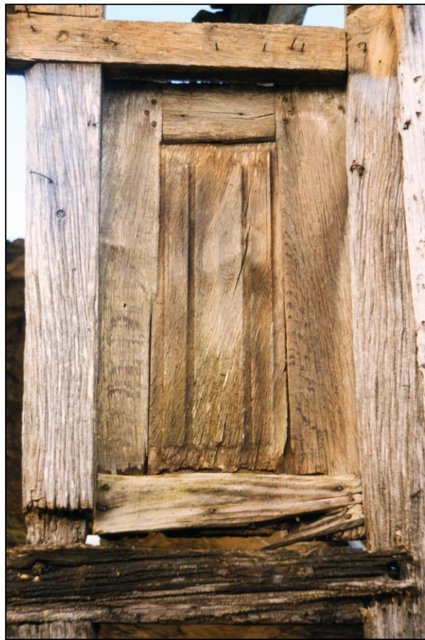
Fig. 2.4. Volet / élévation extérieure